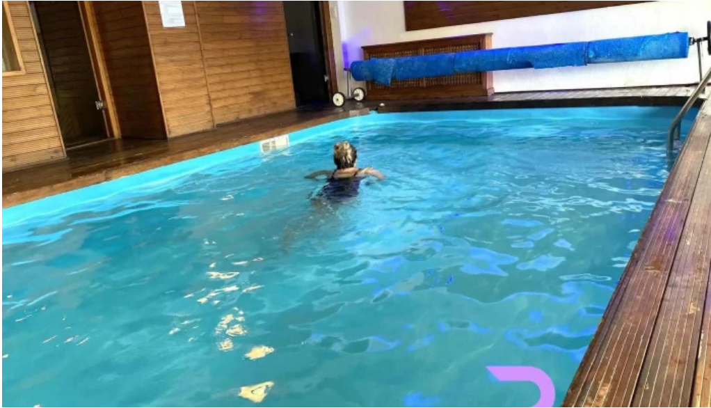
Domeniul dornei dotari