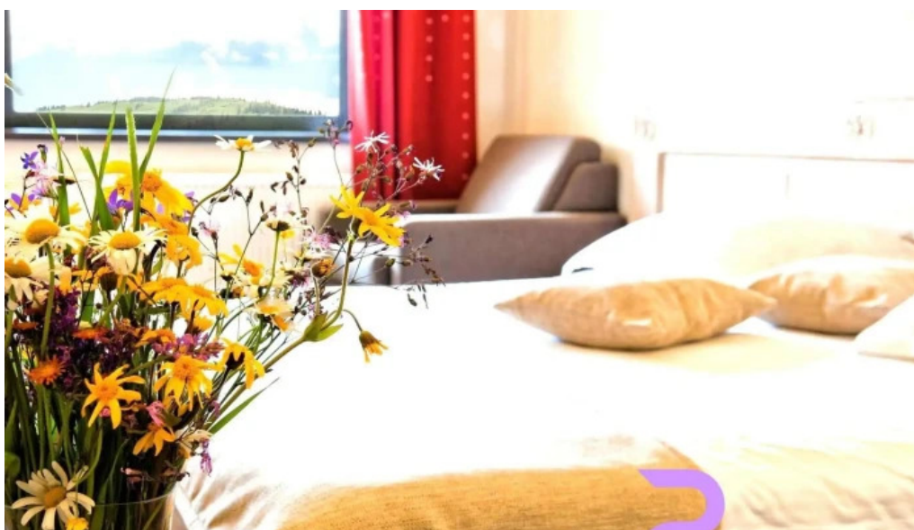
Domeniul dornei camere