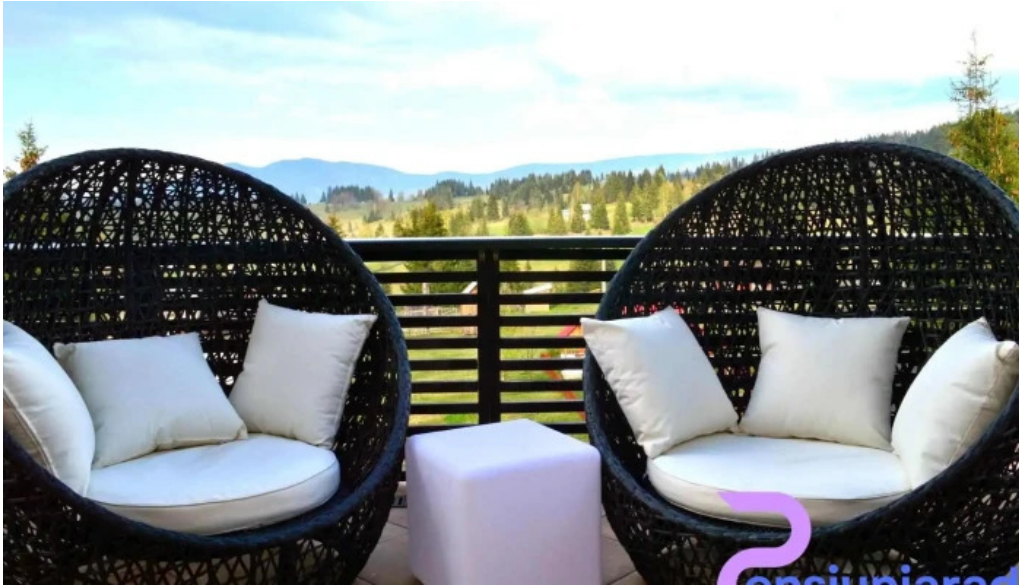
Domeniul dornei de la proprietar