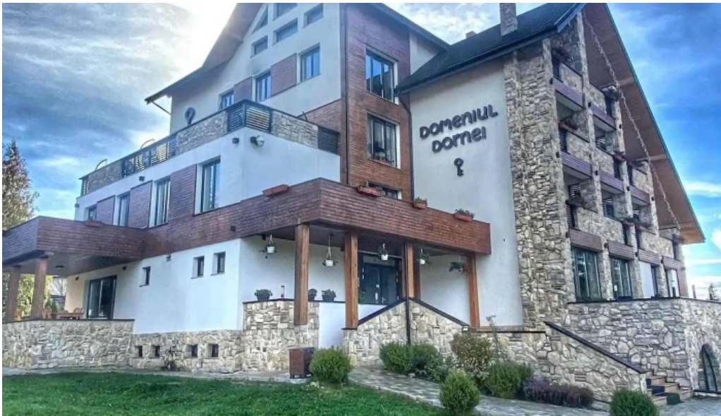
Domeniul dornei de la vizitatori