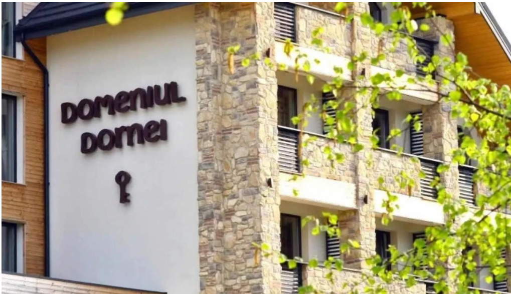
Domeniul dornei comentarii