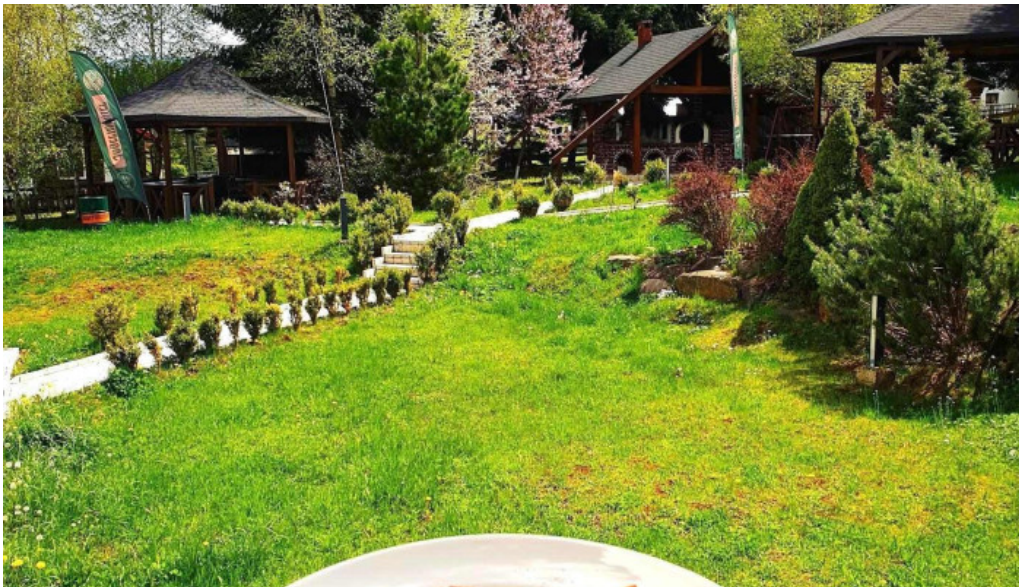
Domeniul dornei mancaruribauturi