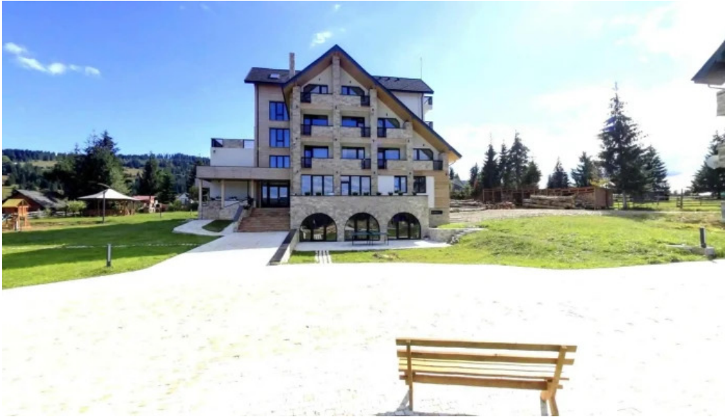
Domeniul dornei street view si 360deg