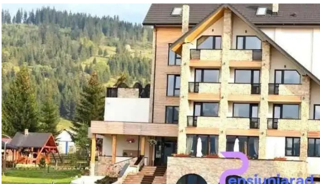
Domeniul dornei vatra dornei