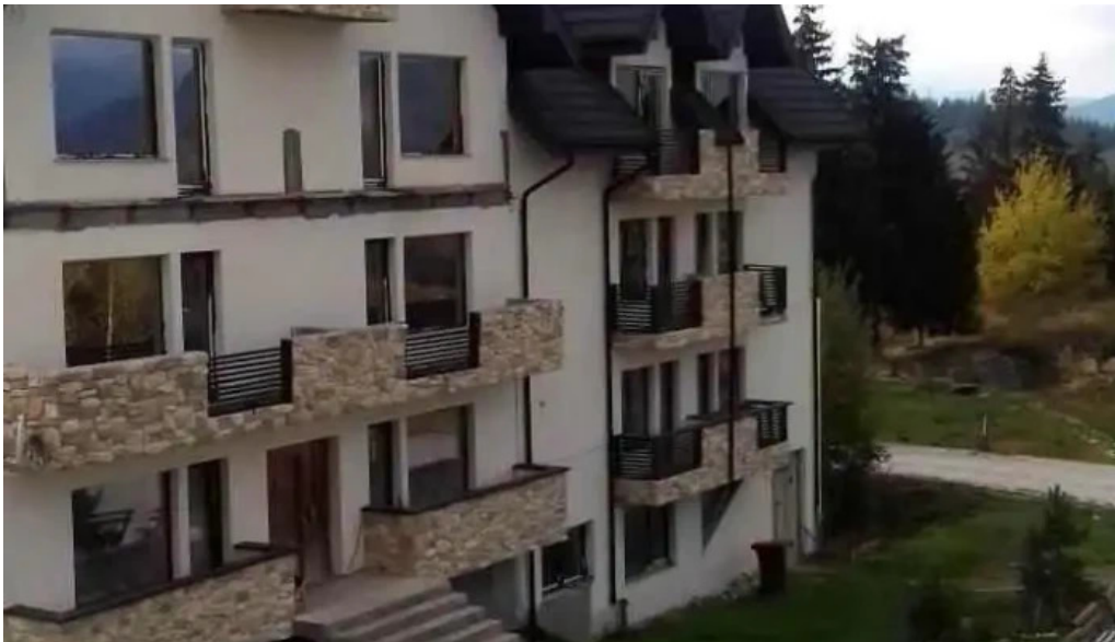
Domeniul dornei exterior