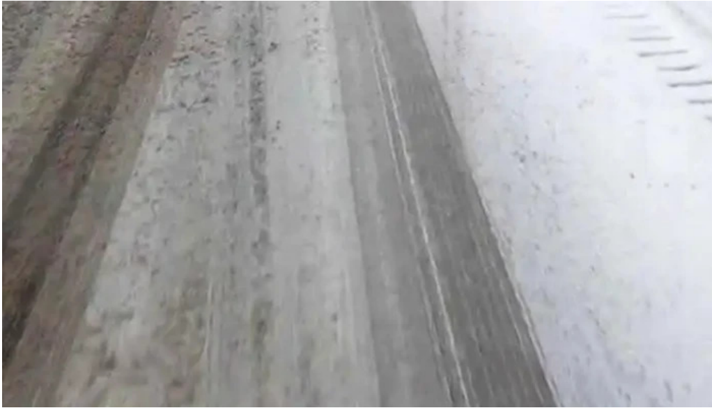
Dor de codru videoclipuri