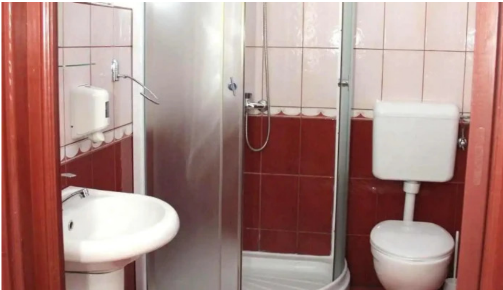
Dor de codru de la proprietar