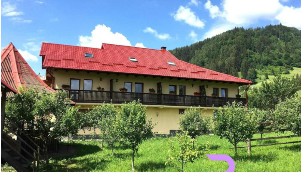
Dor de codru exterior