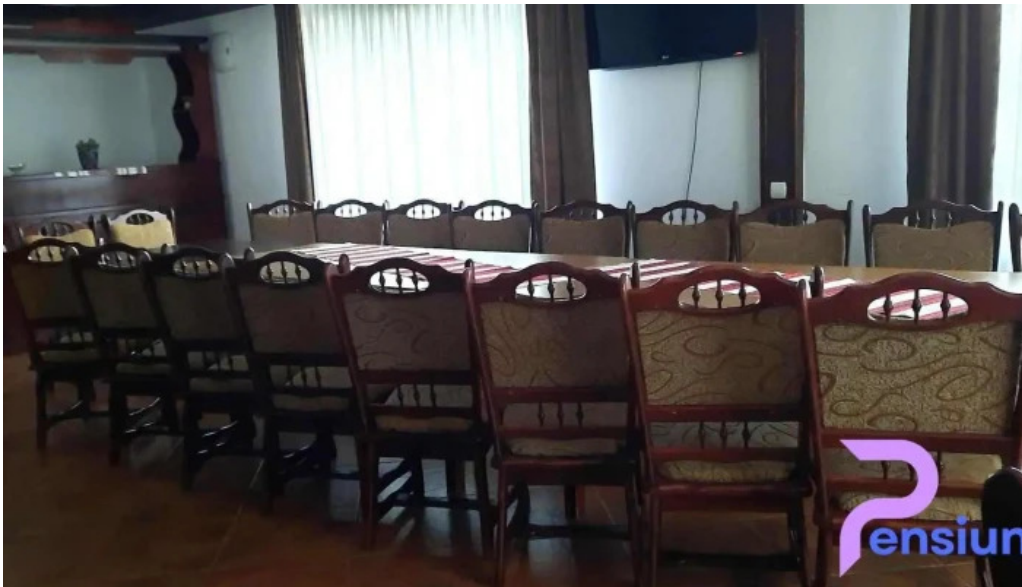
Dor de codru dotari