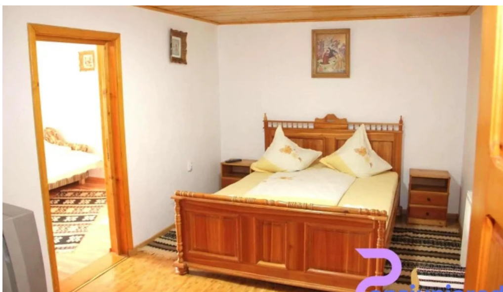
Dor de codru camere