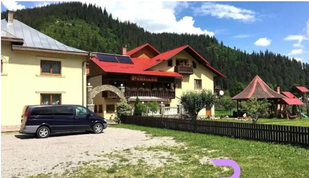
Dor de codru sadova