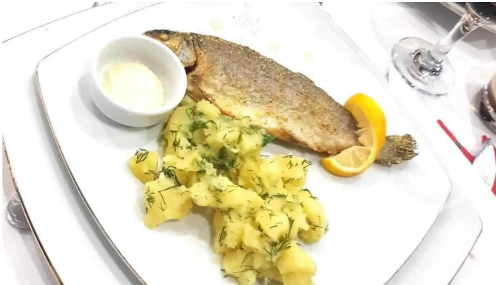
Dor de codru mancaru ribauturi