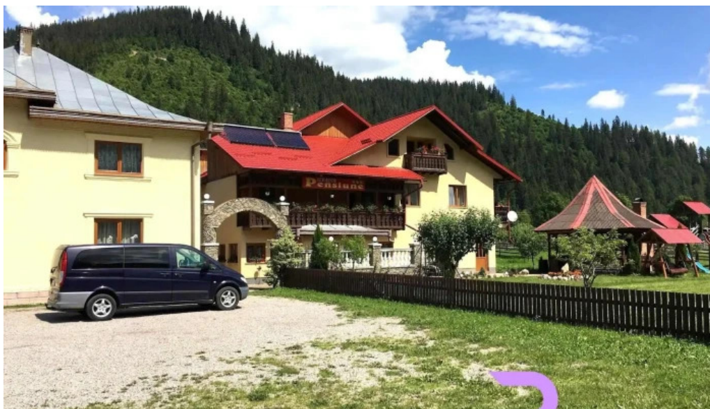
Dor de codru comentarii