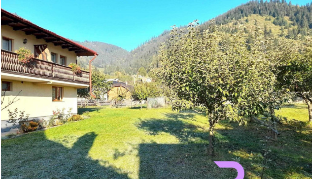
Dor de codru de la vizitatori