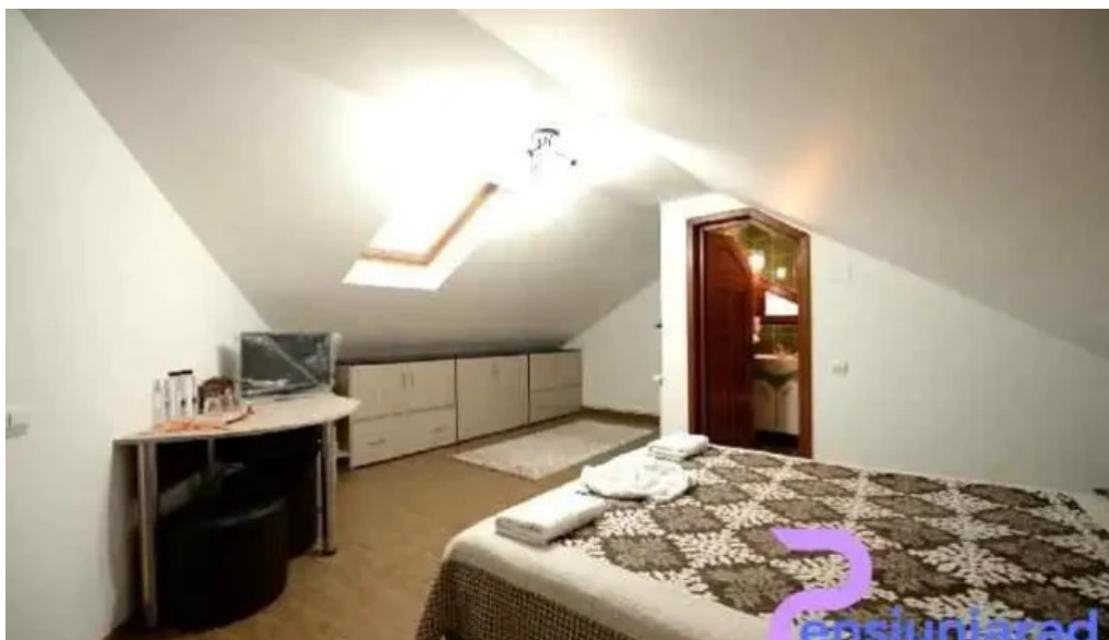
Pensiunea teo andreea camere