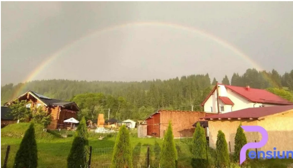
Pensiunea teo andreea panaci