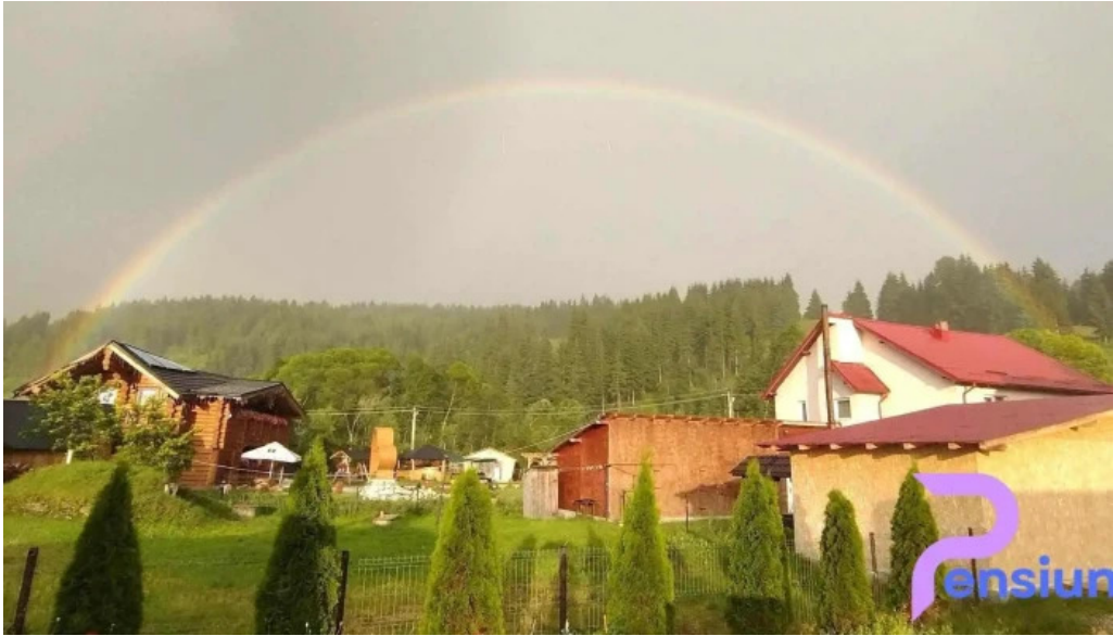
Pensiunea teo andreea program