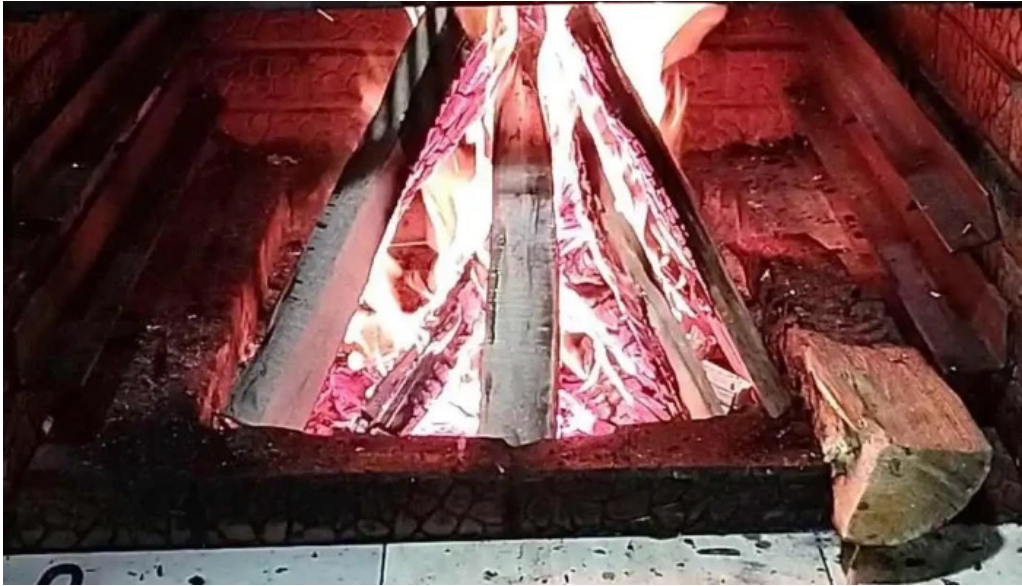
Pensiunea teo andreea videoclipuri