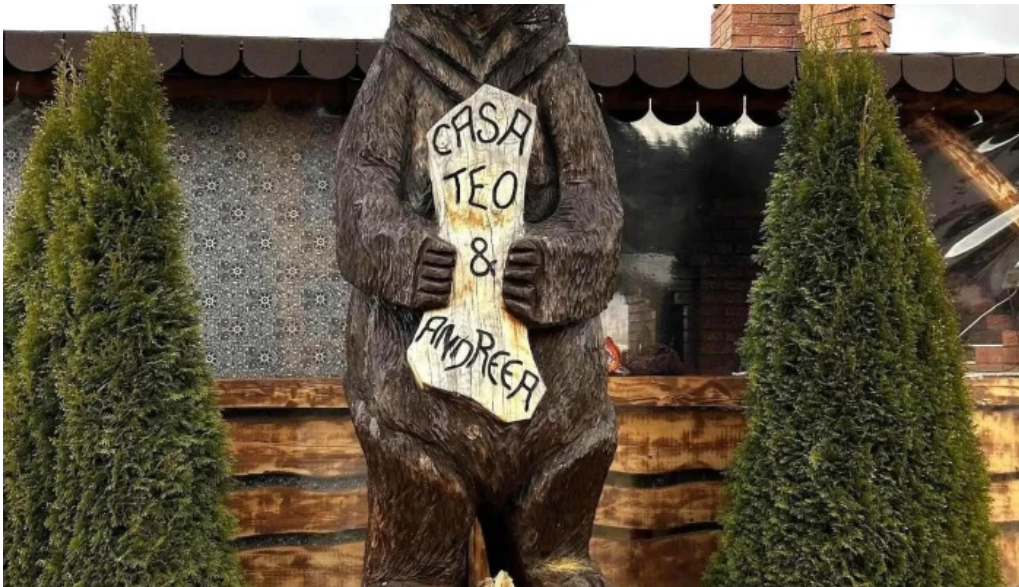
Pensiunea teo andreea de la vizitatori