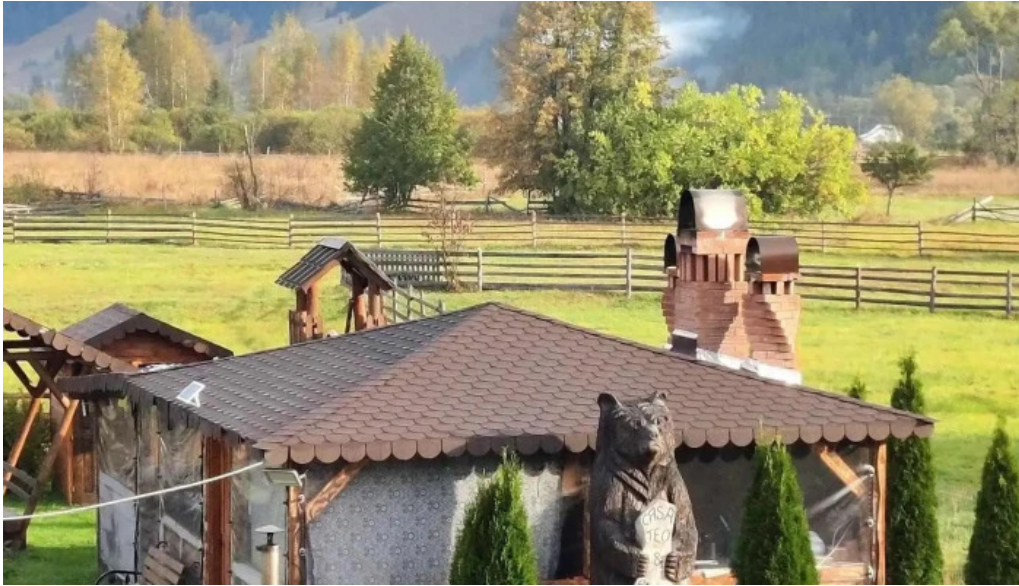
Pensiunea teo andreea exterior