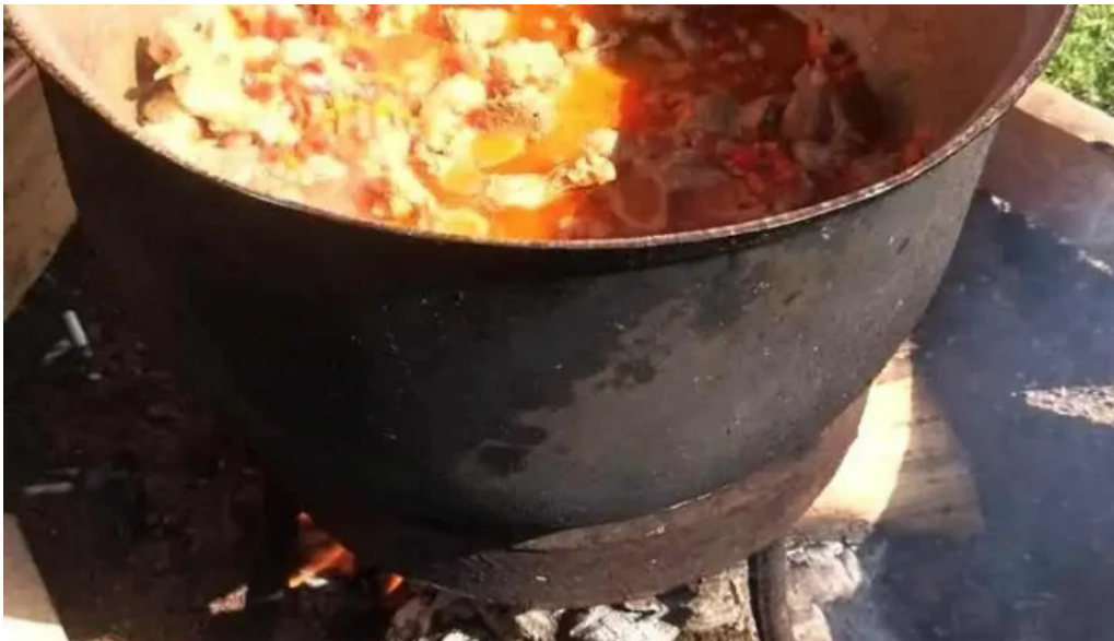
Pensiunea teo andreea mancaruribauturi