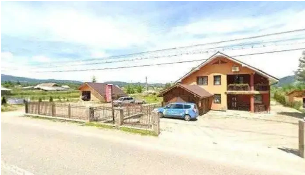
Pensiunea teo andreea street view si 360deg