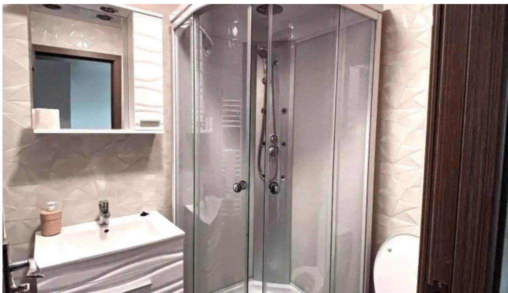
Casa irina de la proprietar