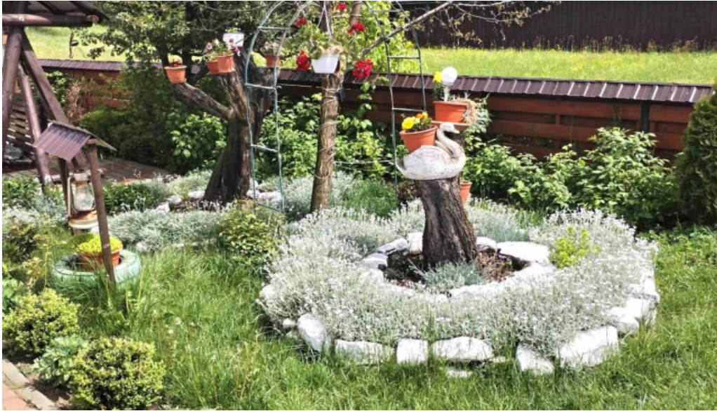
Casa irina zon?