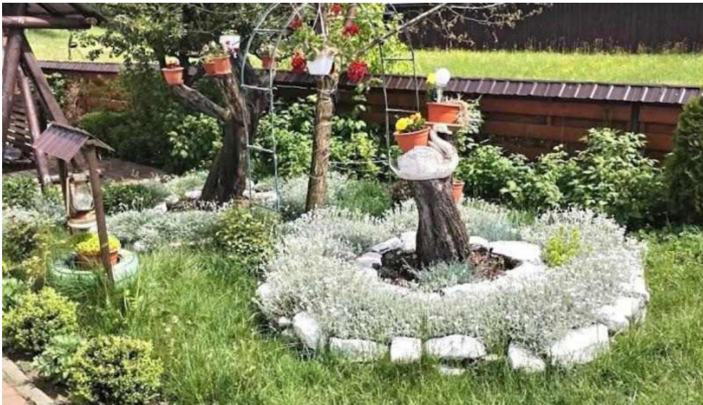
Casa irina m?n?stirea humorului