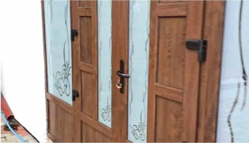
Casa irina exterior