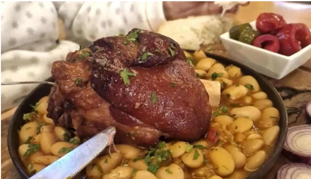
Casa irina mancaruribauturi