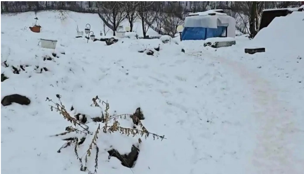
Casa irina videoclipuri