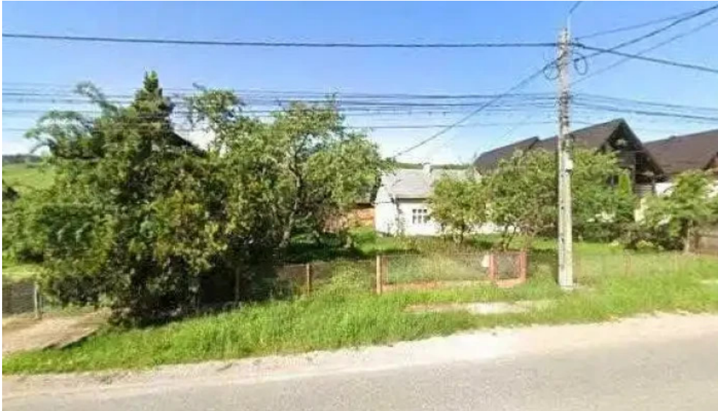
Casa irina street view si 360deg