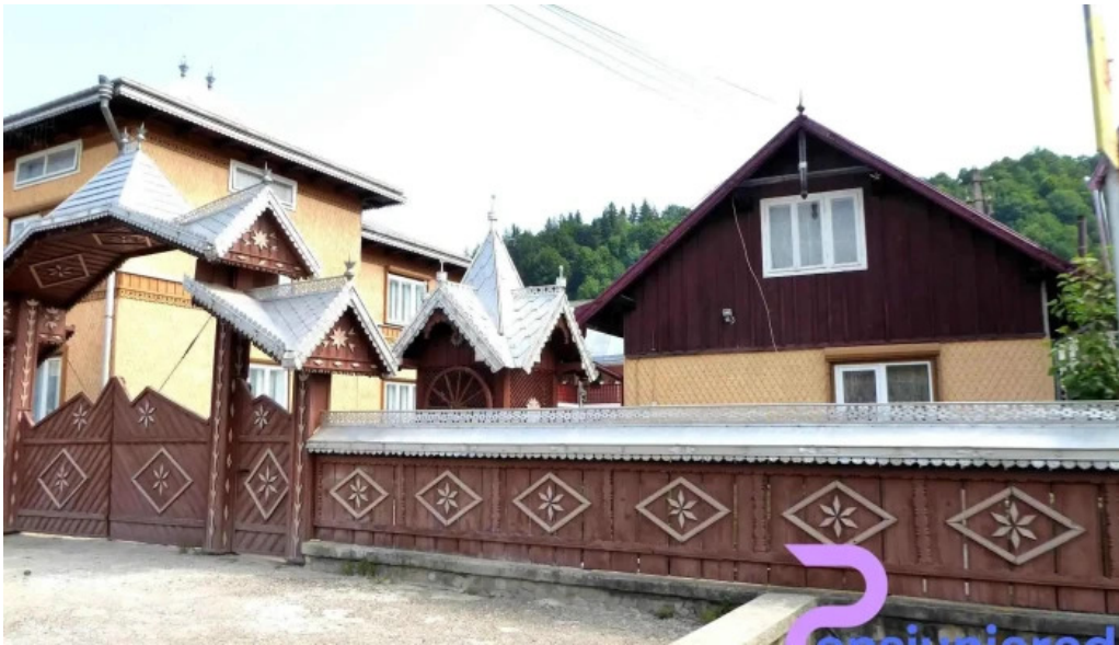
Casa irina de la vizitatori