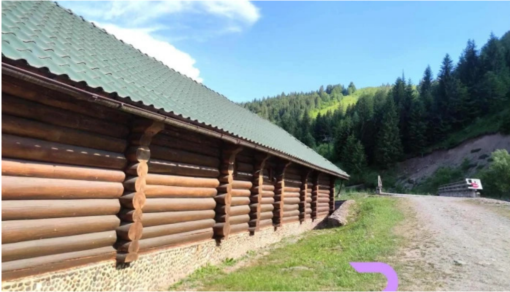
Mama uta comentarii