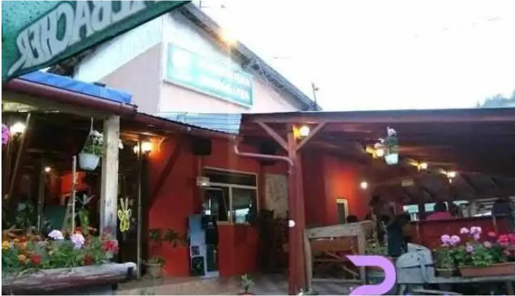
Mama u?a garda de sus