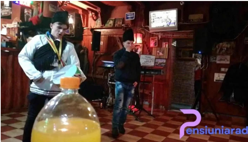
Mama uta de la vizitatori