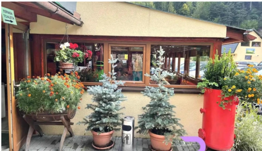
Mama uta exterior