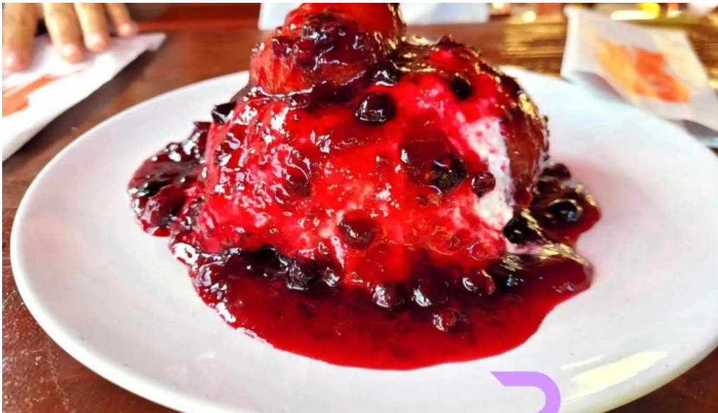
Mama uta mancaruribauturi