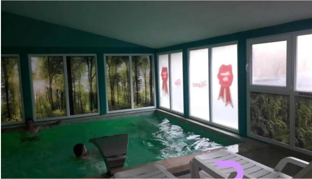
Mama uta dotari