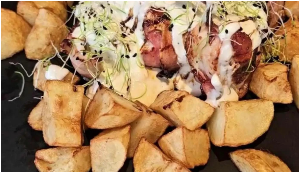
Mama uta videoclipuri