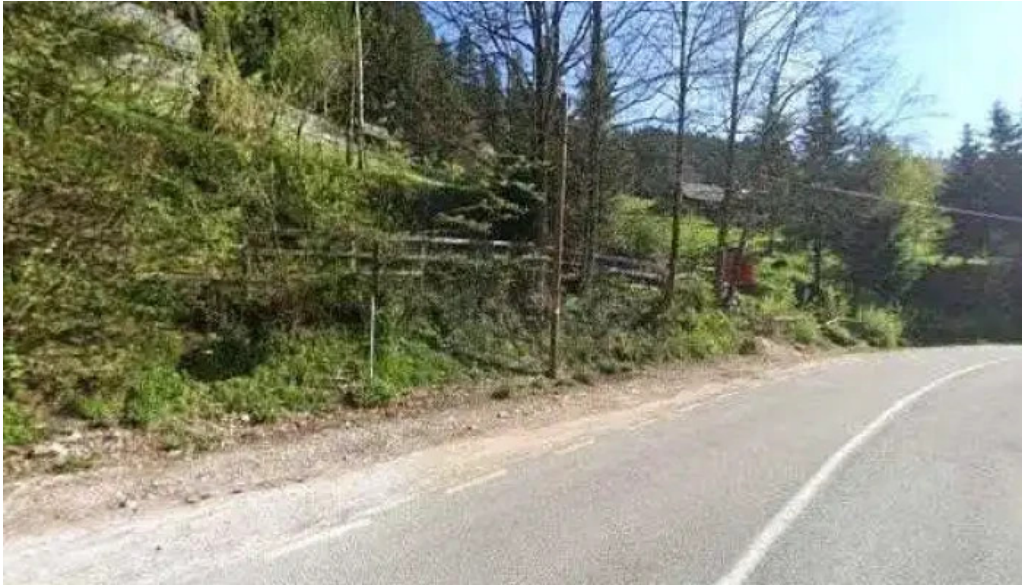
Mama uta street view si 360deg