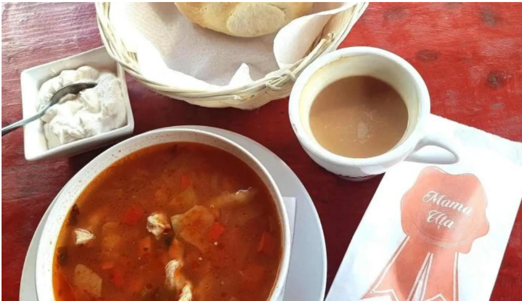
Mama uta cele mai recente