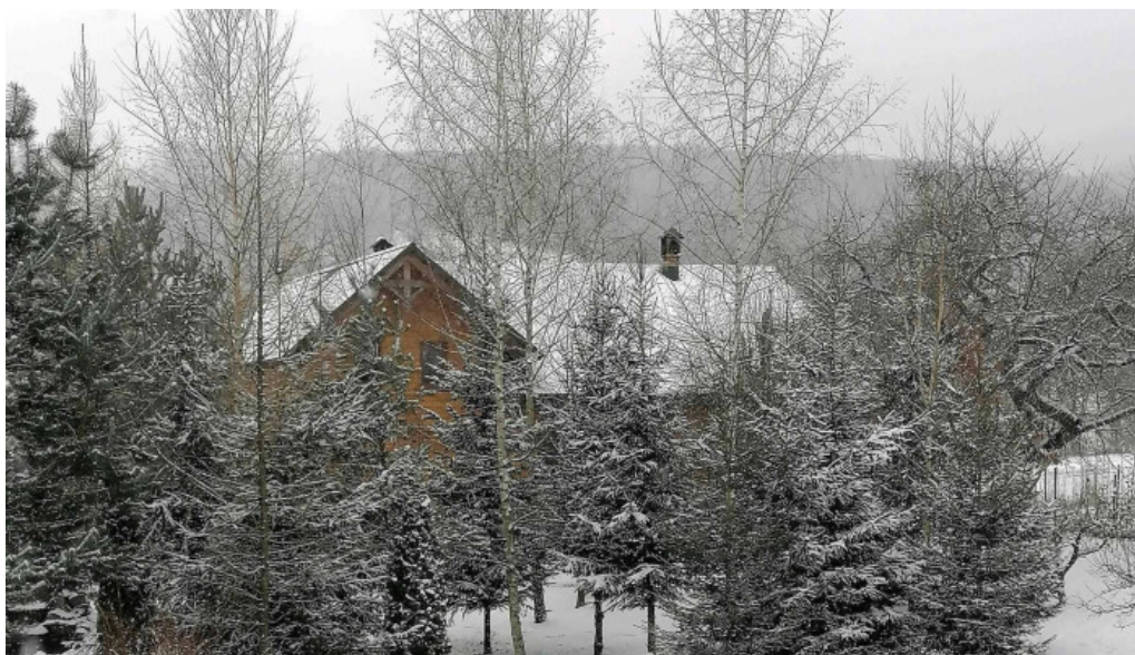
Casa rita adres?