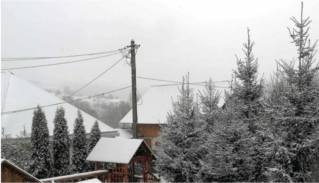
Casa rita reduceri