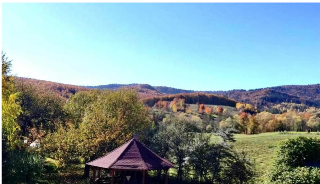
Casa rita cacica