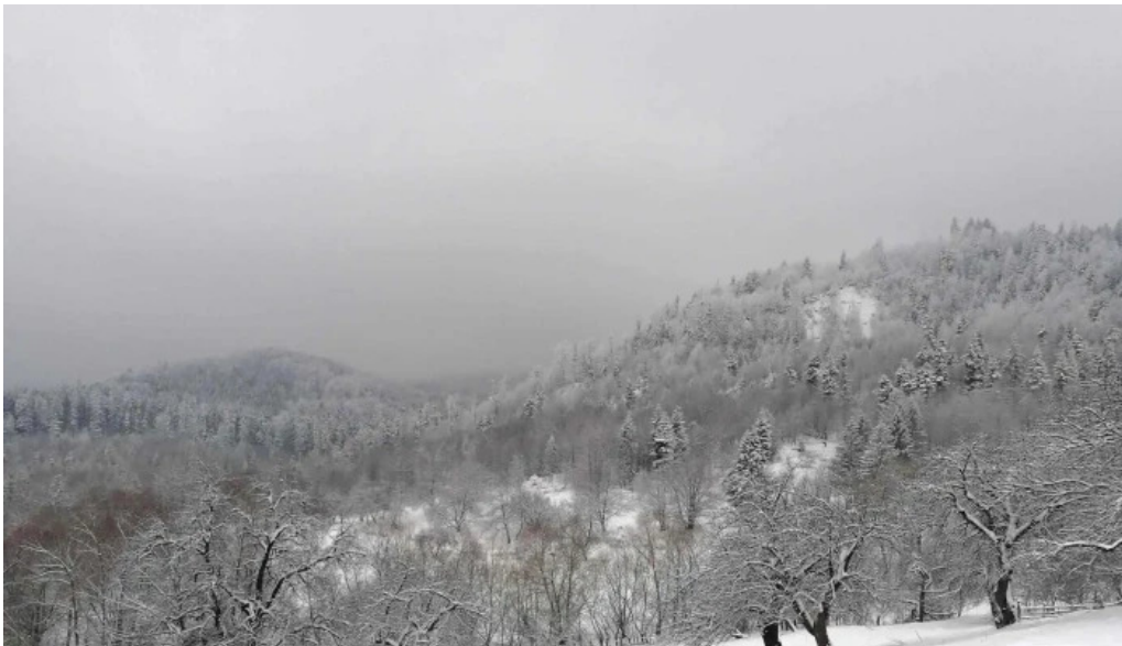
Casa rita fotografii