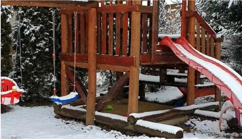
Casa rita de la proprietar