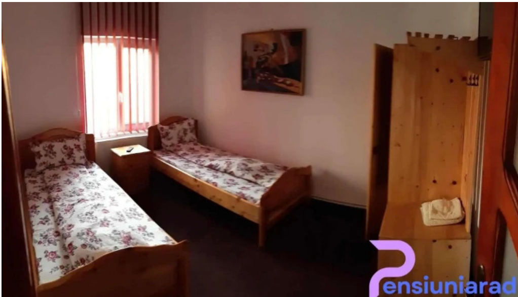
Casa rita camere