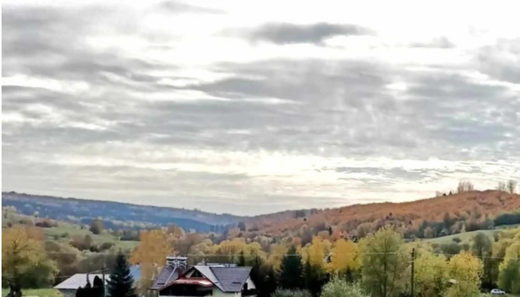
Casa rita recenzii