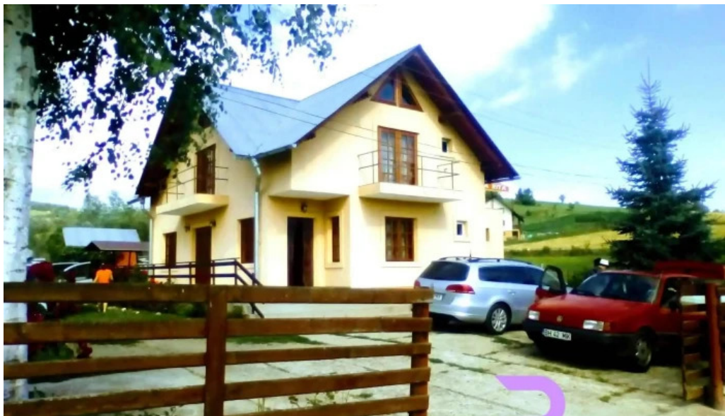
Casa rita de la vizitatori