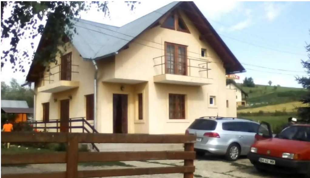
Casa rita loca?ie