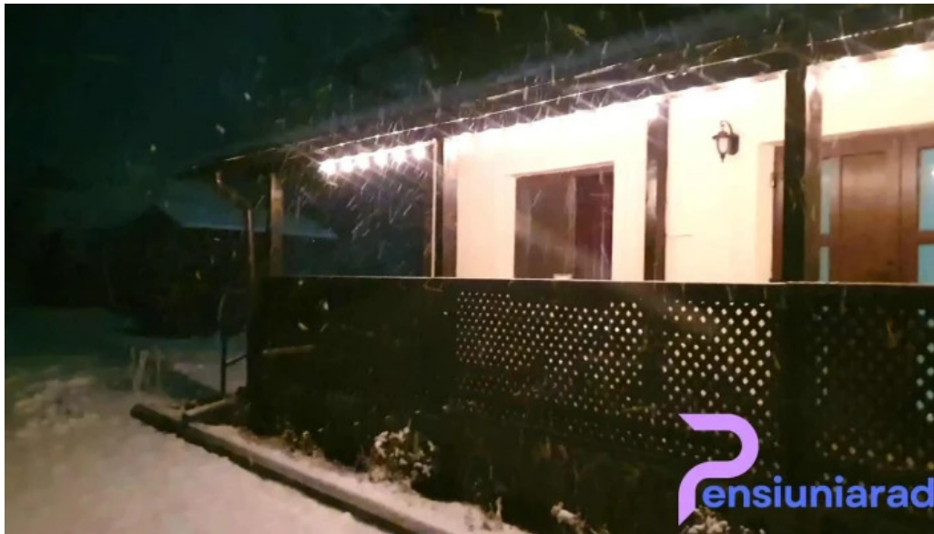
Casa rita exterior