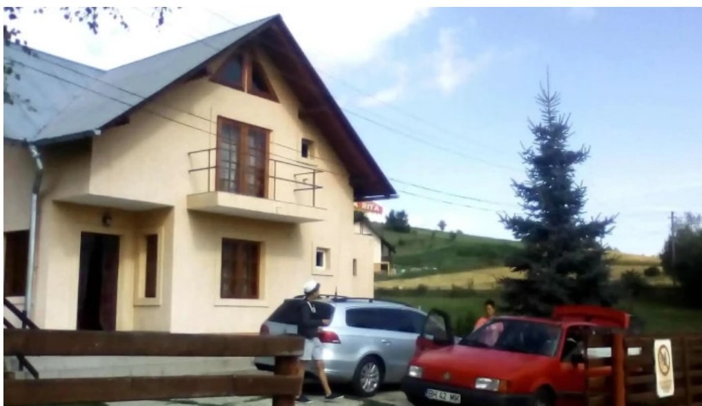
Casa rita site web