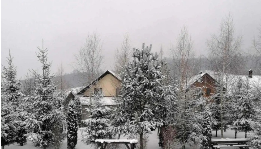
Casa rita promo?ie