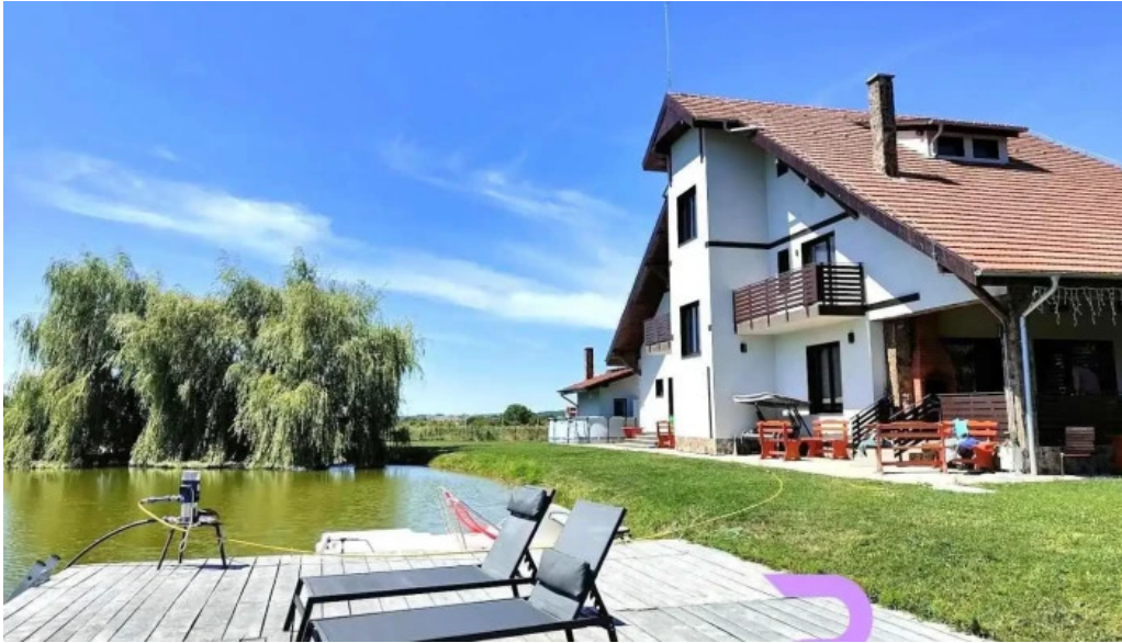
Pensiunea trec?toarea lupilor burda