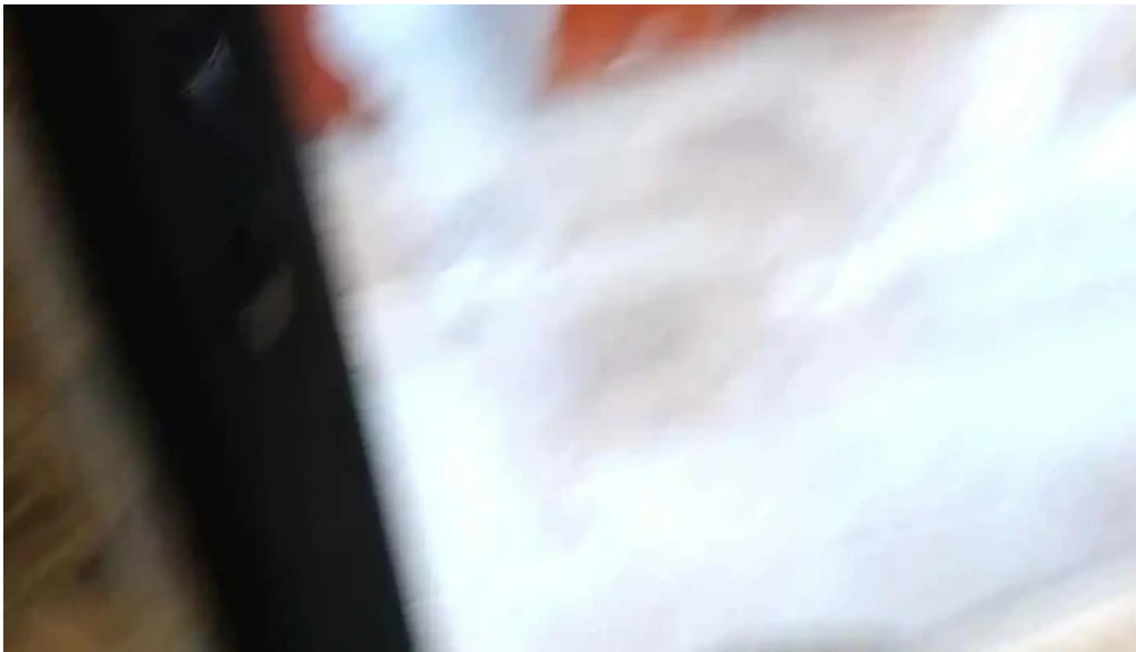
Pensiunea trecatoarea lupilor videoclipuri