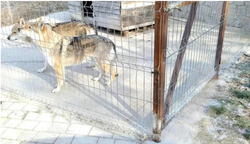
Pensiunea trecatoarea lupilor cele mai recente