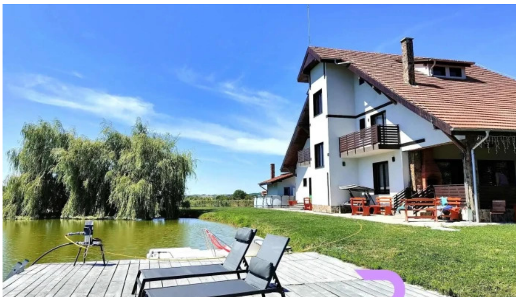
Pensiunea trecatoarea lupilor catalog