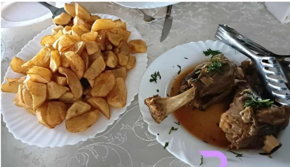
Pensiunea trecatoarea lupilor mancaruribauturi