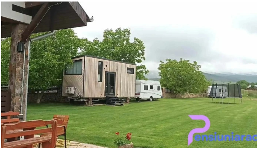
Pensiunea trecatoarea lupilor exterior