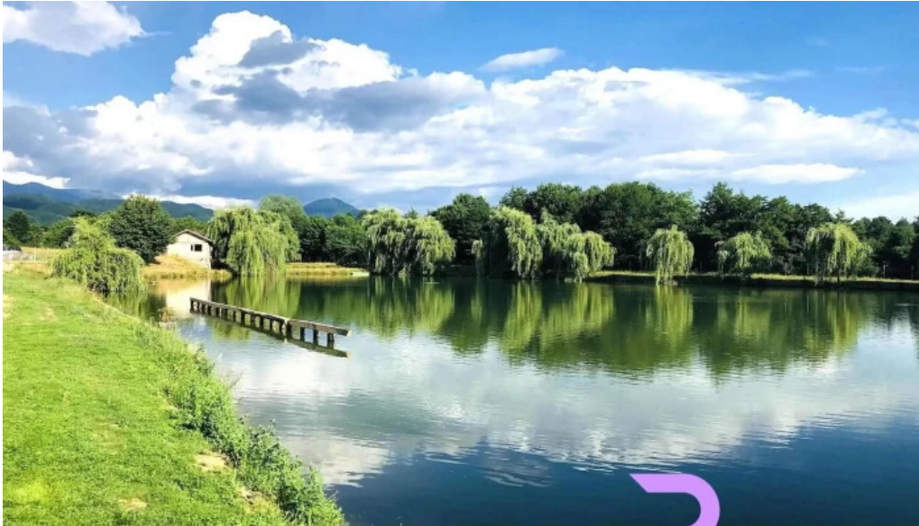
Pensiunea trecatoarea lupilor de la vizitatori