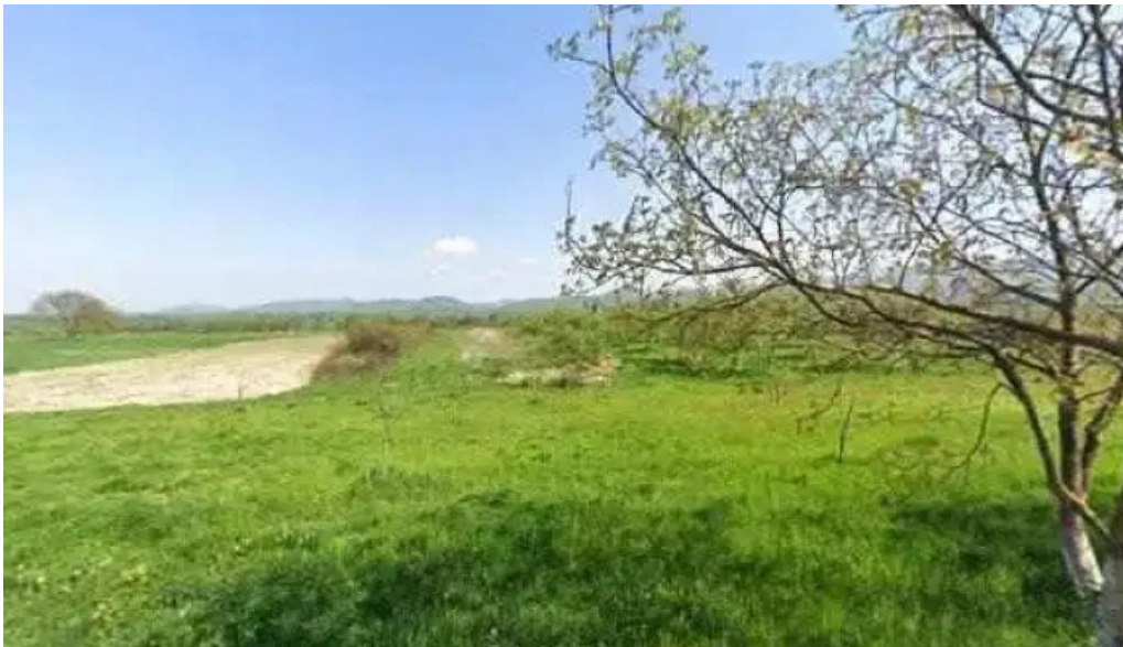
Pensiunea trecatoarea lupilor street view si 360deg