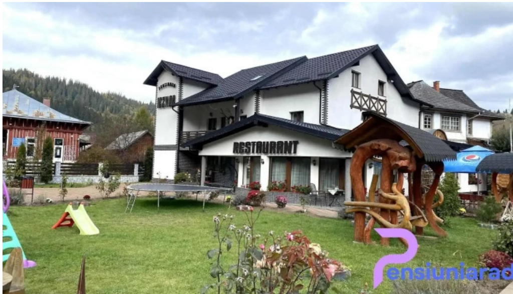
lezilor de la vizitatori