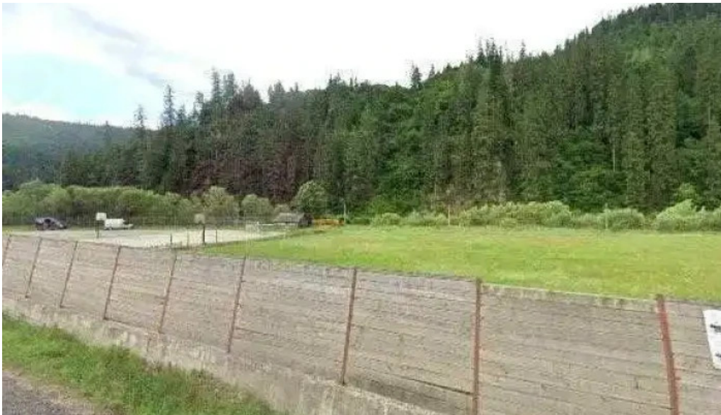
lezilor street view si 360deg