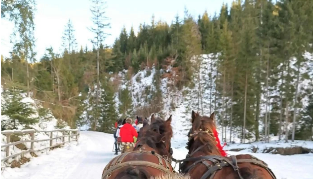
Pensiunea vatra satului vatra moldovi?ei