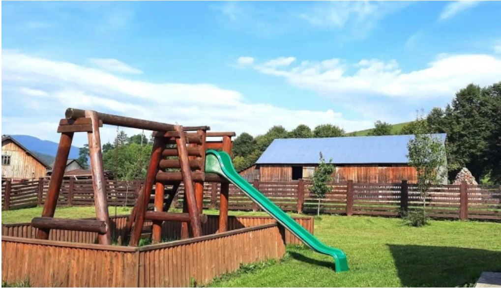
Pensiunea vatra satului instagram