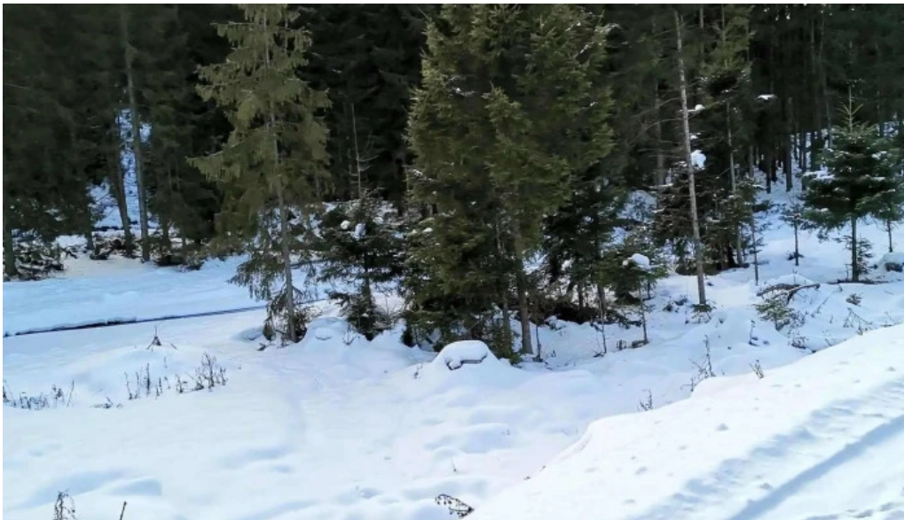
Pensiunea vatra satului comentarii