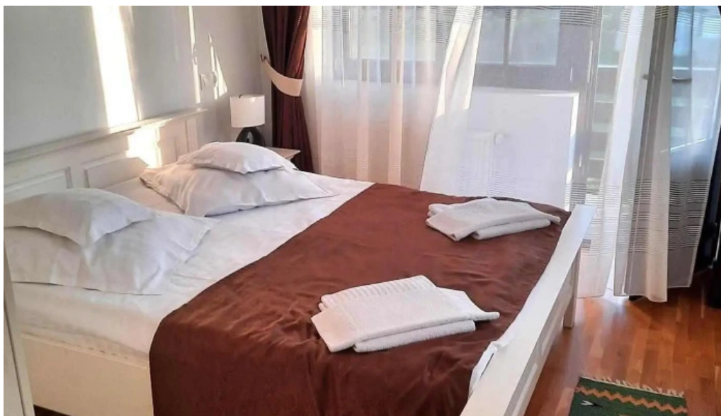
Pensiunea vatra satului camere