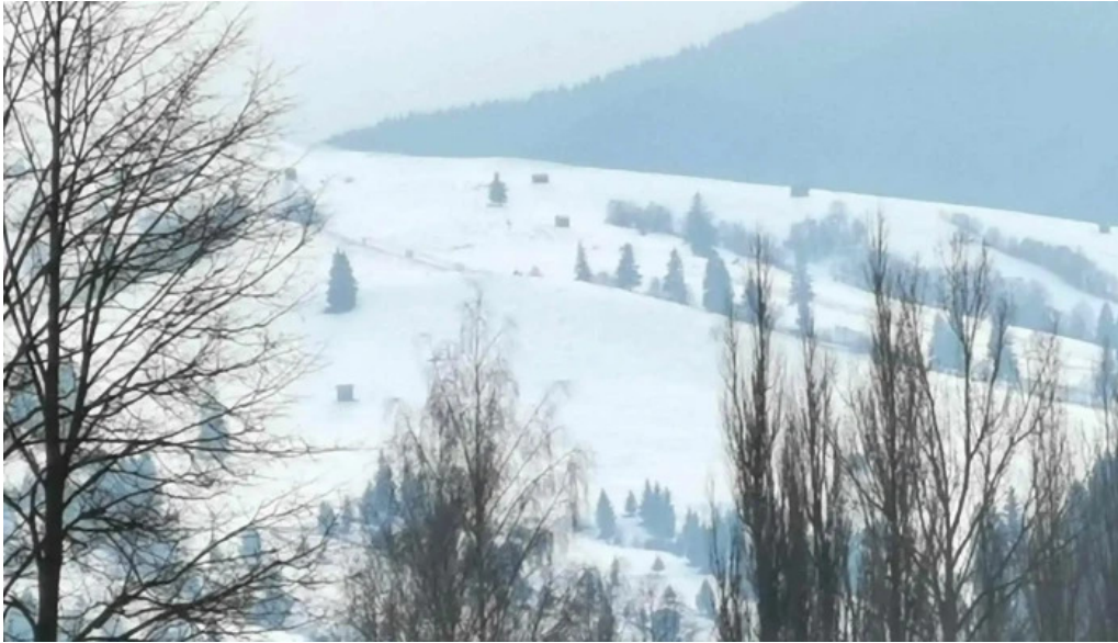
Pensiunea vatra satului telefon