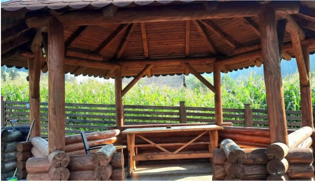
Pensiunea vatra satului cum s? ajungi acolo