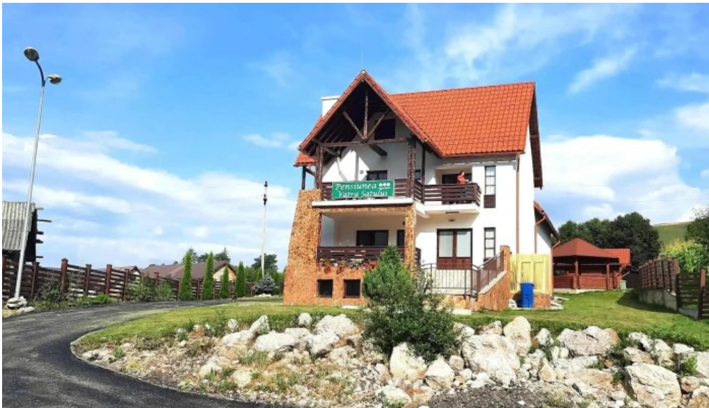
Pensiunea vatra satului loca?ie