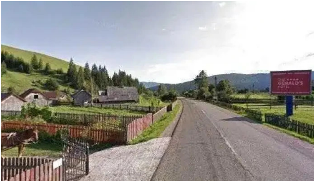
Pensiunea vatra satului street view si 360deg