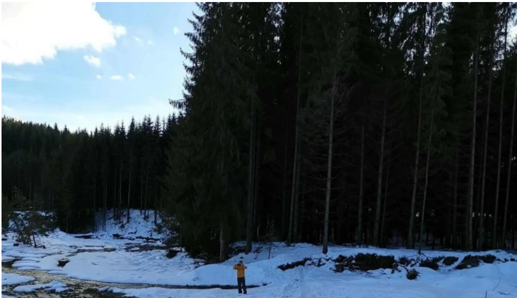
Pensiunea vatra satului unde