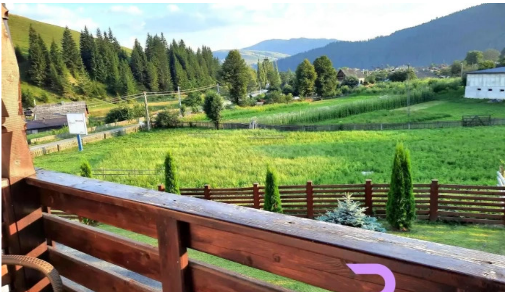
Pensiunea vatra satului de la vizitatori