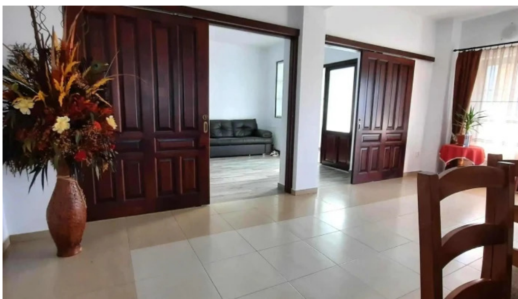
Pensiunea vatra satului adres?