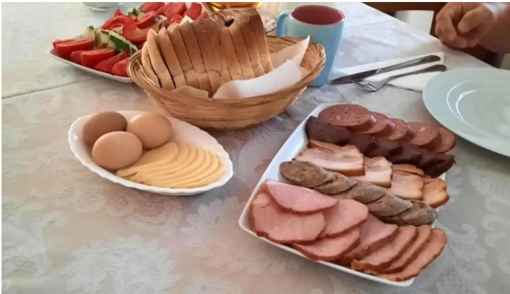
Pensiunea vatra satului mancaruribauturi