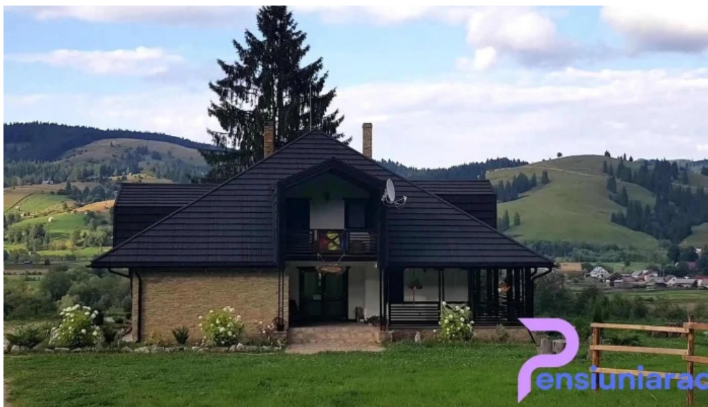
Pensiunea maria bucovina exterior