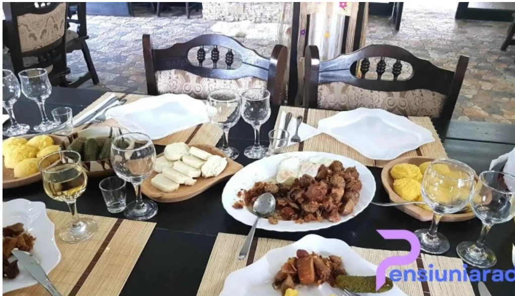
Pensiunea maria bucovina mancaruribauturi