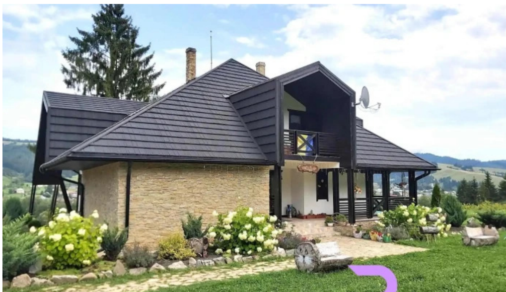
Pensiunea maria bucovina de la vizitatori