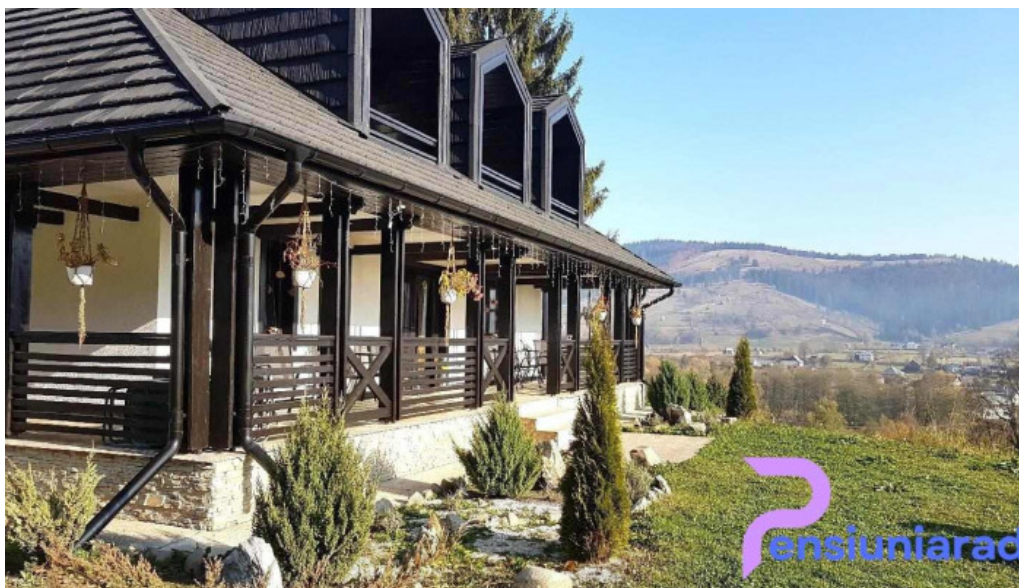
Pensiunea maria bucovina cum s? ajungi acolo