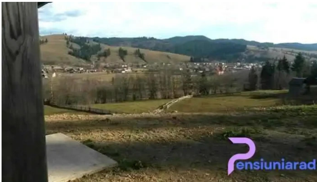
Pensiunea maria bucovina de la proprietar