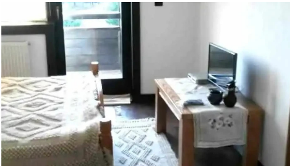
Pensiunea maria bucovina camere