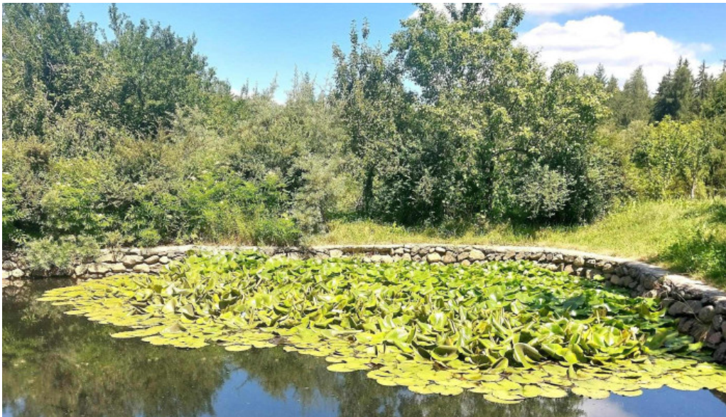
Manastirea slanic scor