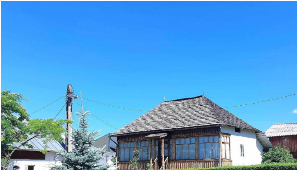
Manastirea slanic zon?