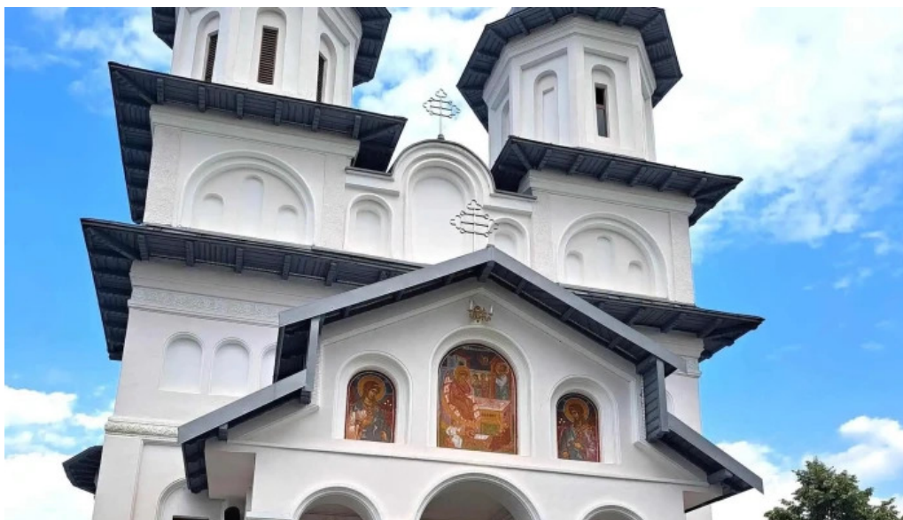
Manastirea slanic cum s? ajungi acolo