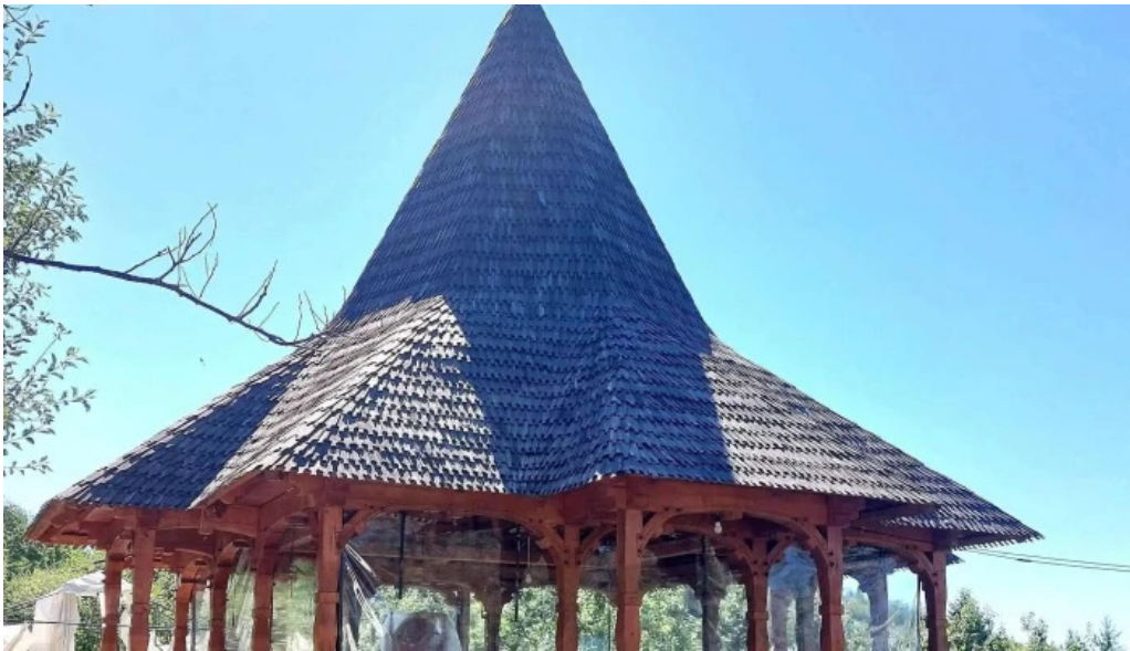
Manastirea slanic unde