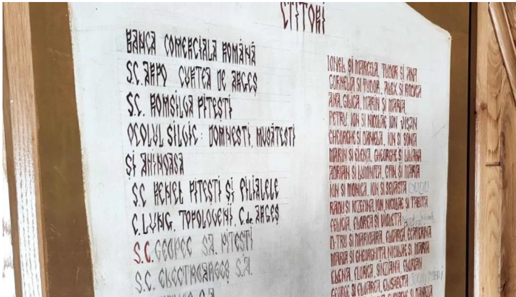
Manastirea slanici loca?ie