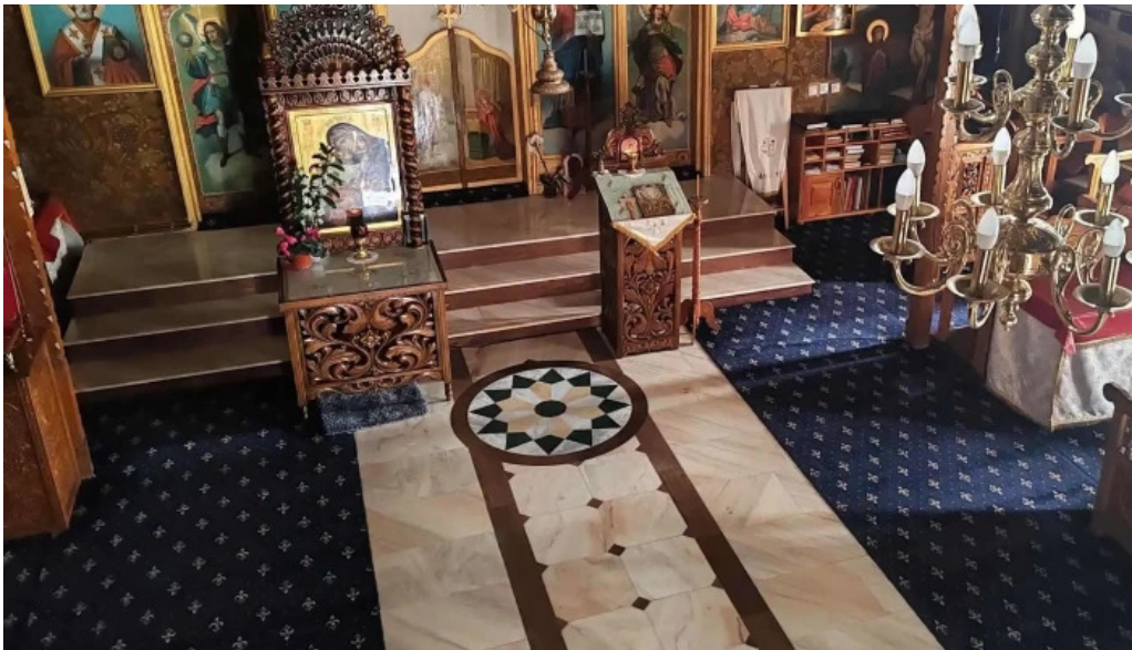
Manastirea slanic promo?ie