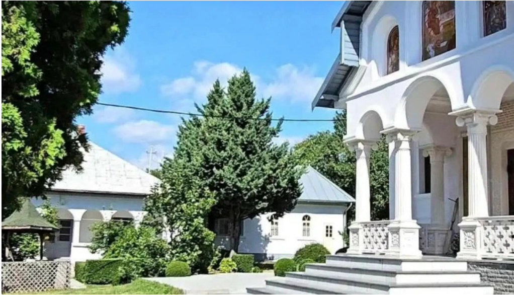
Manastirea slanic videoclipuri