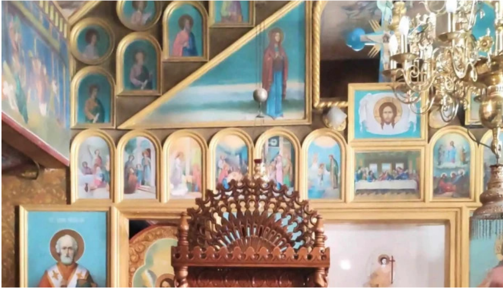
Manastirea slanic romania