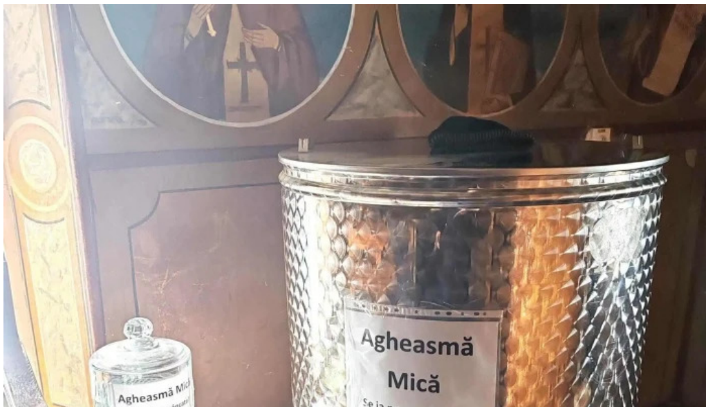
Manastirea slanic num?r