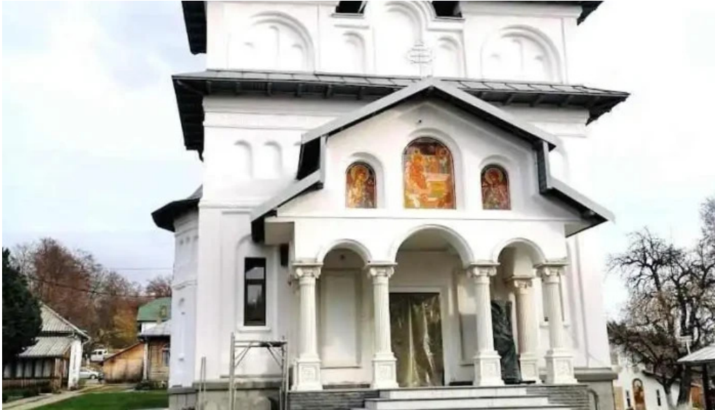
Mănăstirea slanic romania