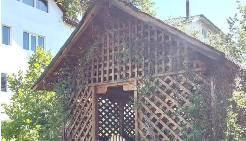
Manastirea slanic telefon