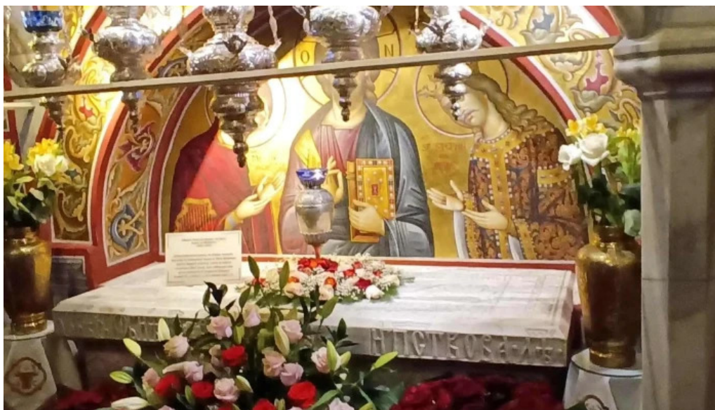
Manastirea sihastria putnei videoclipuri