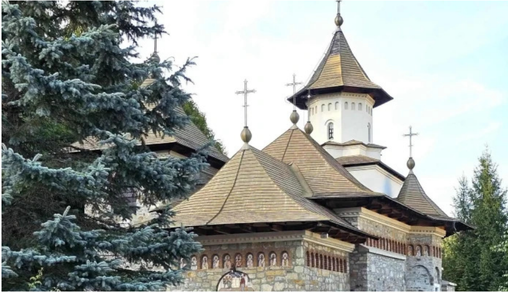
Manastirea sihastria putnei pre?uri