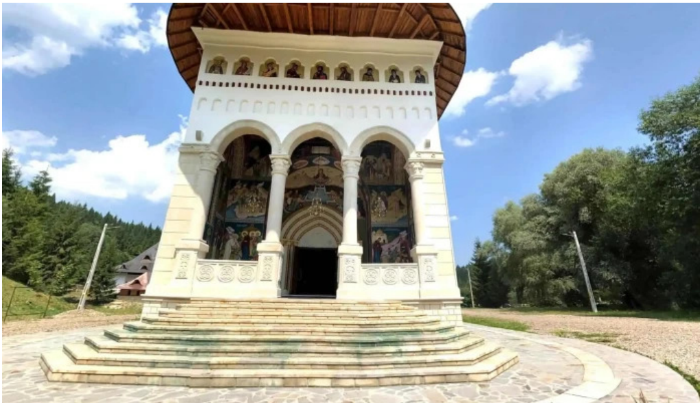
Manastirea sihastria putnei street view si 360deg