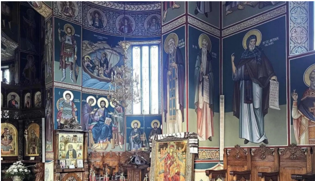
Manastirea sihastria putnei recenzii