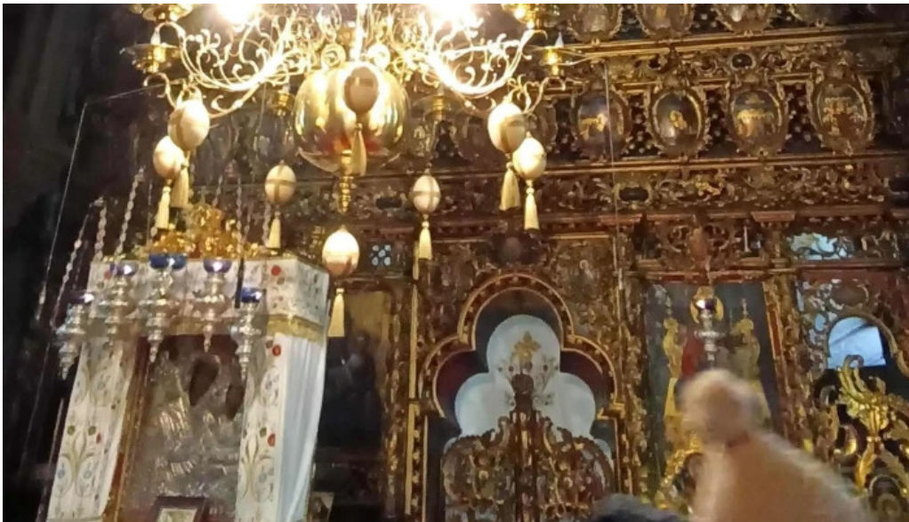
Manastirea sihastria putnei romania