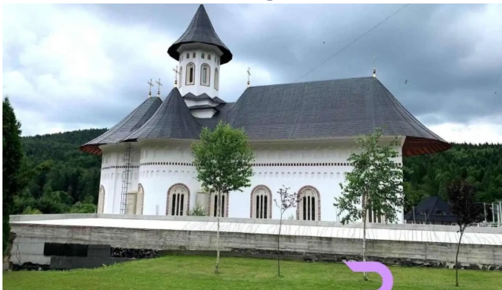
Mănăstirea sihăstria putnei romania