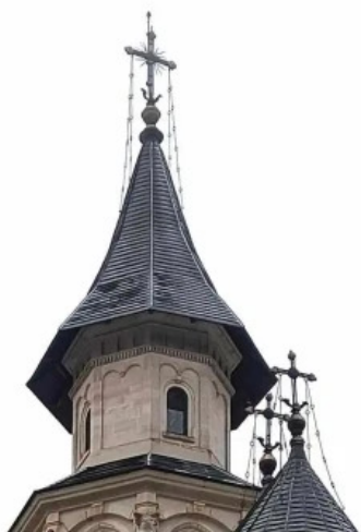
Manastirea sihastria putnei fotografii