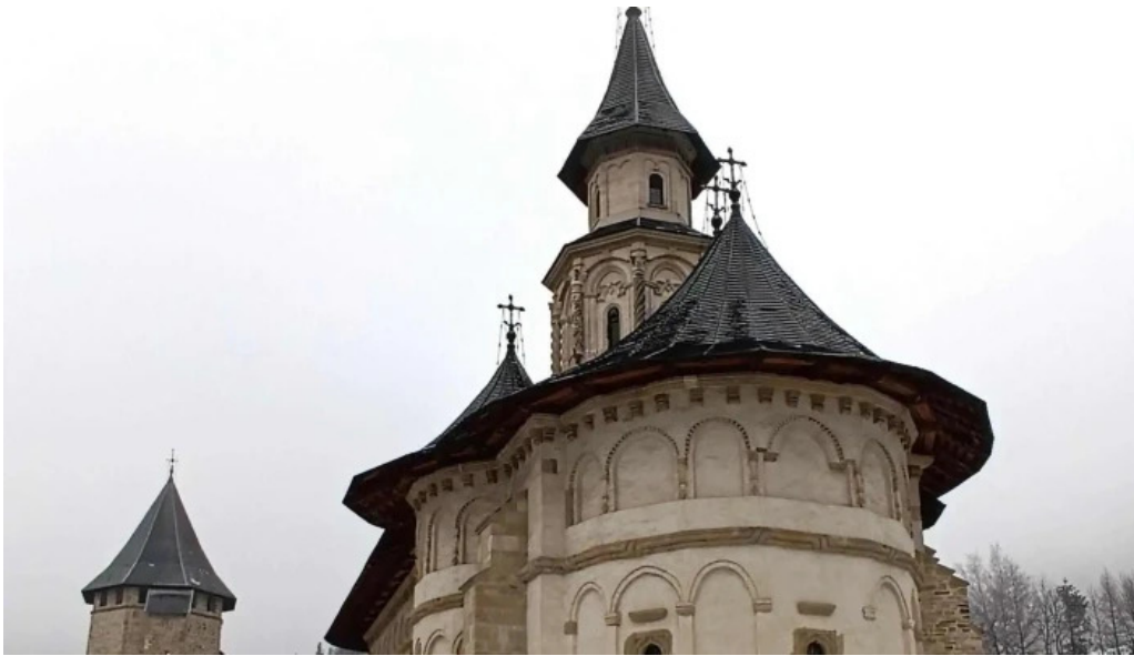
Manastirea sihastria putnei reduceri