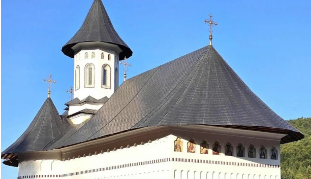
Manastirea sihastria putnei unde