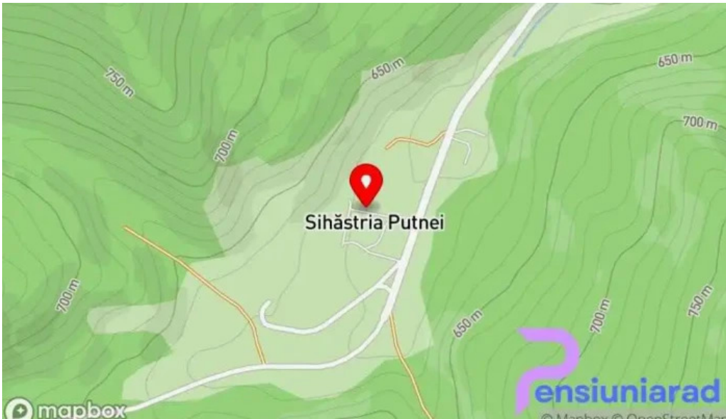
Manastirea sihastria putnei hart?