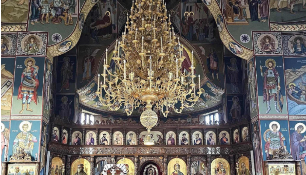
Manastirea sihastria putnei scor