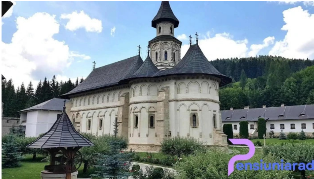
Manastirea putna videoclipuri