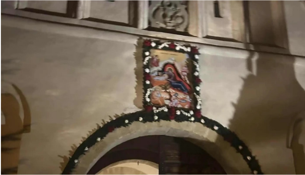
Manastirea putna program