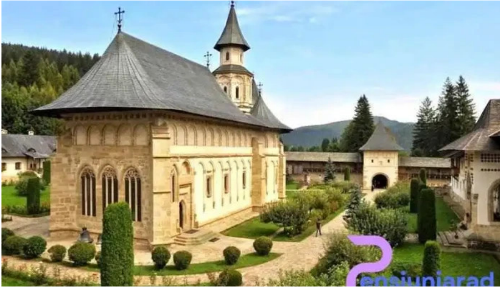
Manastirea putna de la proprietar