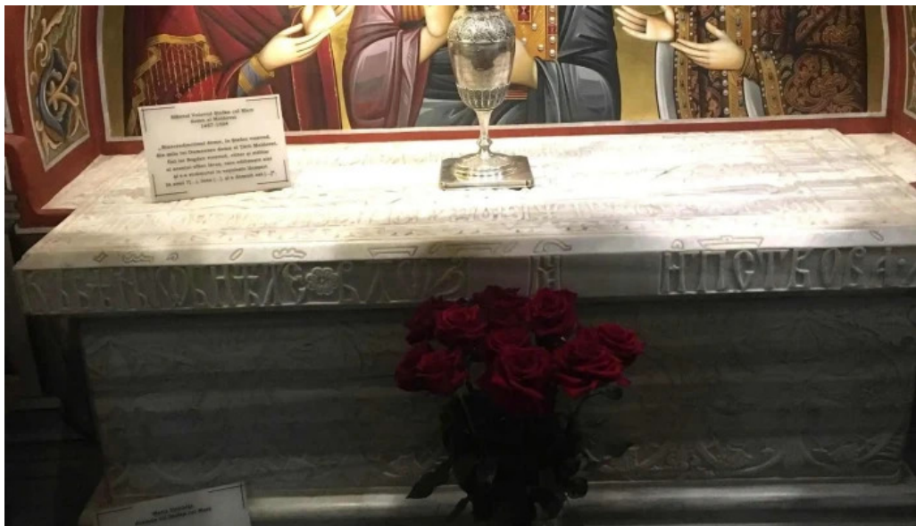
Manastirea putna telefon