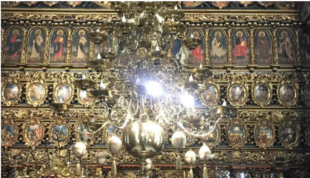
Manastirea putna cum s? ajungi acolo