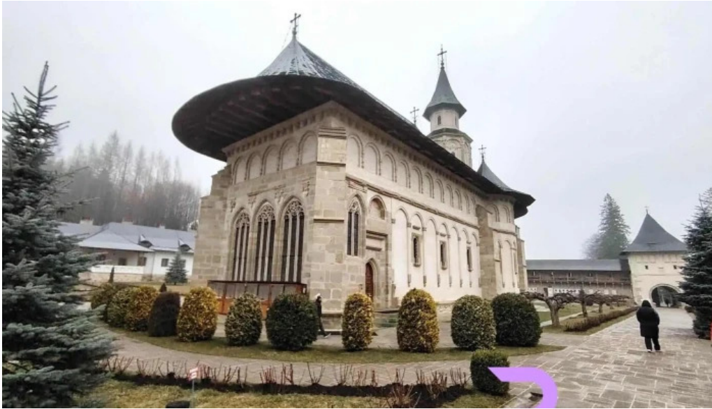
Manastirea putna cele mai recente