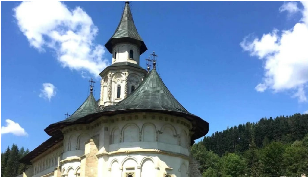
Manastirea putna recenzii