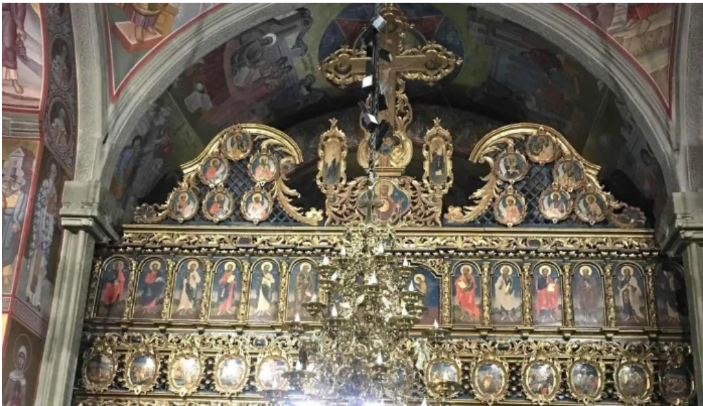
Manastirea putna catalog