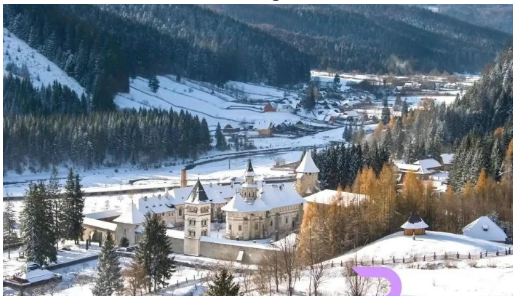
Măștiștea putna putna