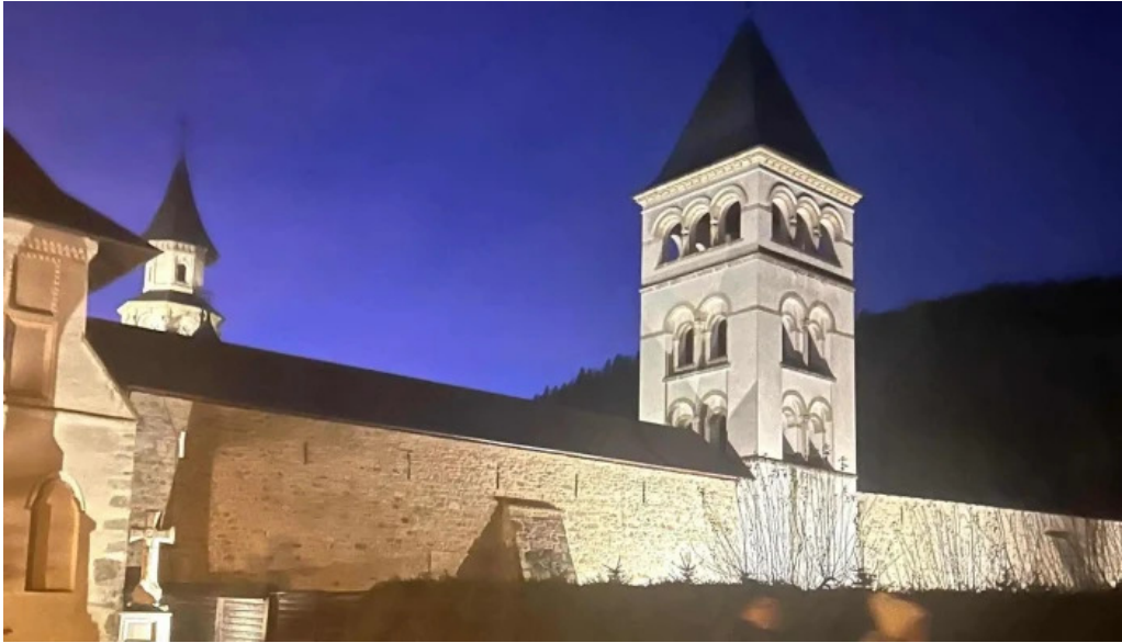
Manastirea putna putna