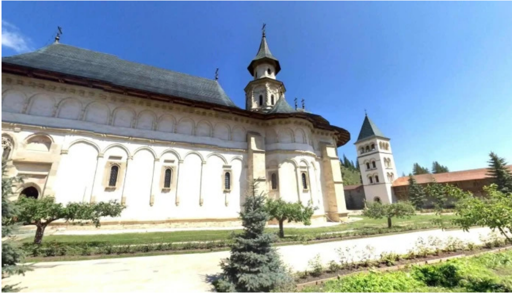
Manastirea putna street view si 360deg