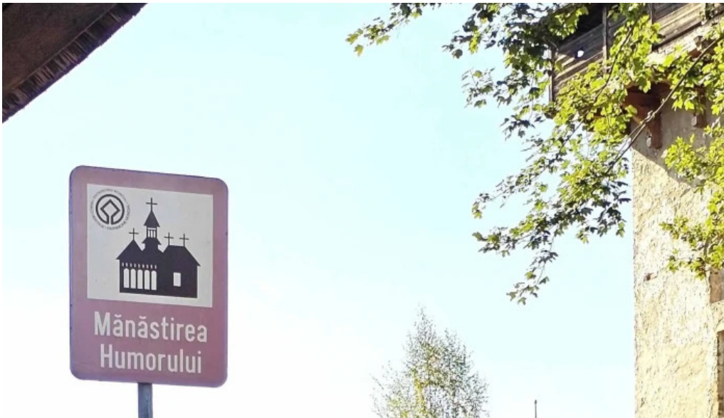
Manastirea humor m?n?stirea humorului