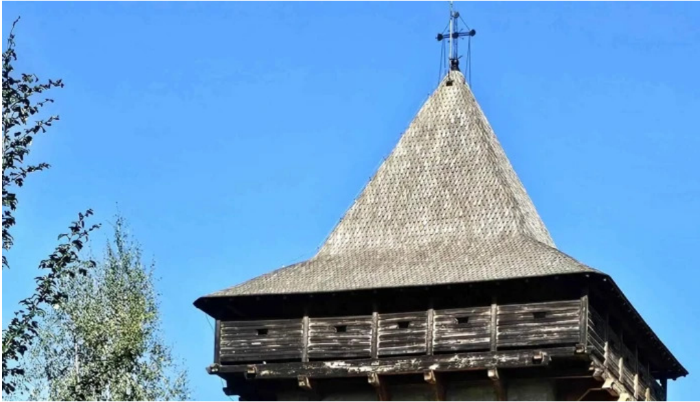
Manastirea humor videoclipuri