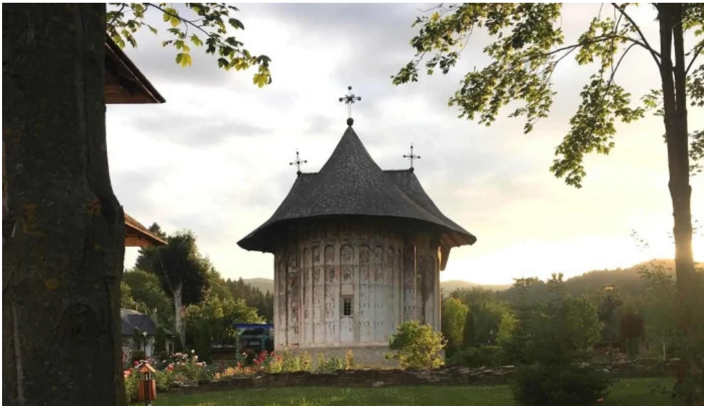
Manastirea humor deschis acum