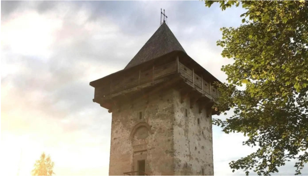
Manastirea humor comentarii