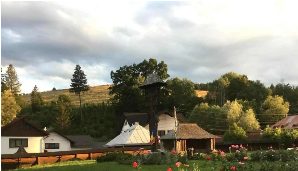
Manastirea humor site web