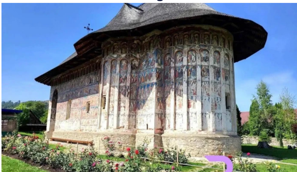
M?n?stirea humor m?n?stirea humorului