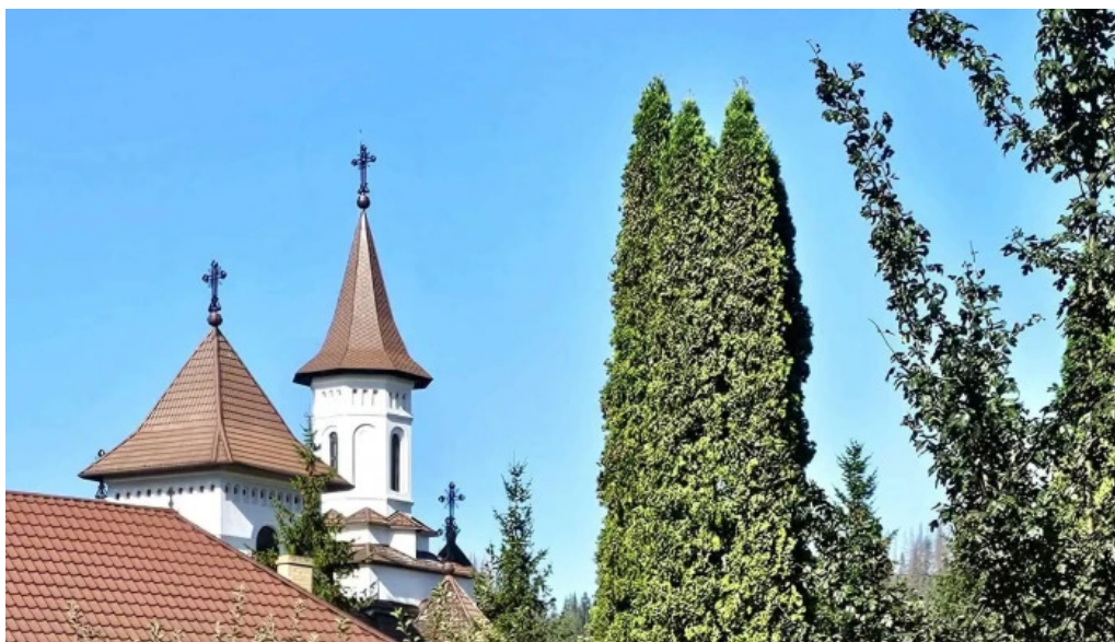
Manastirea humor catalog