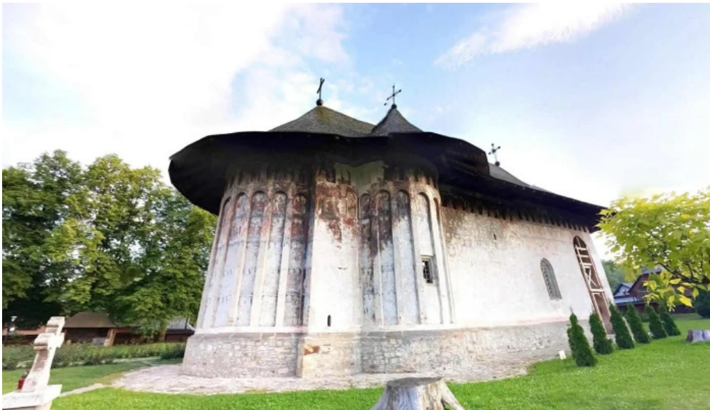
Manastirea humor street view si 360deg