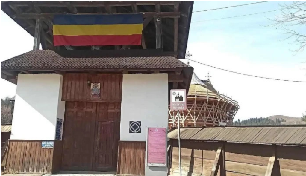
Manastirea humor cele mai recente