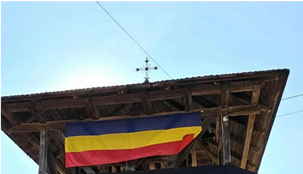
Manastirea humor promo?ie