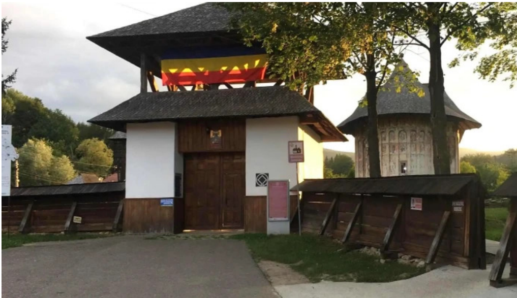
Manastirea humor instagram