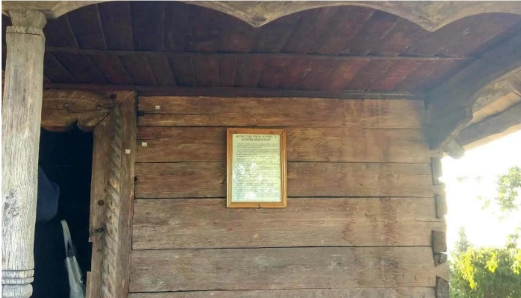
Manastirea gorganu catalog