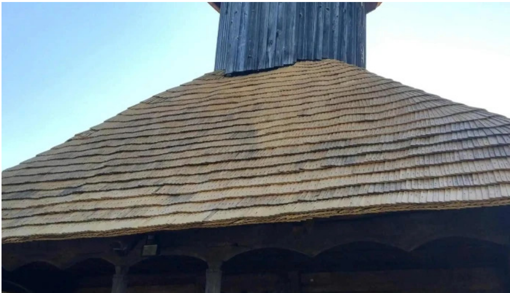
Manastirea gorganu adres?