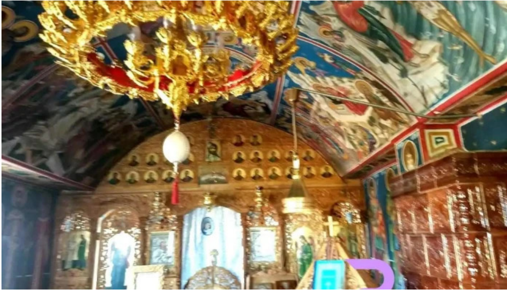
Manastirea gorganu gorganu