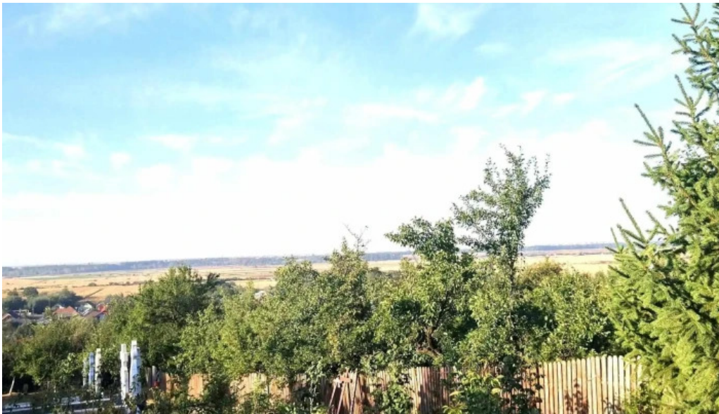
Manastirea gorganu reduceri