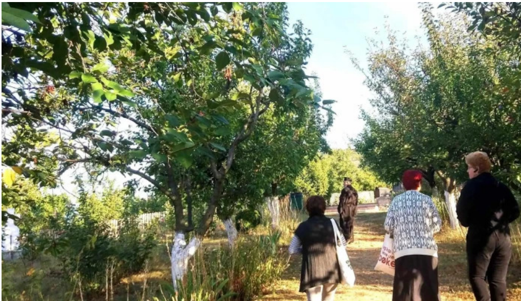
Manastirea gorganu gorganu