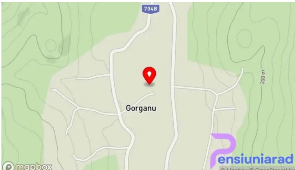
Manastirea gorganu hart?