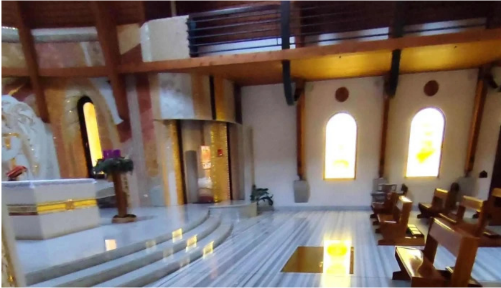
Manastirea parintilor carmelitani desculti promo?ie