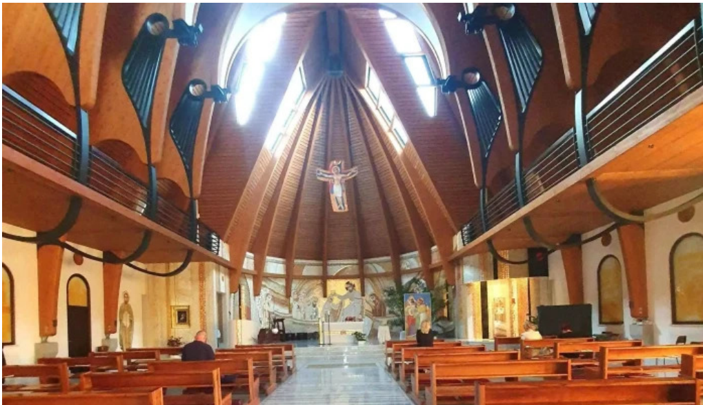
Manastirea parintilor carmelitani desculti pre?uri