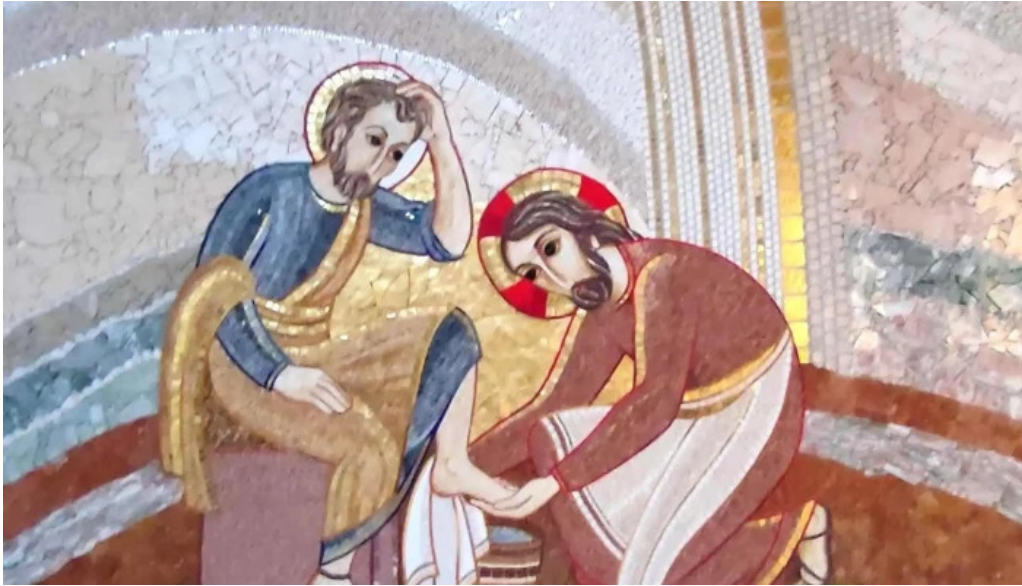
Manastirea parintilor carmelitani desculți catalog