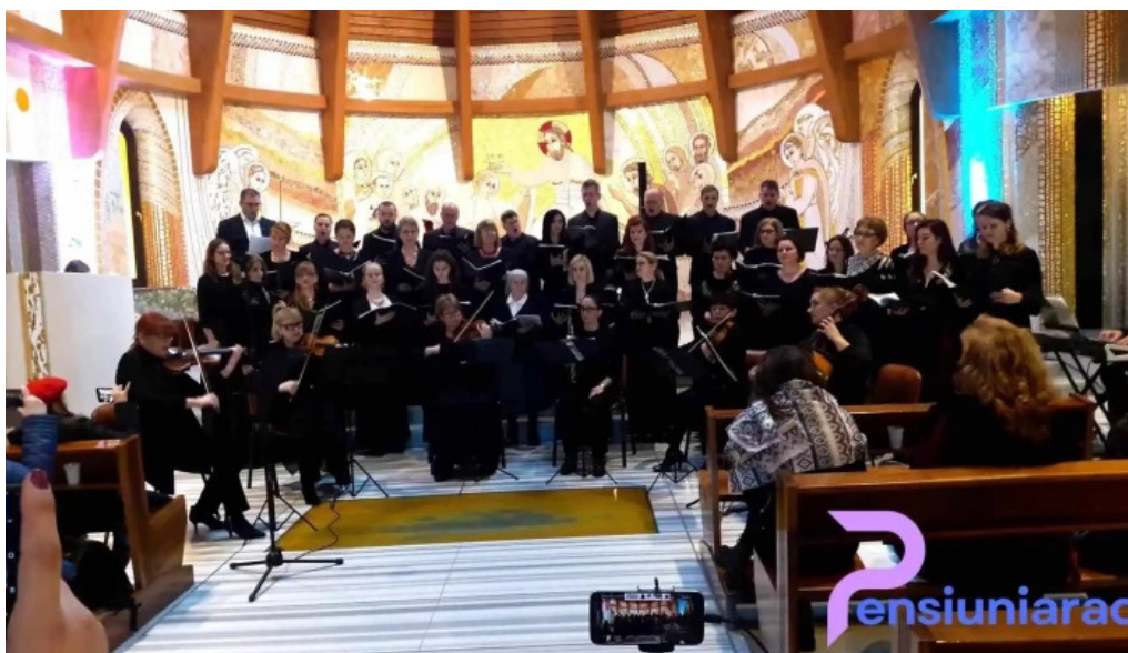
Manastirea parintilor carmelitani desculti videoclipuri