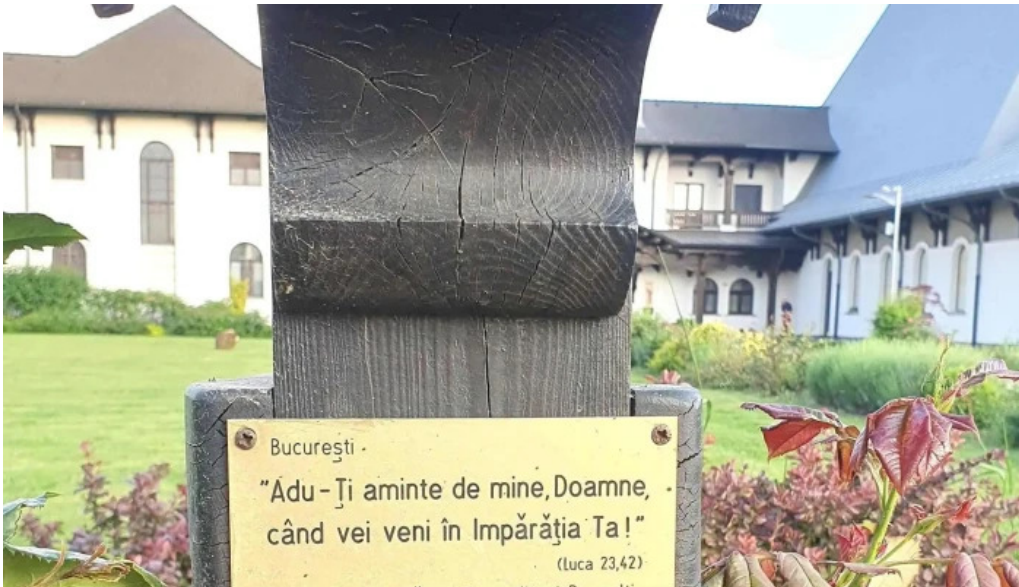
Manastirea parintilor carmelitani desculti ciofliceni