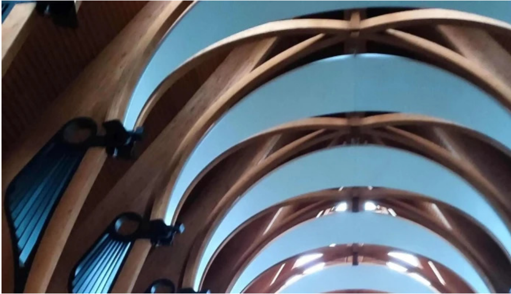
Manastirea parintilor carmelitani desculti comentarii