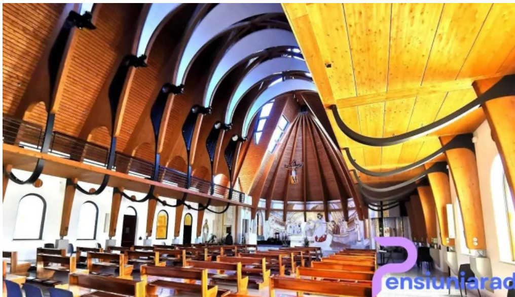
M?n?stirea p?rin?ilor carmelitani descul?i ciofliceni