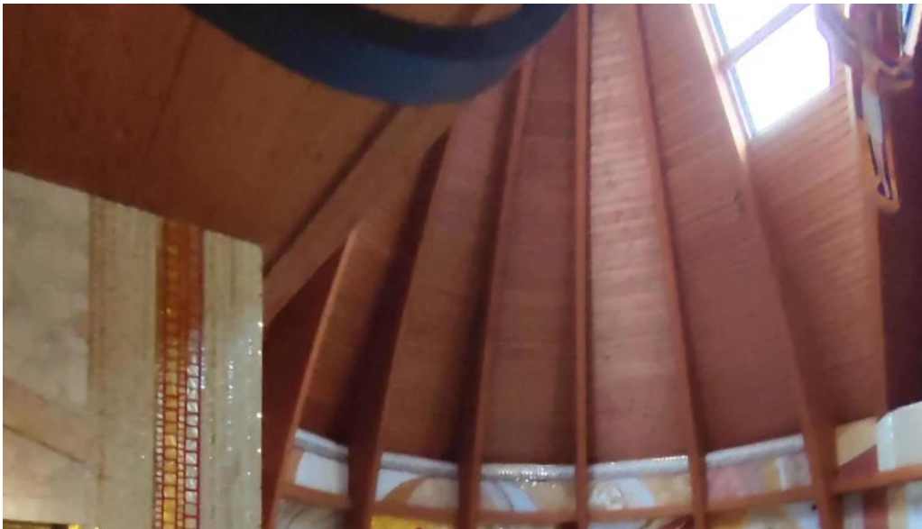
Manastirea parintilor carmelitani desculți aproape de mine