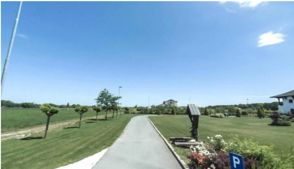
Manastirea parintilor carmelitani desculti street view si 360deg