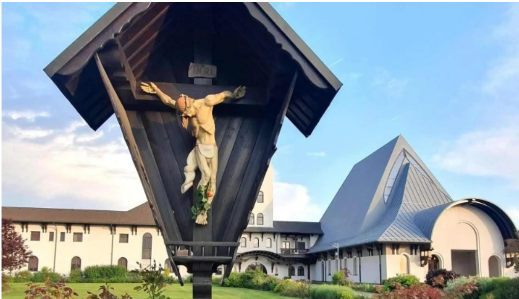
Manastirea parintilor carmelitani desculti unde