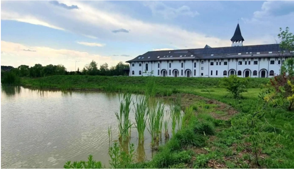
Manastirea parintilor carmelitani desculti loca?ie