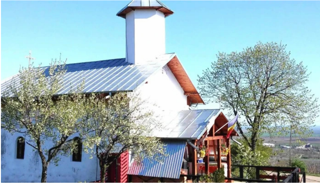
Manastirea ceptura loca?ie