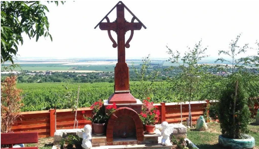
Manastirea ceptura instagram