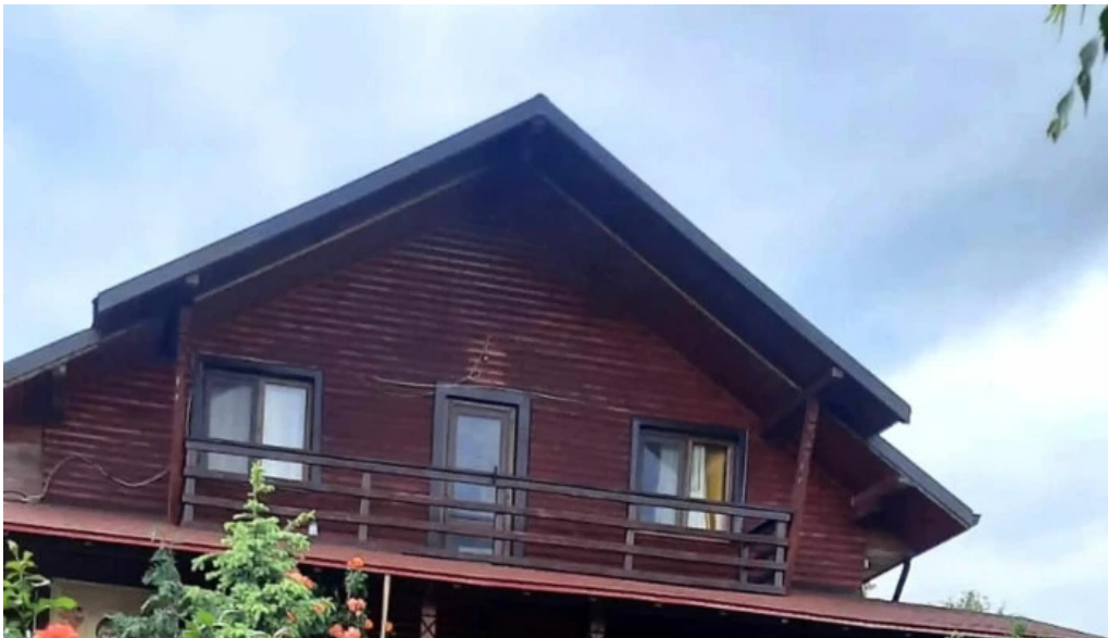
Manastirea ceptura ceptura de jos