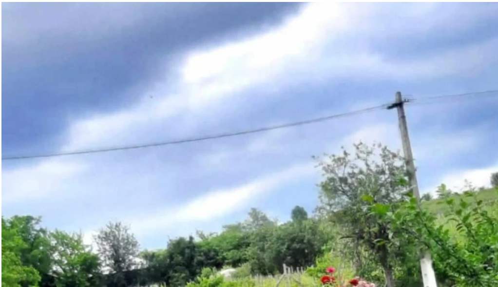
Manastirea ceptura num?r