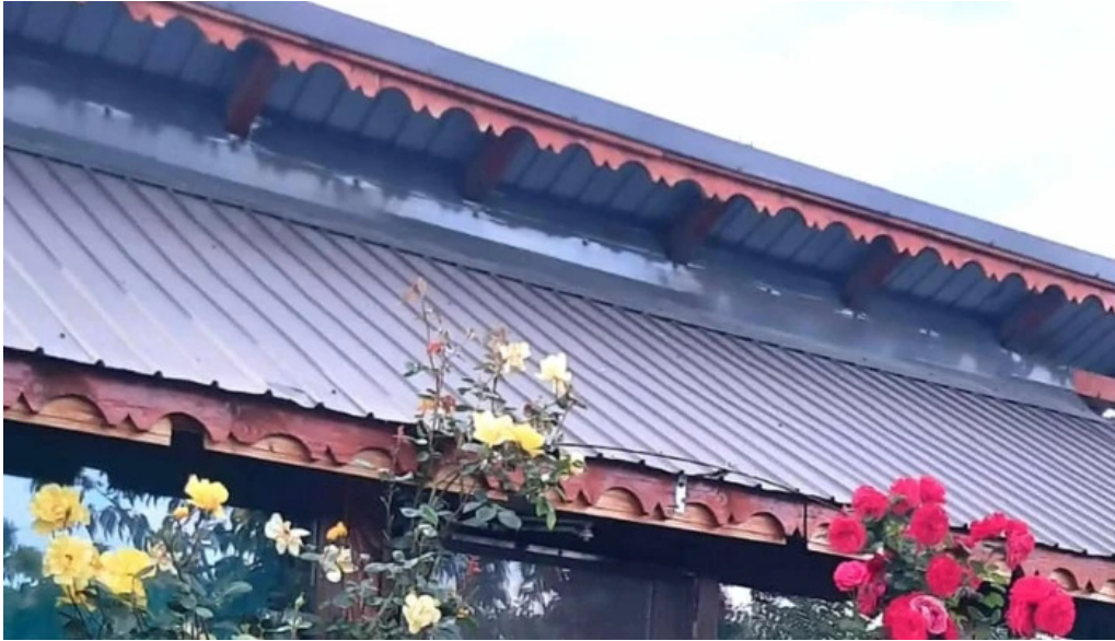
Manastirea ceptura cum s? ajungi acolo