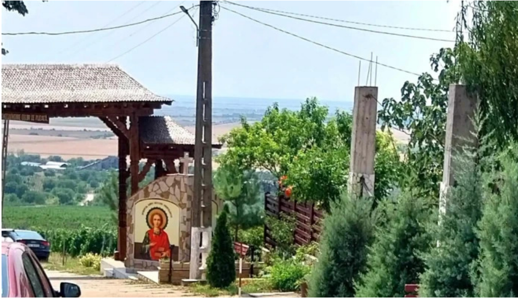
Manastirea ceptura telefon