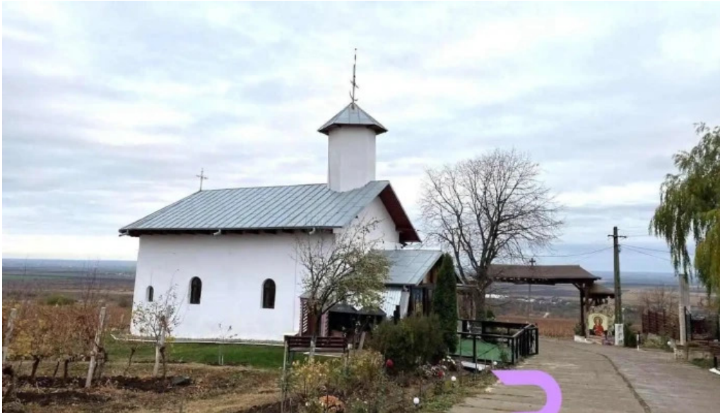
M?n?stirea ceptura ceptura de jos