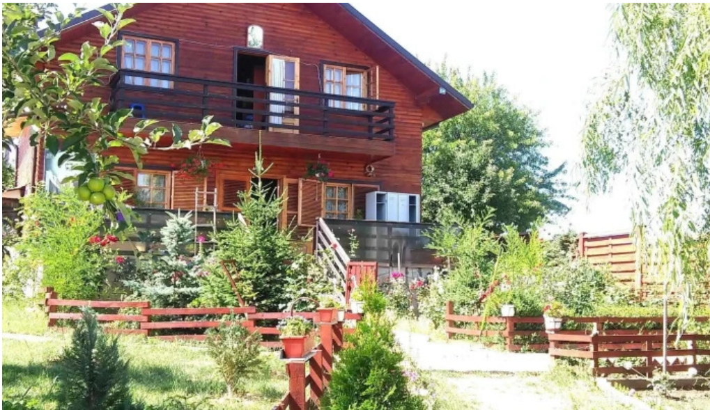
Manastirea ceptura reduceri