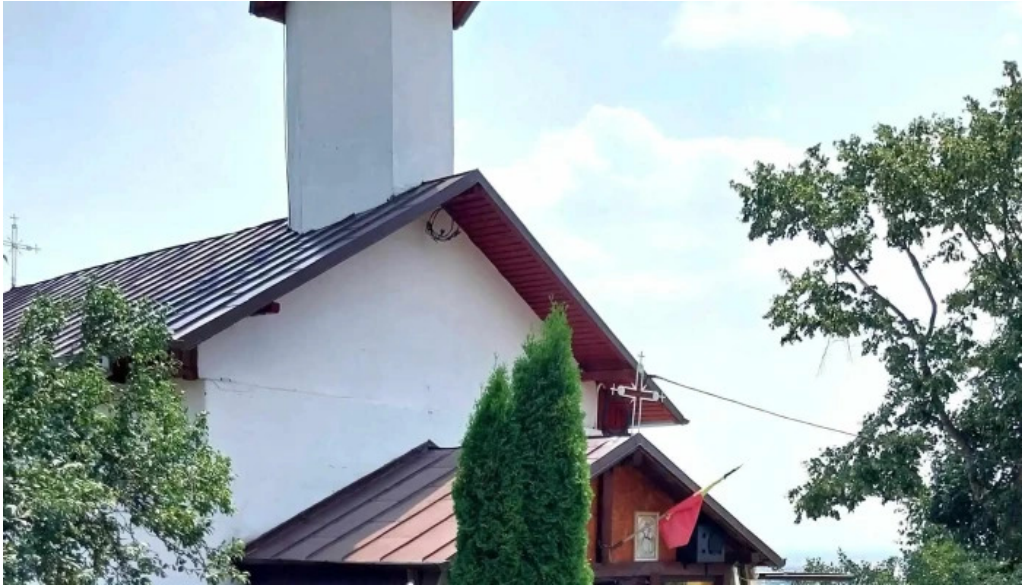
Manastirea ceptura recenzii