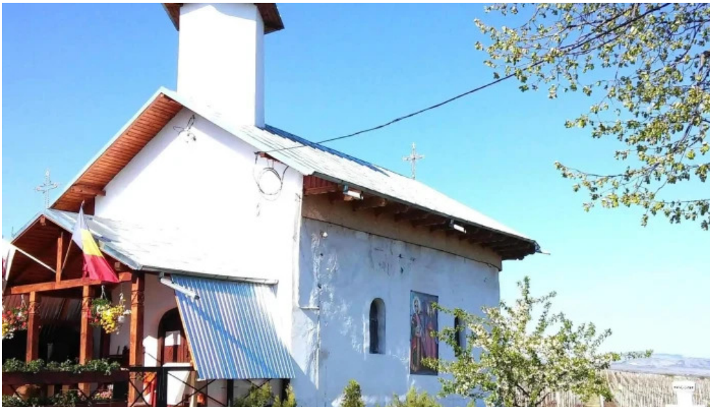
Manastirea ceptura videoclipuri