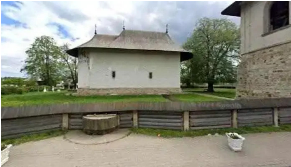
Manastirea arbore street view si 360deg