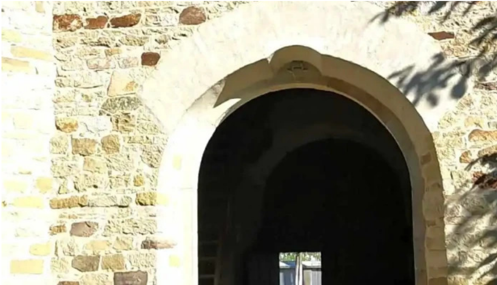
Manastirea arbore videoclipuri