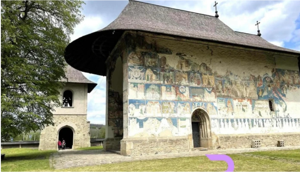
Manastirea arbore telefon