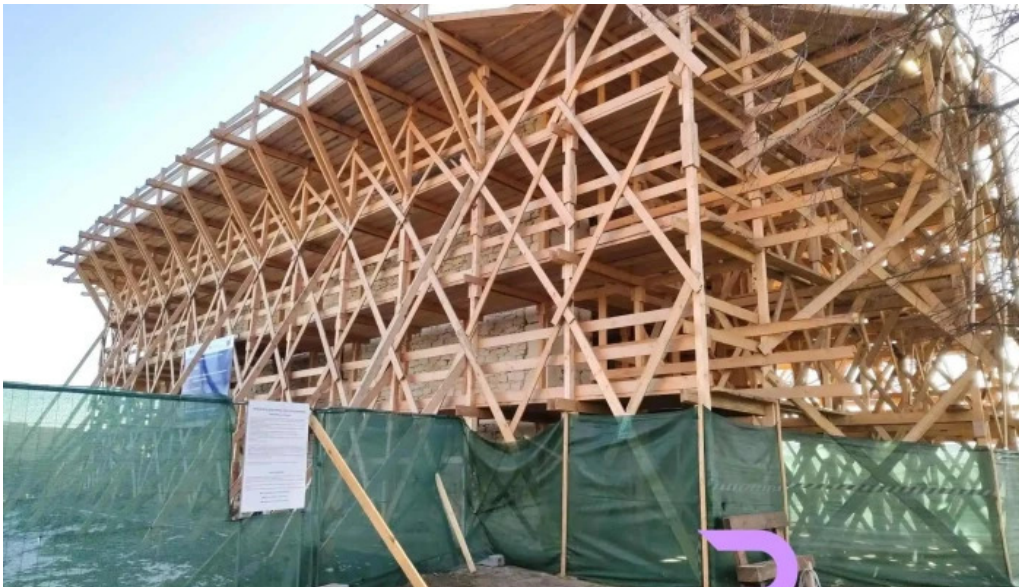
Manastirea arbore cele mai recente