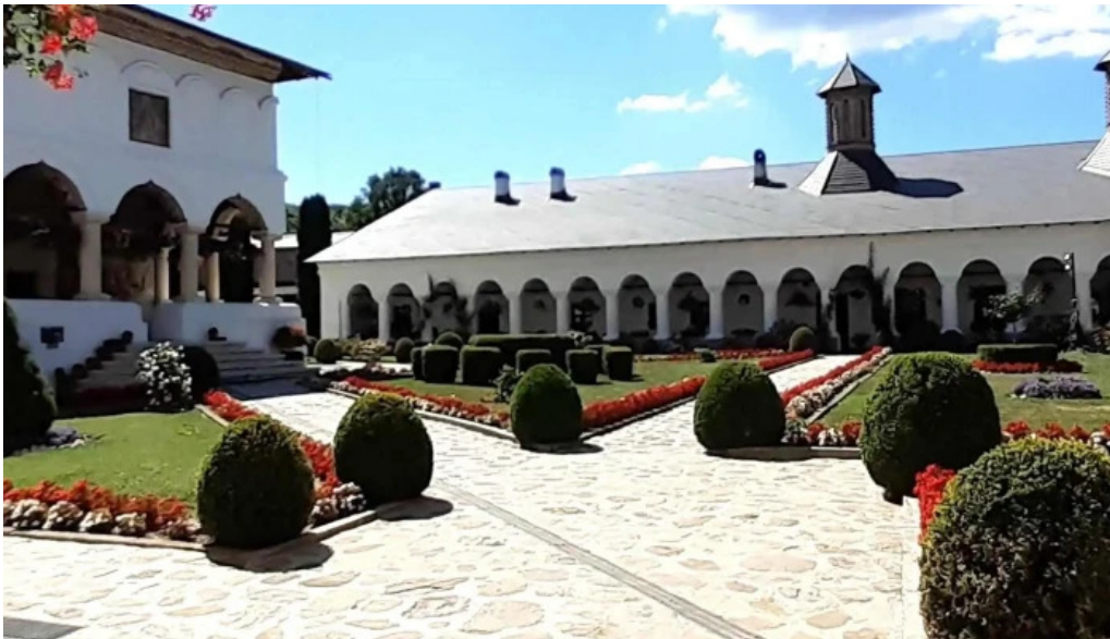
Manastirea aninoasa cum s? ajungi acolo