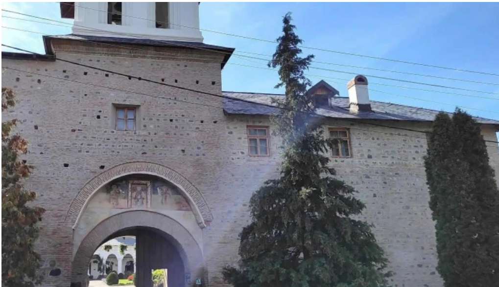
Manastirea aninoasa aproape de mine