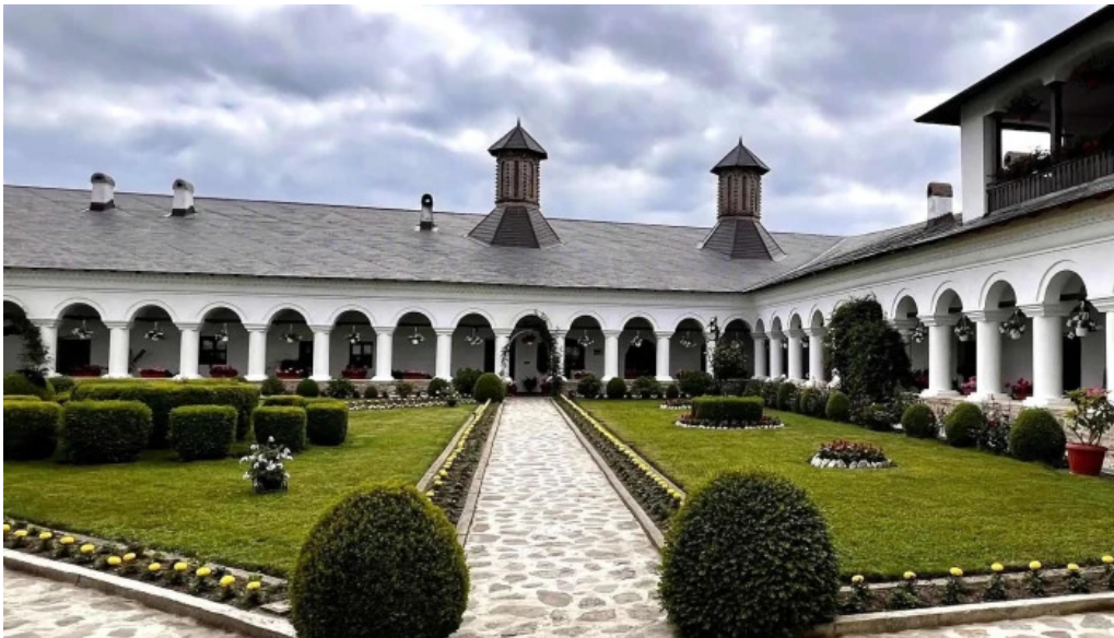
Manastirea aninoasa zon?