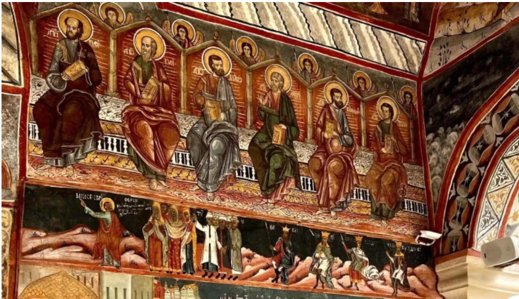
Manastirea aninoasa num?r