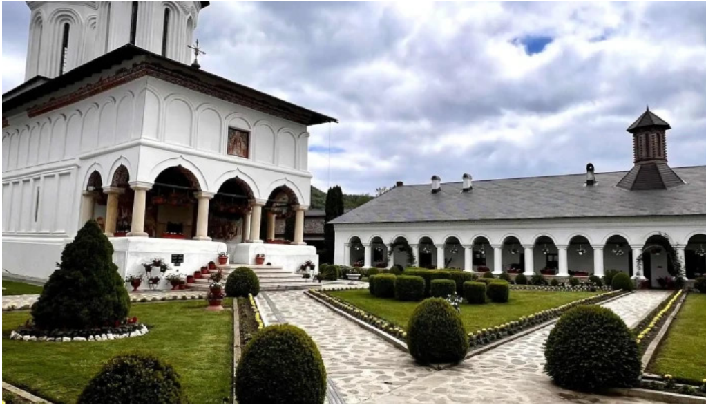
Manastirea aninoasa pre?uri