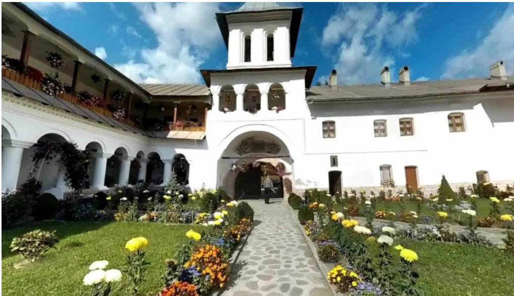
Manastirea aninoasa street view si 360deg