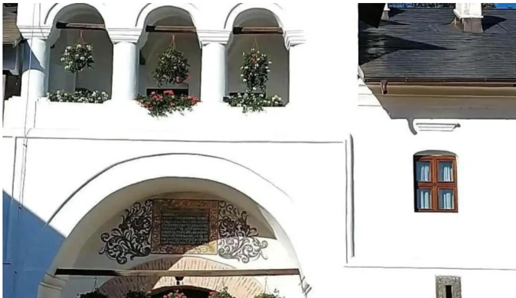
Manastirea aninoasa videoclipuri