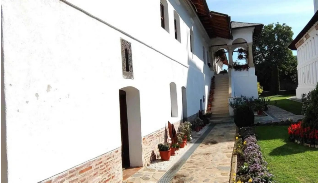
Manastirea aninoasa telefon