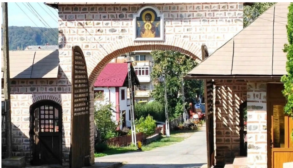
Manastirea aninoasa aninoasa