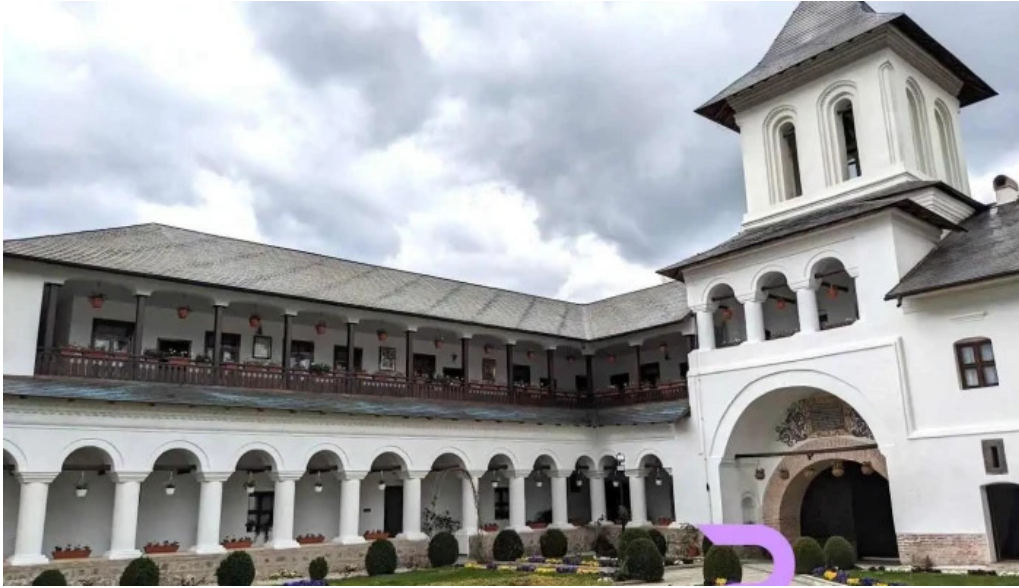
M?n?stirea aninoasa aninoasa