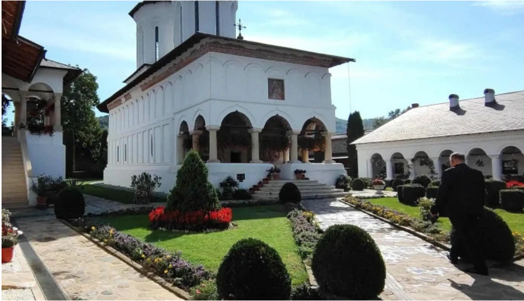
Manastirea aninoasa comentarii