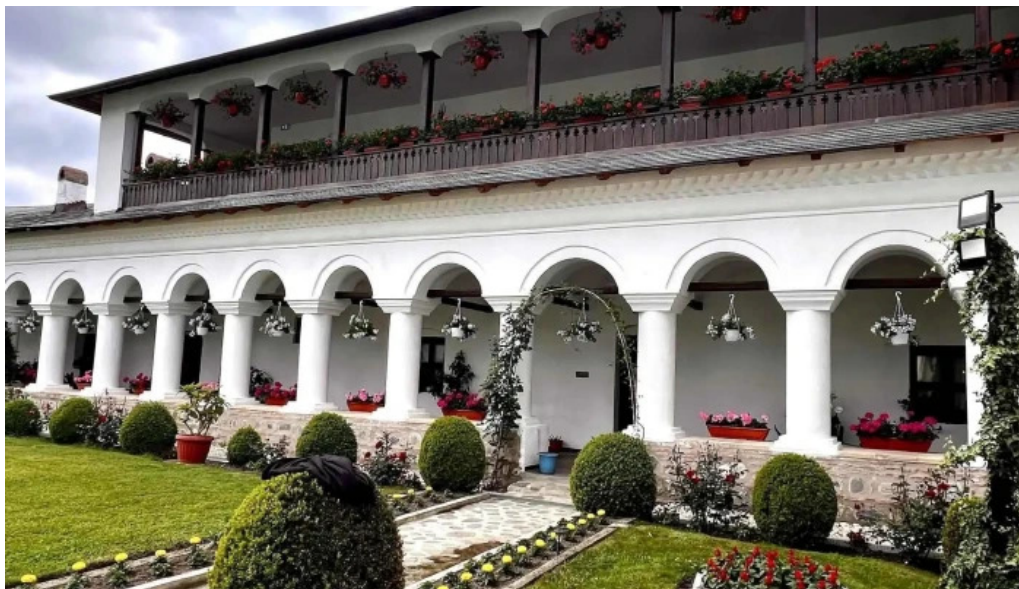
Manastirea aninoasa unde