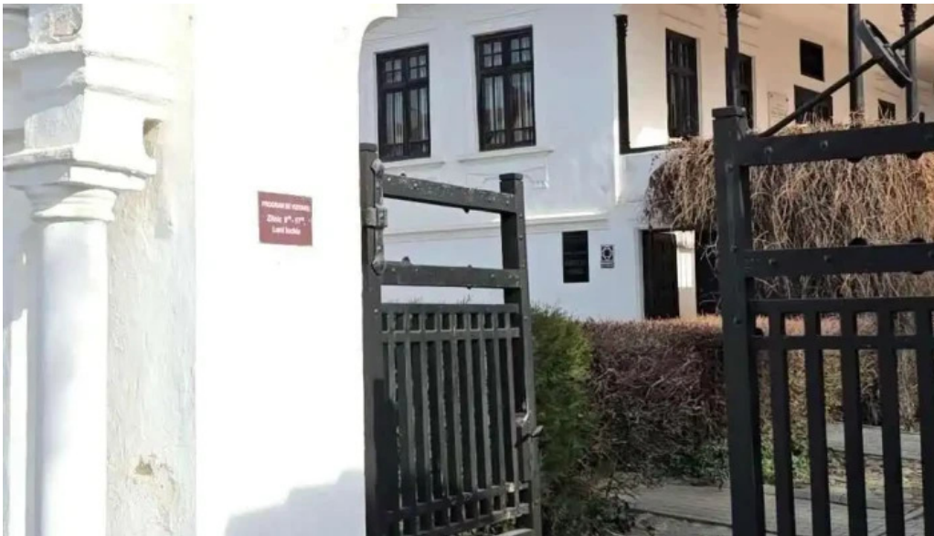
Muzeul memorial nicolae iorga videoclipuri