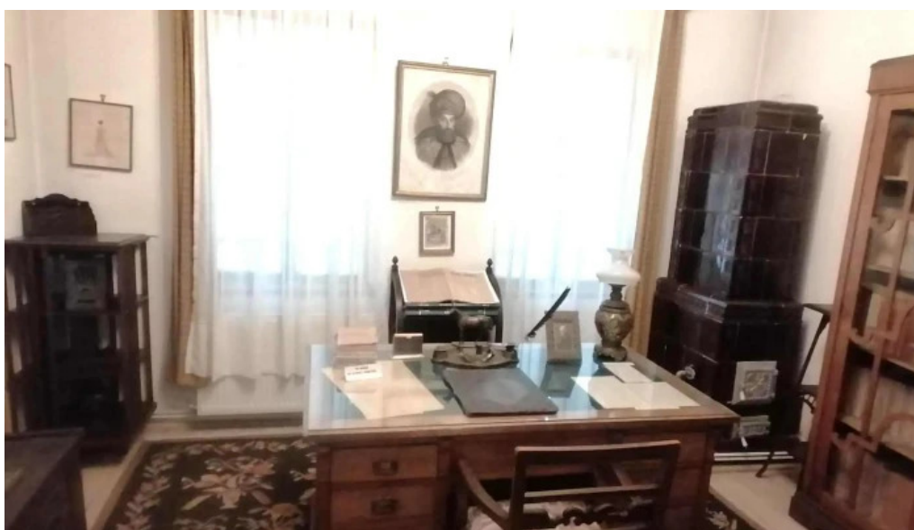
Muzeul memorial nicolae iorga aproape de mine