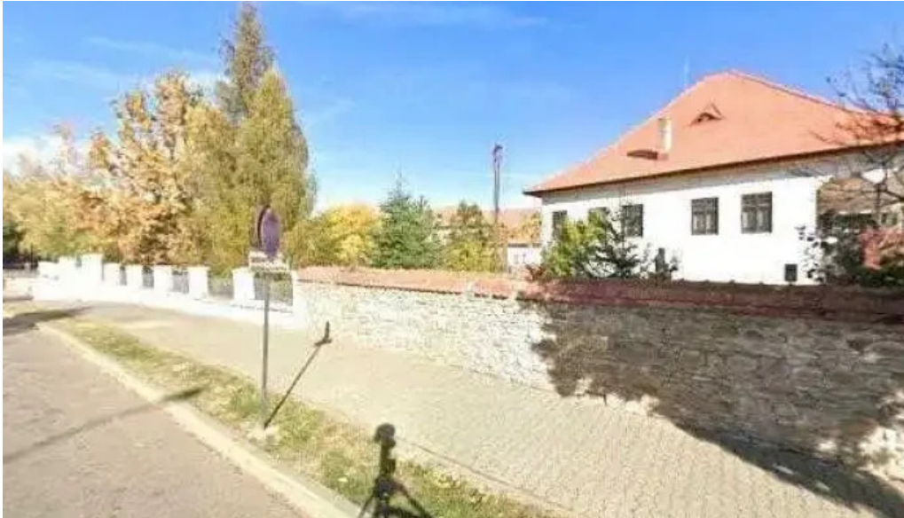
Muzeul memorial nicolae iorga street view si 360deg