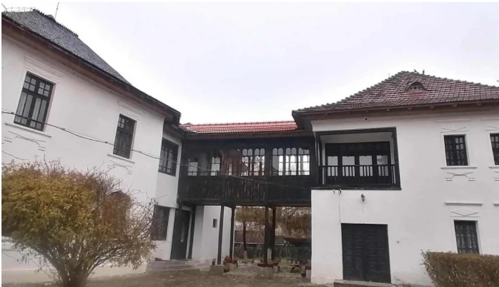
Muzeul memorial nicolae iorga site web