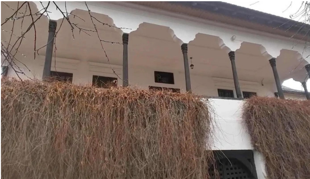
Muzeul memorial nicolae iorga num?r