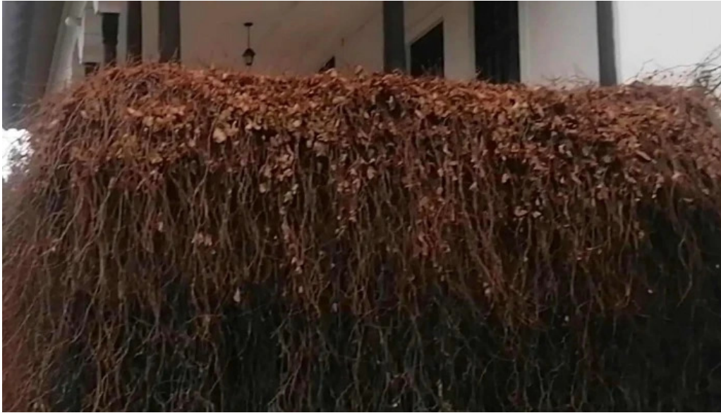
Muzeul memorial nicolae iorga v?lenii de munte