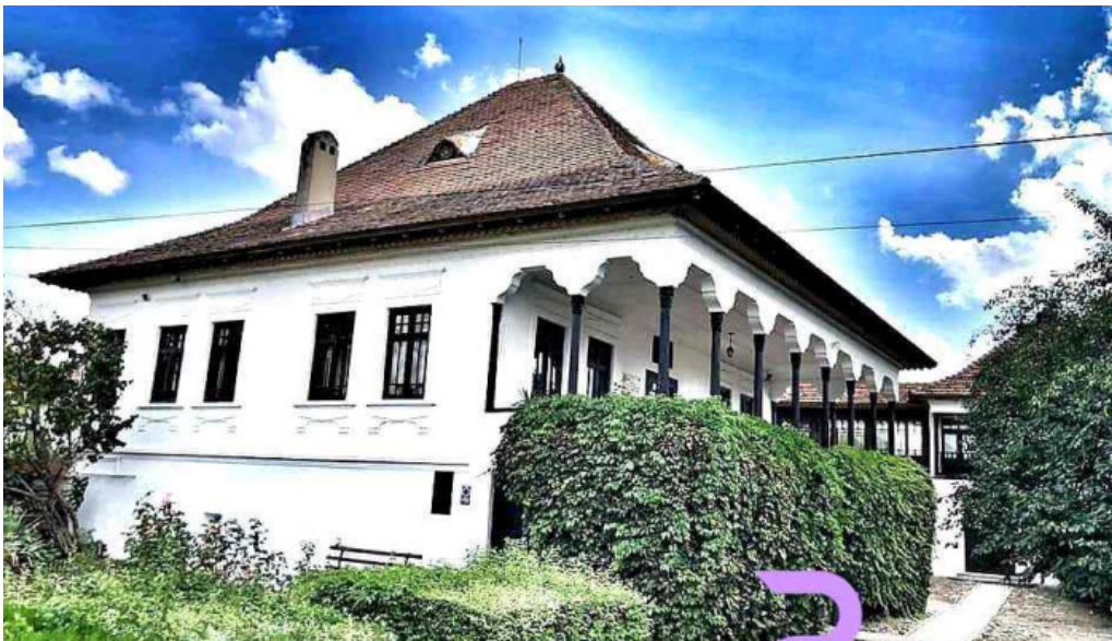
Muzeul memorial „nicolae iorga v?lenii de munte