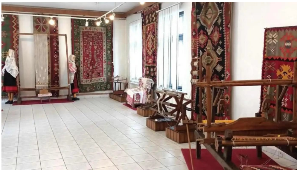
Muzeul memorial nicolae iorga cele mai recente