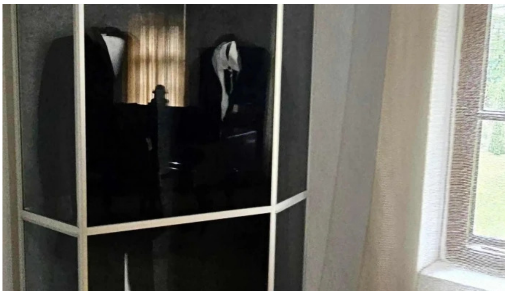
Muzeul ciprian porumbescu ciprian porumbescu