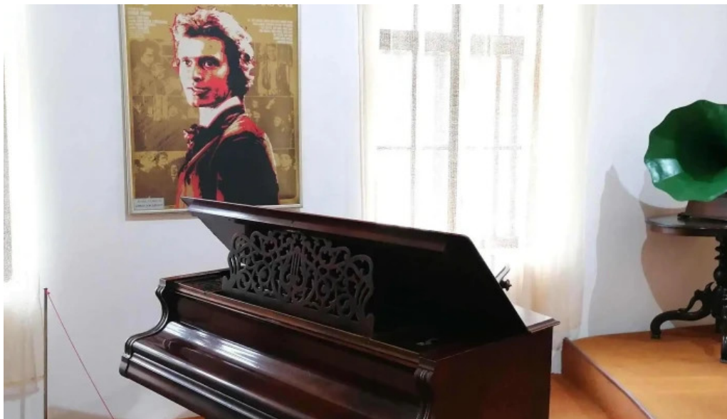
Muzeul ciprian porumbescu pre?uri