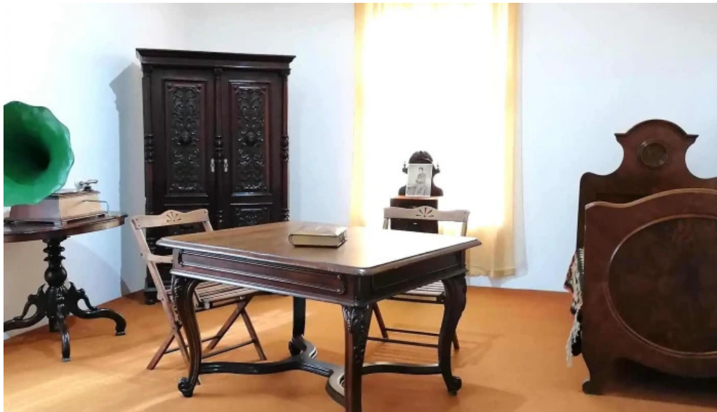
Muzeul ciprian porumbescu program