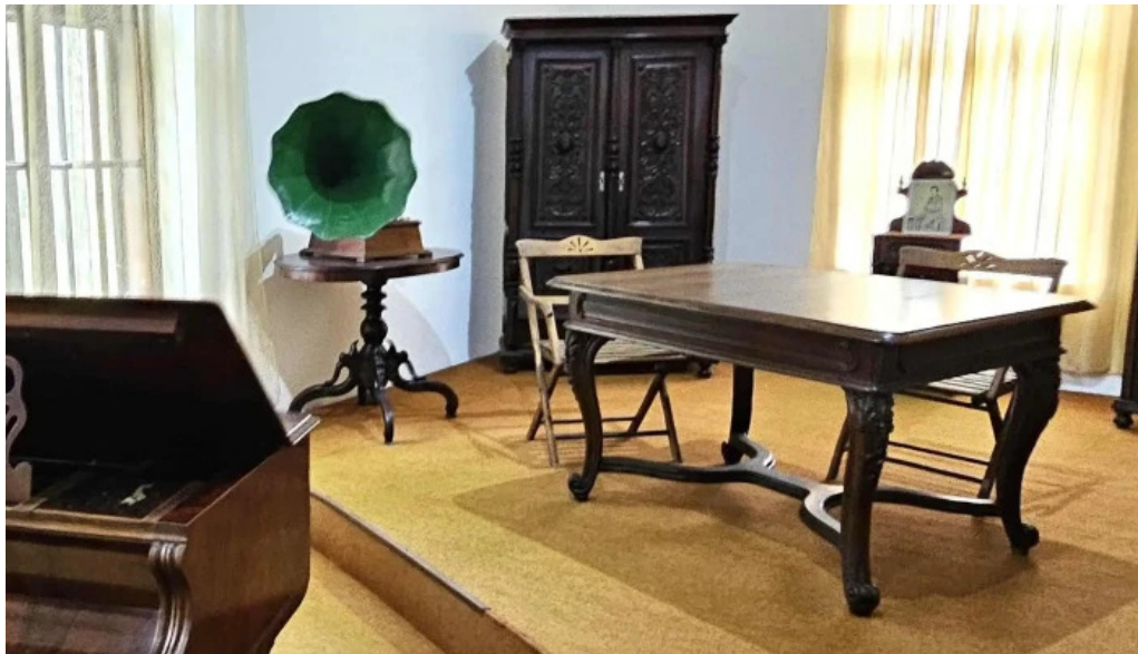
Muzeul ciprian porumbescu loca?ie