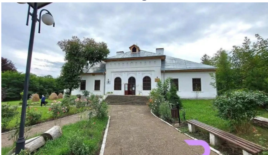
Muzeul „ciprian porumbescu ciprian porumbescu