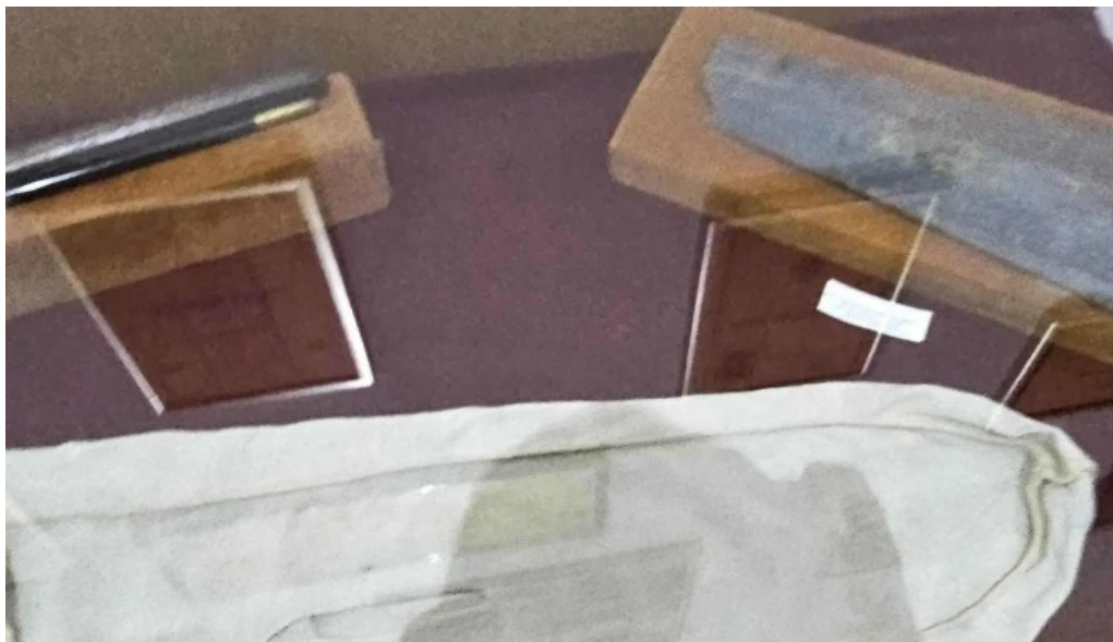
Muzeul ciprian porumbescu instagram