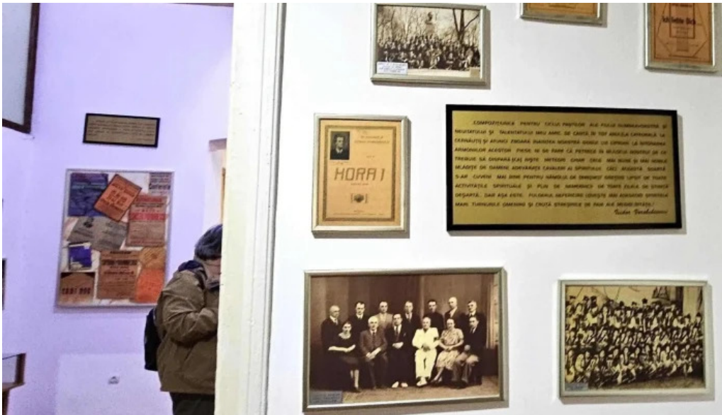
Muzeul ciprian porumbescu reduceri