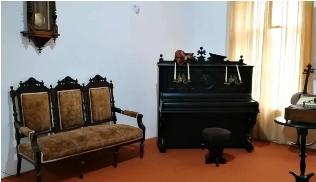
Muzeul ciprian porumbescu zon?