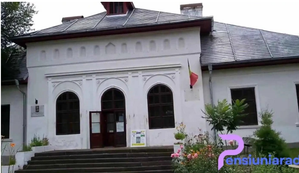
Muzeul ciprian porumbescu videoclipuri