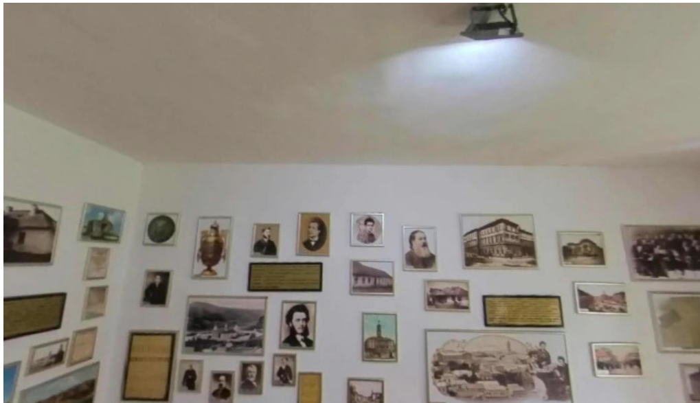
Muzeul ciprian porumbescu street view si 360deg