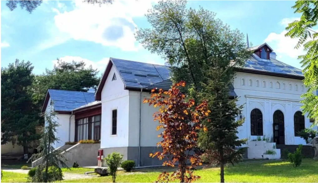
Muzeul ciprian porumbescu scor