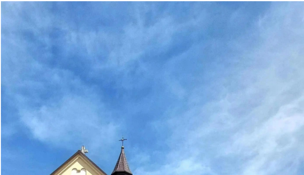
Casa memoriala ciprian porumbescu reduceri