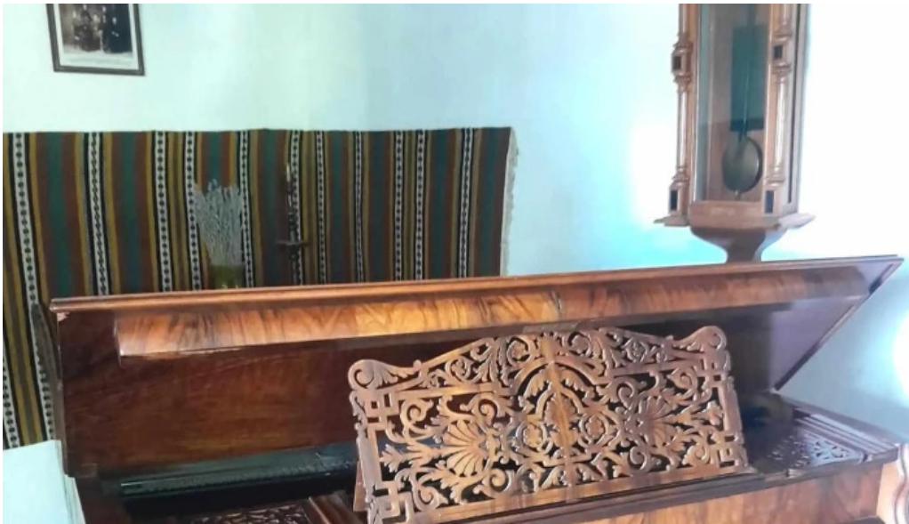
Casa memoriala ciprian porumbescu num?r