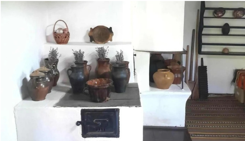
Casa memoriala ciprian porumbescu instagram