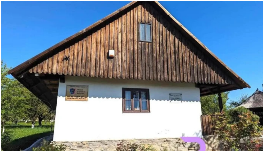
Casa memorială „Ciprian Porumbescu Ciprian Porumbescu”