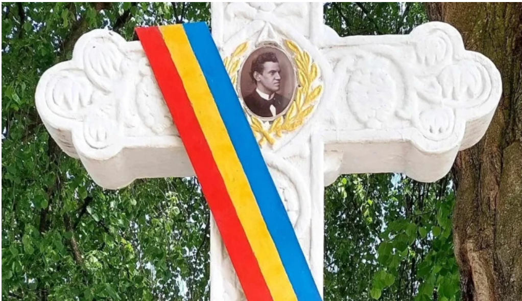
Casa memoriala ciprian porumbescu ciprian porumbescu