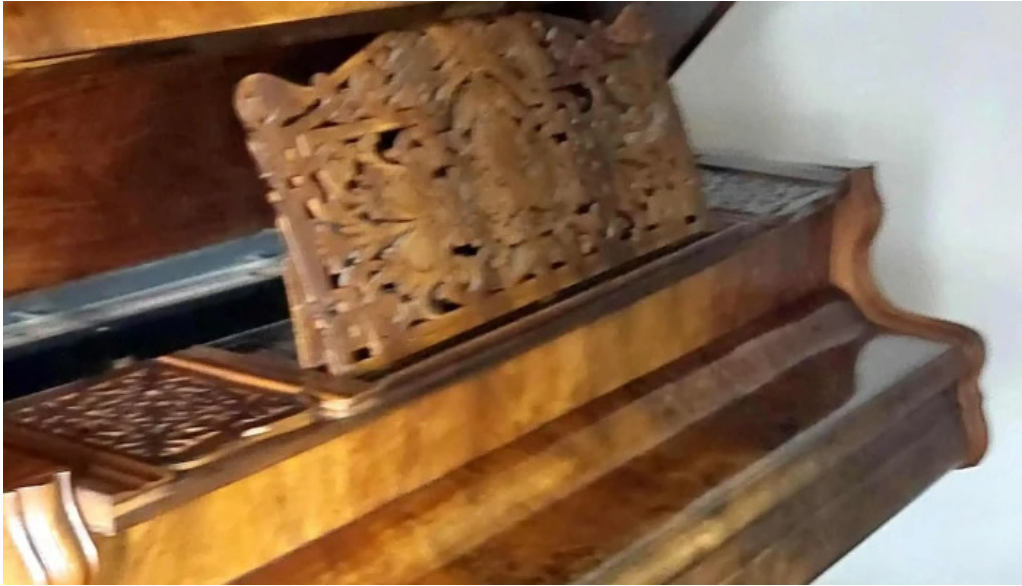
Casa memoriala ciprian porumbescu recenzii