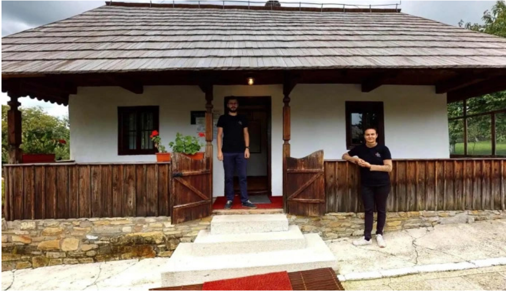
Casa memoriala ciprian porumbescu street view si 360deg