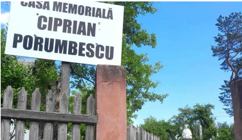
Casa memoriala ciprian porumbescu videoclipuri