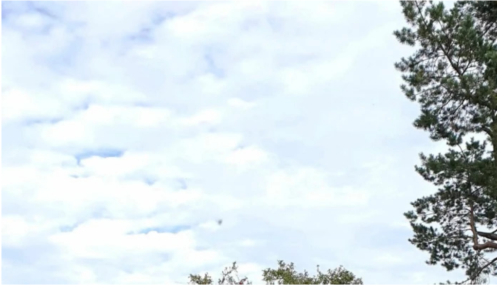
Casa memoriala ciprian porumbescu deschis acum