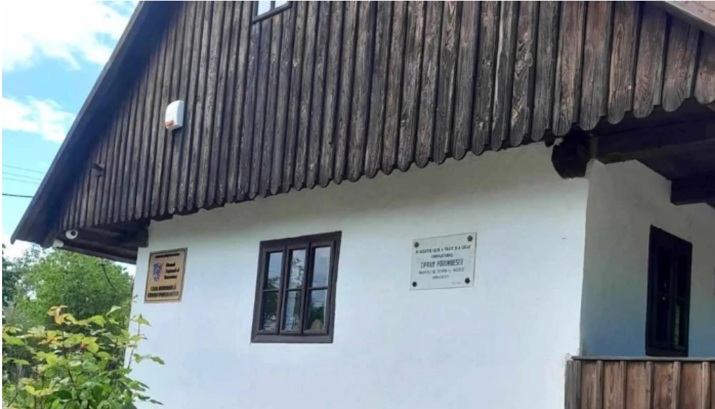
Casa memoriala ciprian porumbescu zon?