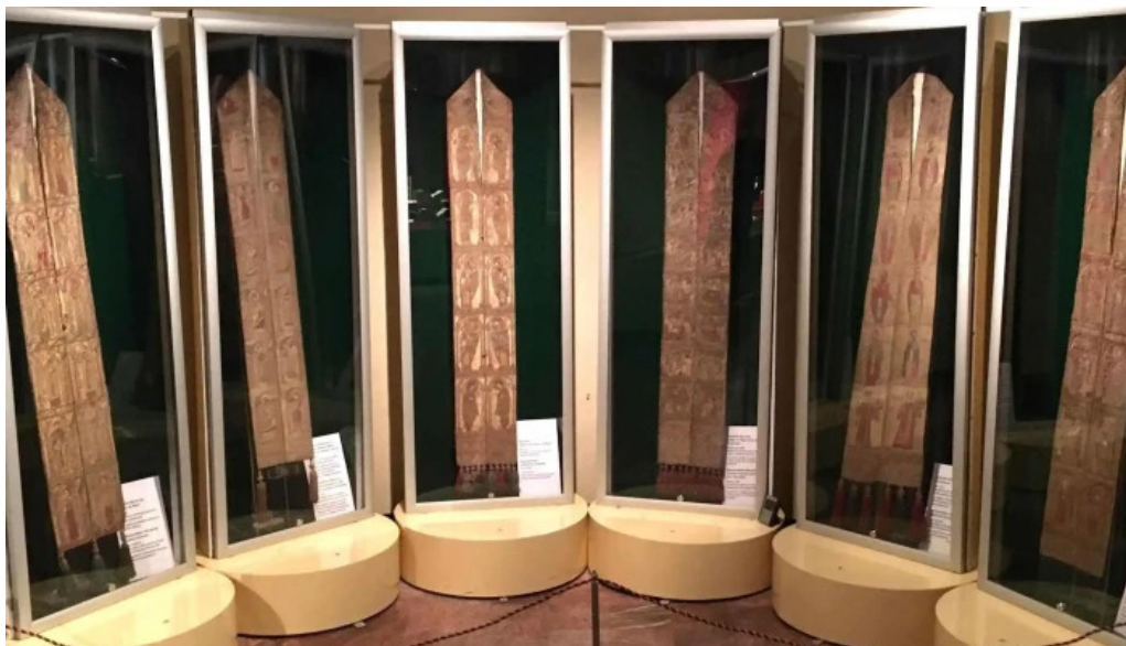
Muzeul manastirii putna fotografii