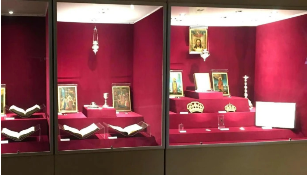
Muzeul manastirii putna putna