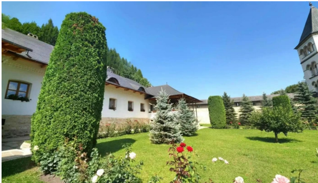
Muzeul manastirii putna street view si 360deg