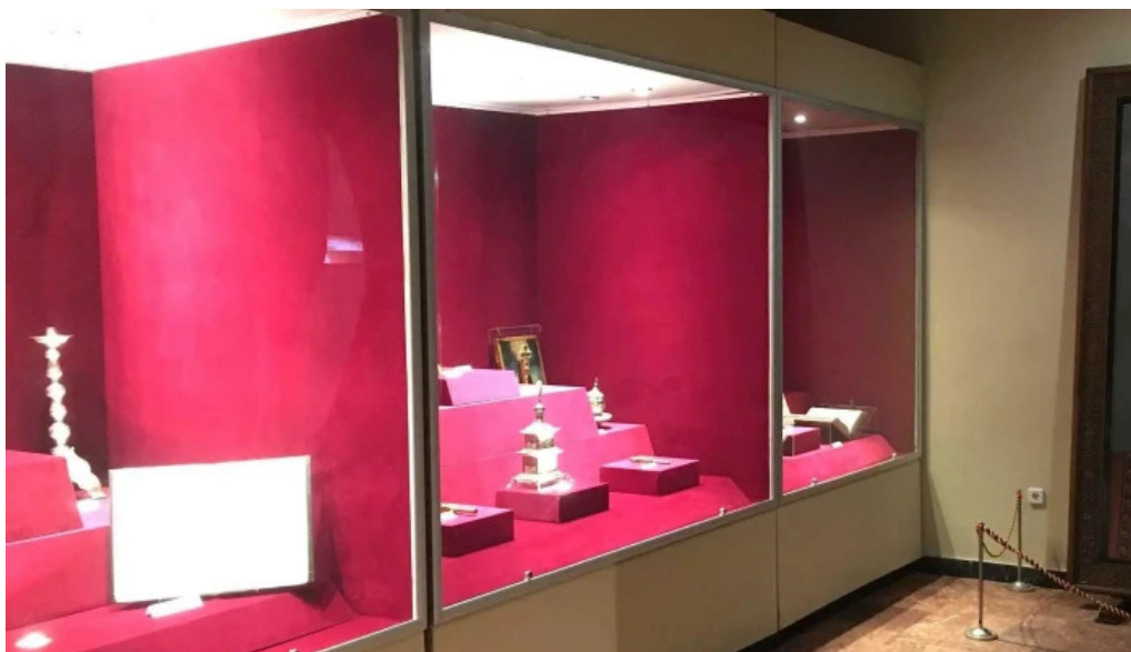
Muzeul manastirii putna deschis acum