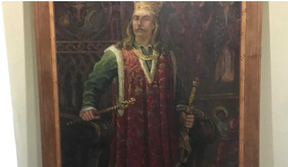
Muzeul manastirii putna videoclipuri