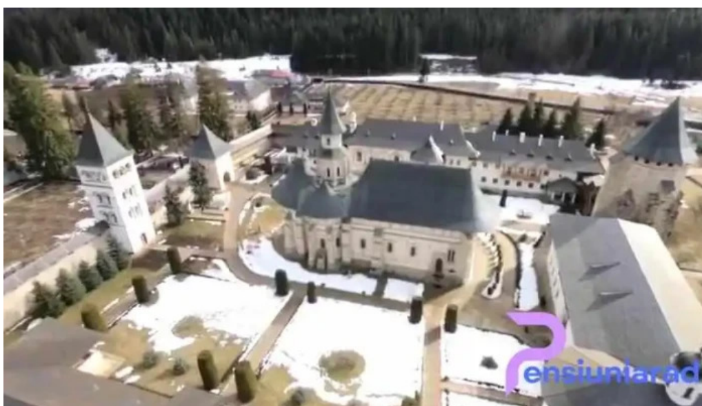
Muzeul manastirii putna de la proprietar