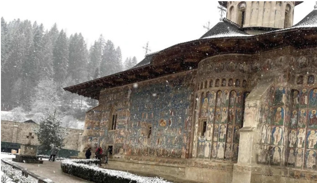
Muzeul manastirii putna num?r