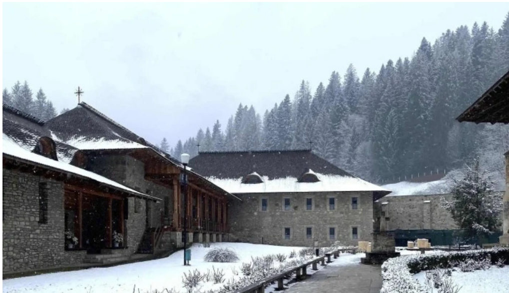
Muzeul manastirii putna aproape de mine