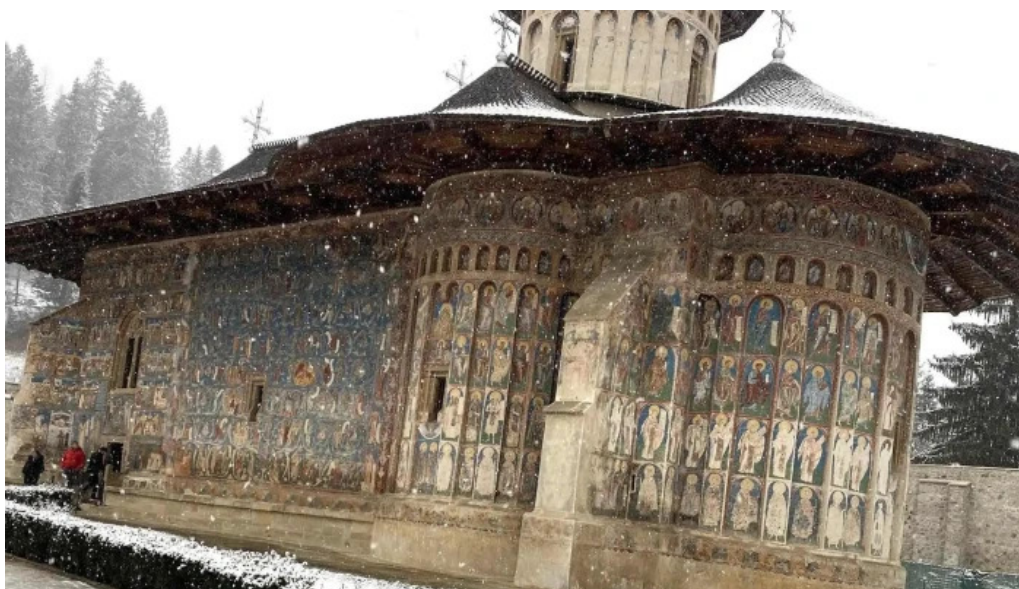
Muzeul manastirii putna adres?