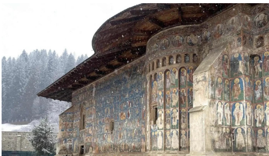
Muzeul manastirii putna zon?