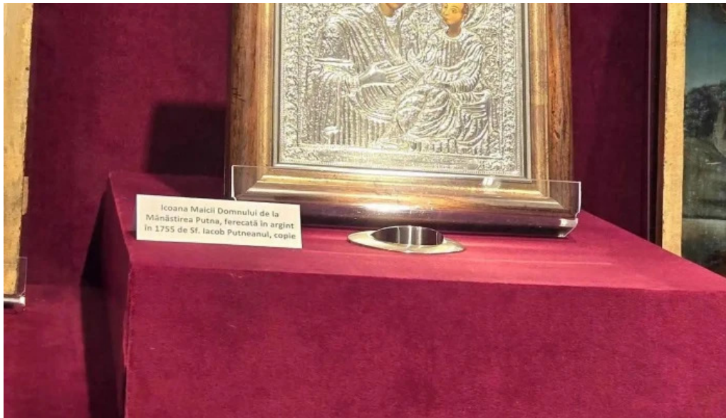
Muzeul manastirii putna cele mai recente