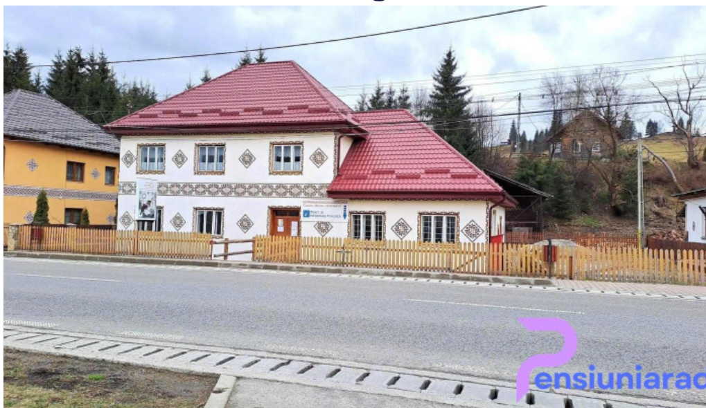
Muzeul satului ciocănești ciocănești