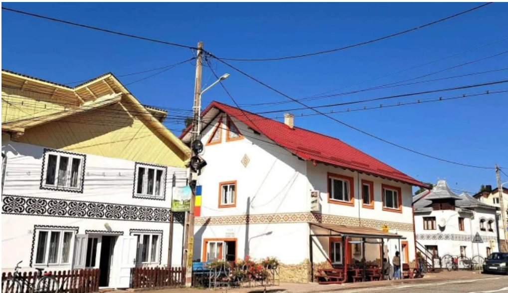
Muzeul satului ciocanesti scor