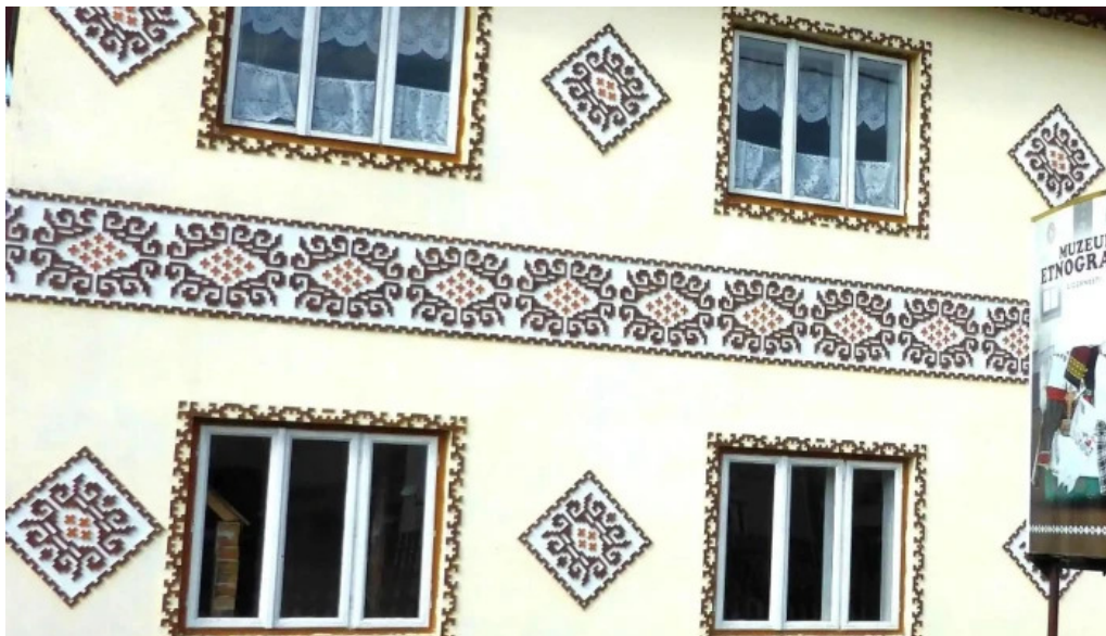
Muzeul satului ciocanesti cioc?ne?ti