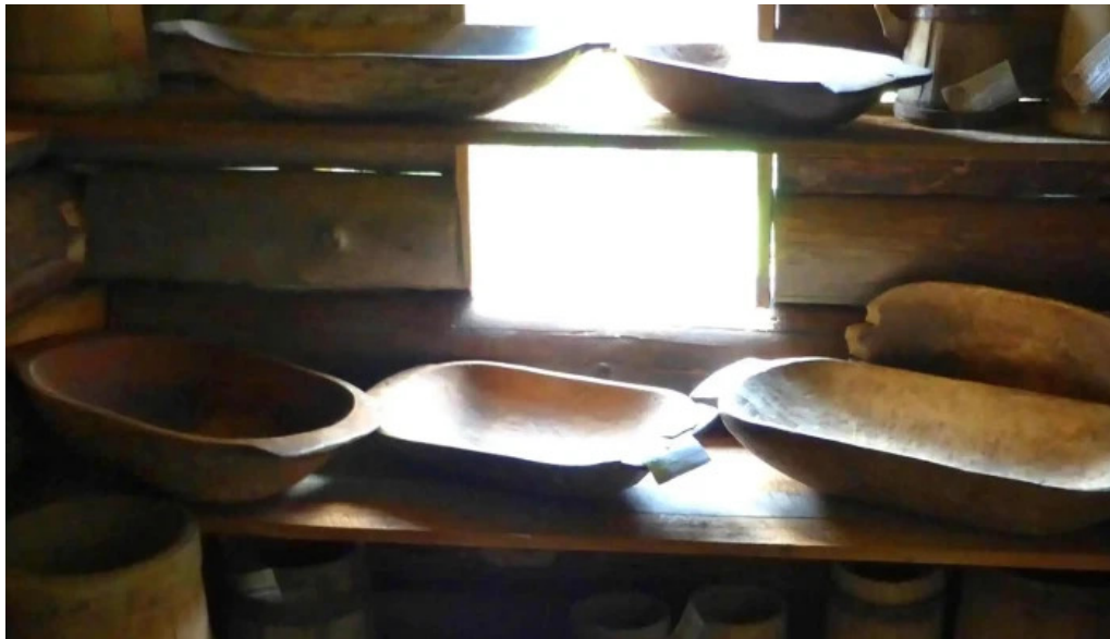
Muzeul satului ciocanesti program