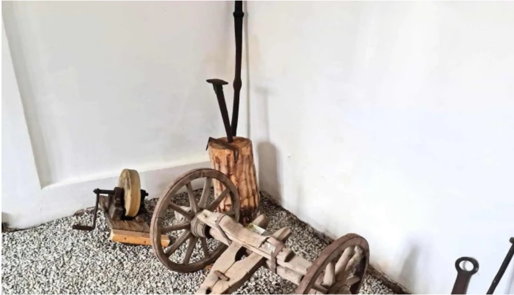
Muzeul satului ciocanesti videoclipuri