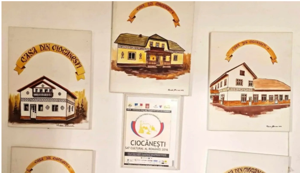
Muzeul satului ciocanesti promo?ie