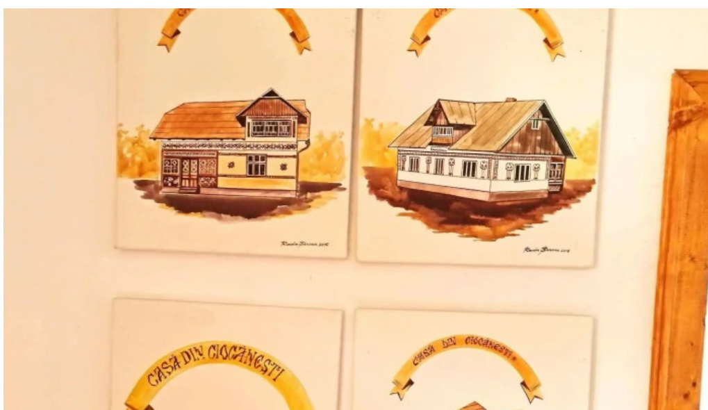
Muzeul satului ciocănești zonă