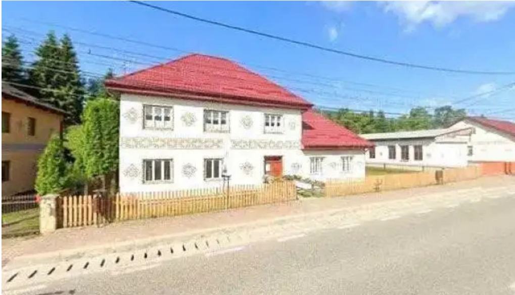
Muzeul satului ciocanesti street view si 360deg