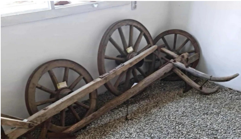
Muzeul satului ciocanesti unde