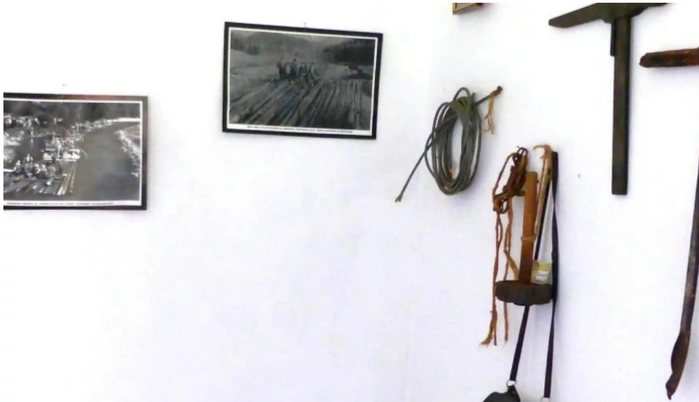
Muzeul satului ciocanesti comentarii