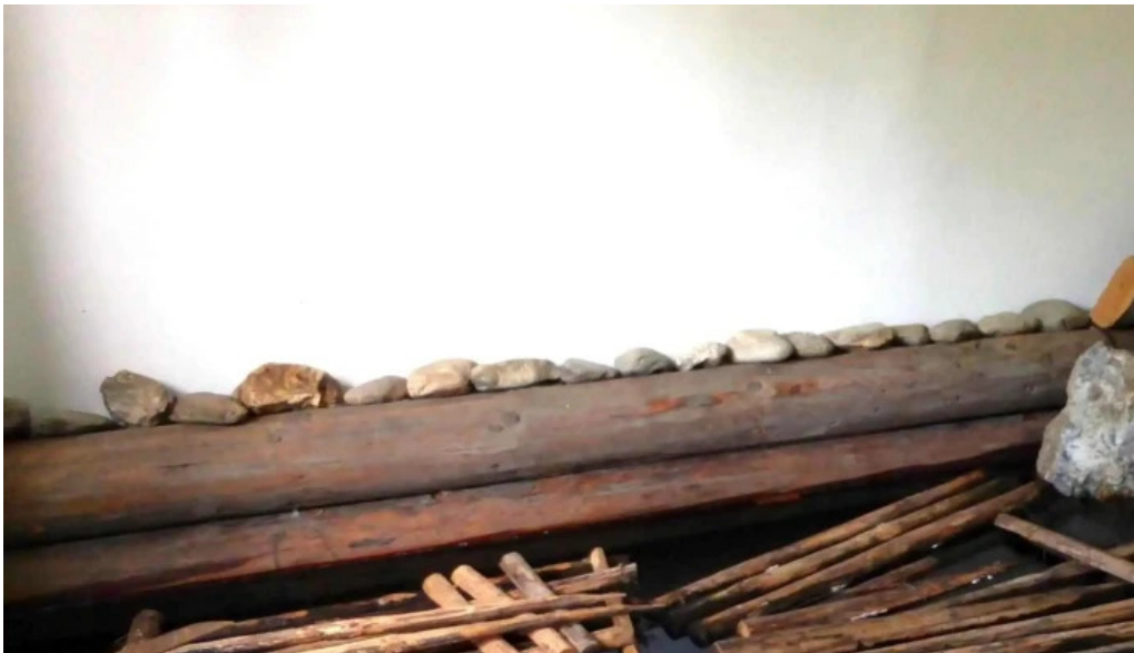
Muzeul satului ciocanesti deschis acum