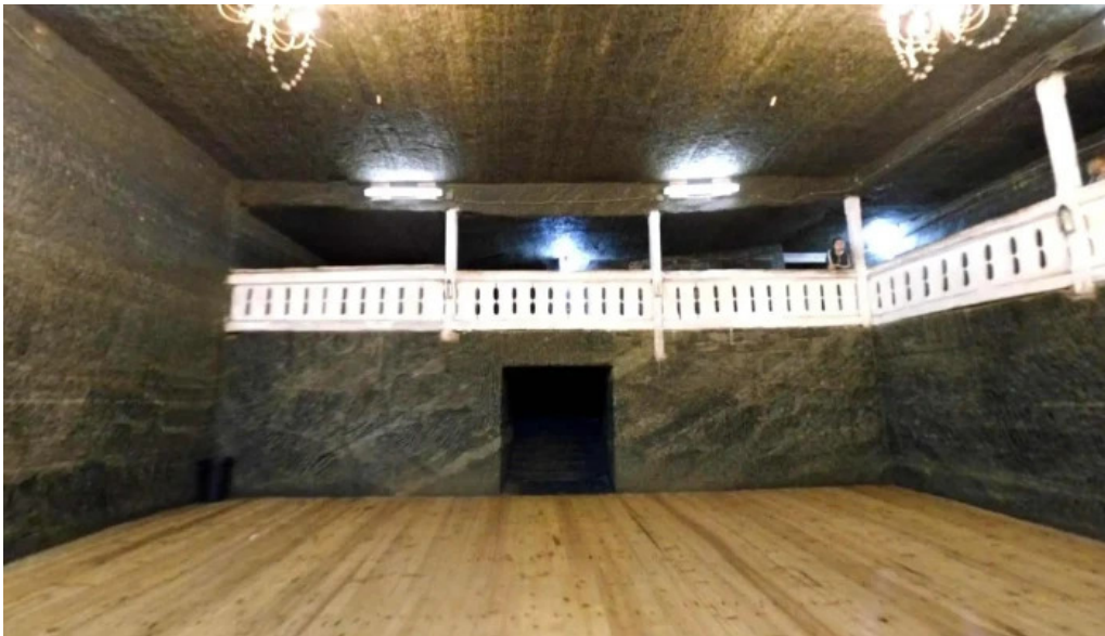
Salina cacica street view si 360deg