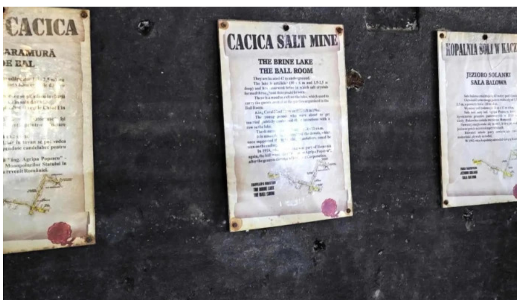
Salina cacica cacica