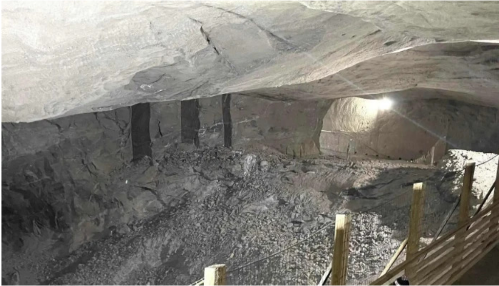
Salina cacica site web