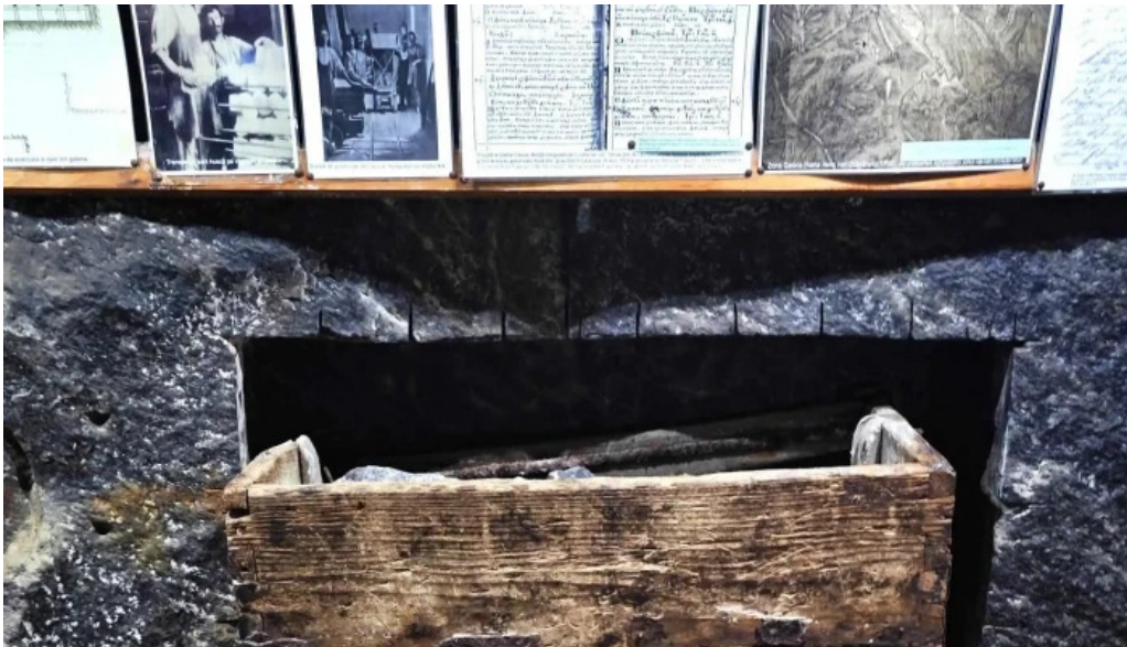
Salina cacica loca?ie