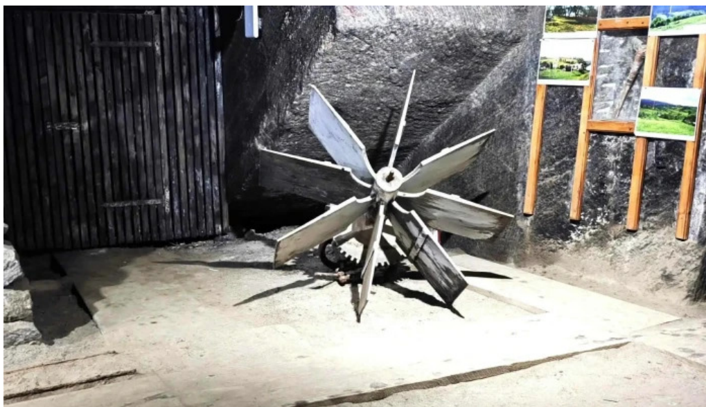
Salina cacica fotografii