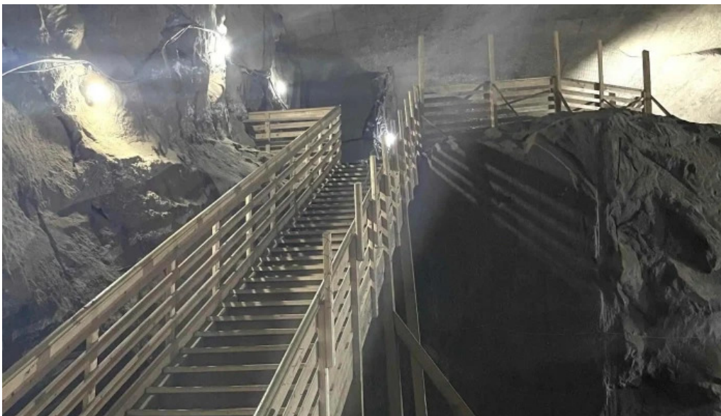
Salina cacica videoclipuri