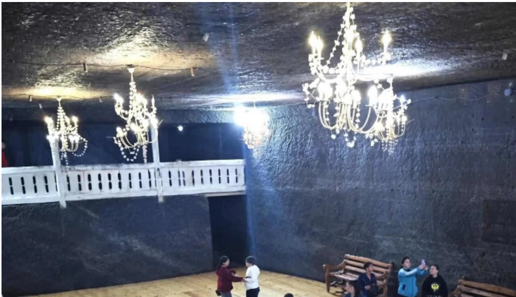
Salina cacica program