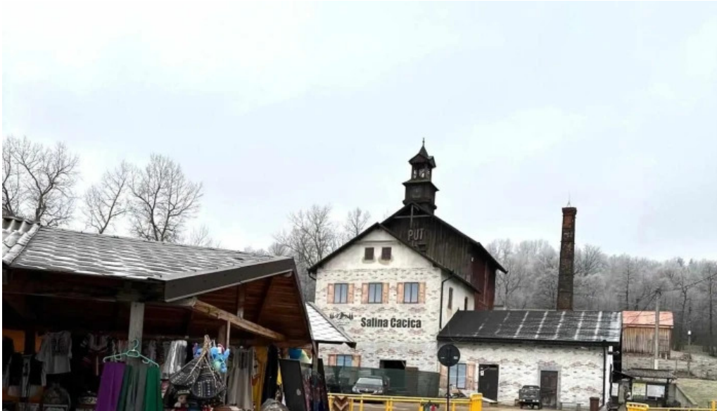
Salina cacica telefon