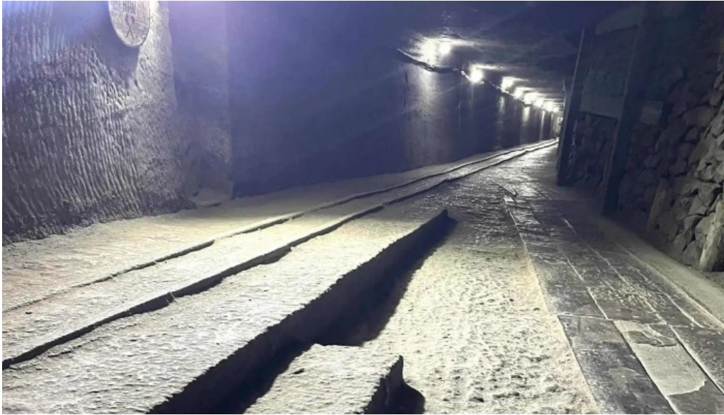
Salina cacica num?r