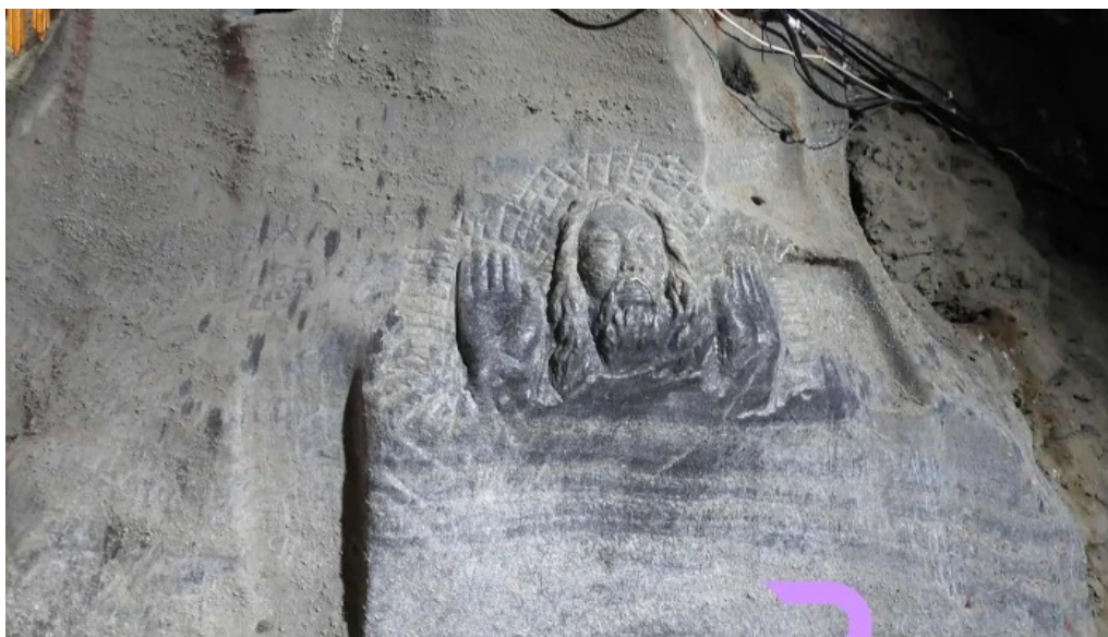
Salina cacica cele mai recente