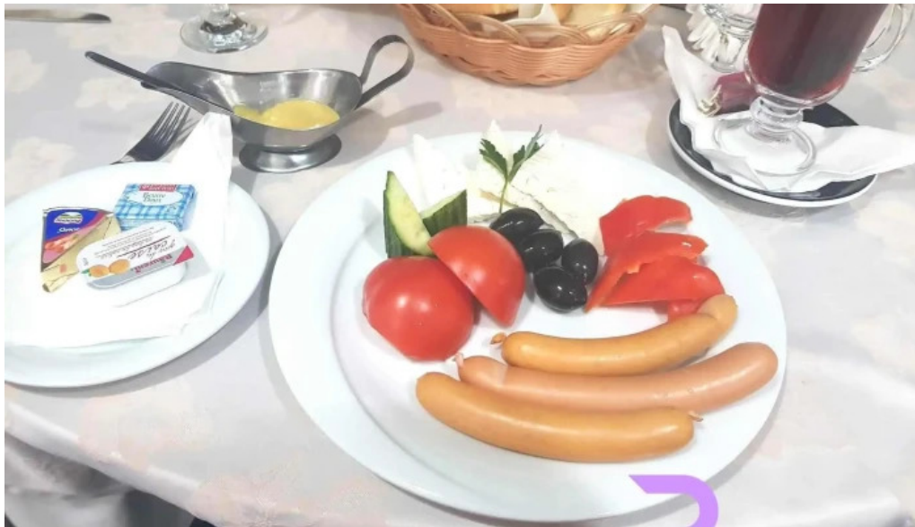
Hotel inter mancaruribauturi