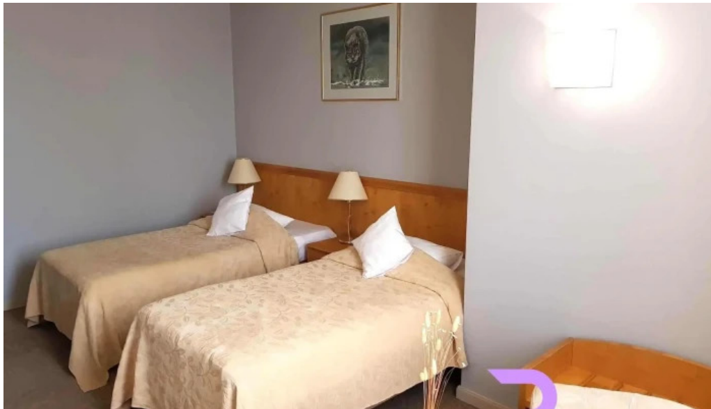
Hotel inter de la vizitatori