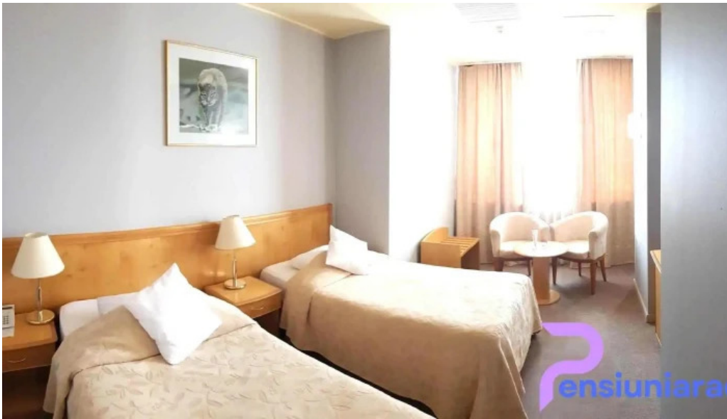
Hotel inter camere