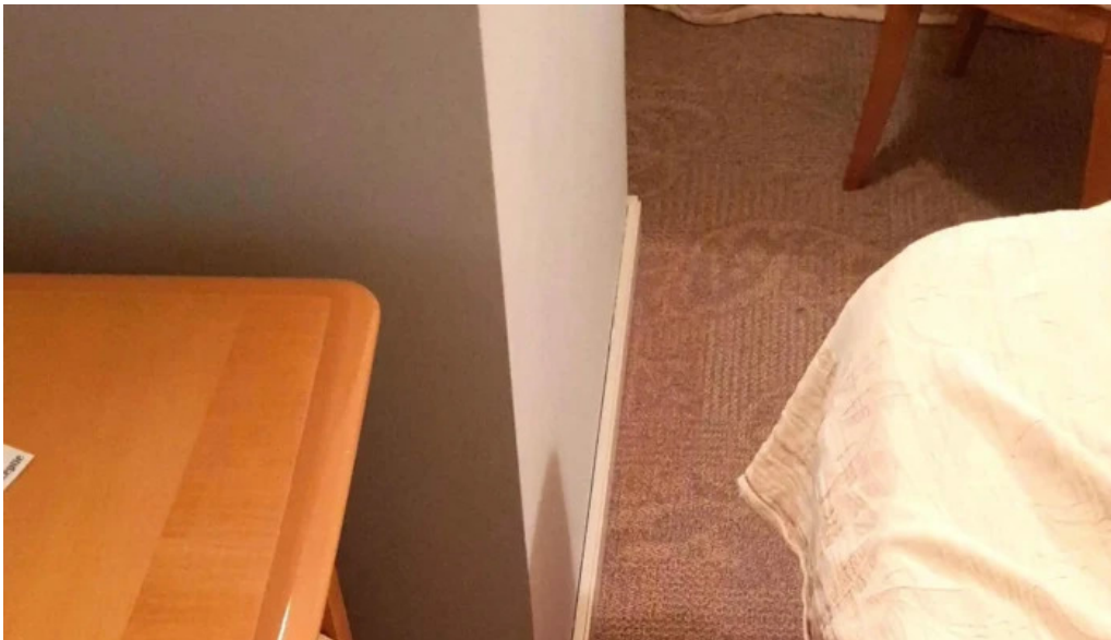
Hotel inter promo?ie