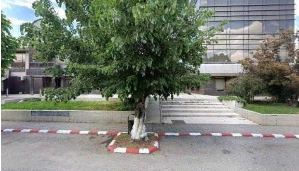
Hotel inter street view si 360deg