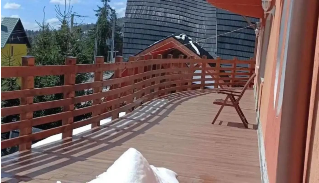
Hotel four seasons videoclipuri