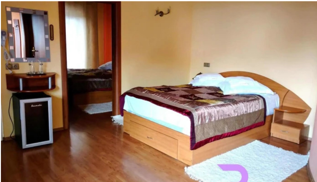
Hotel four seasons camere