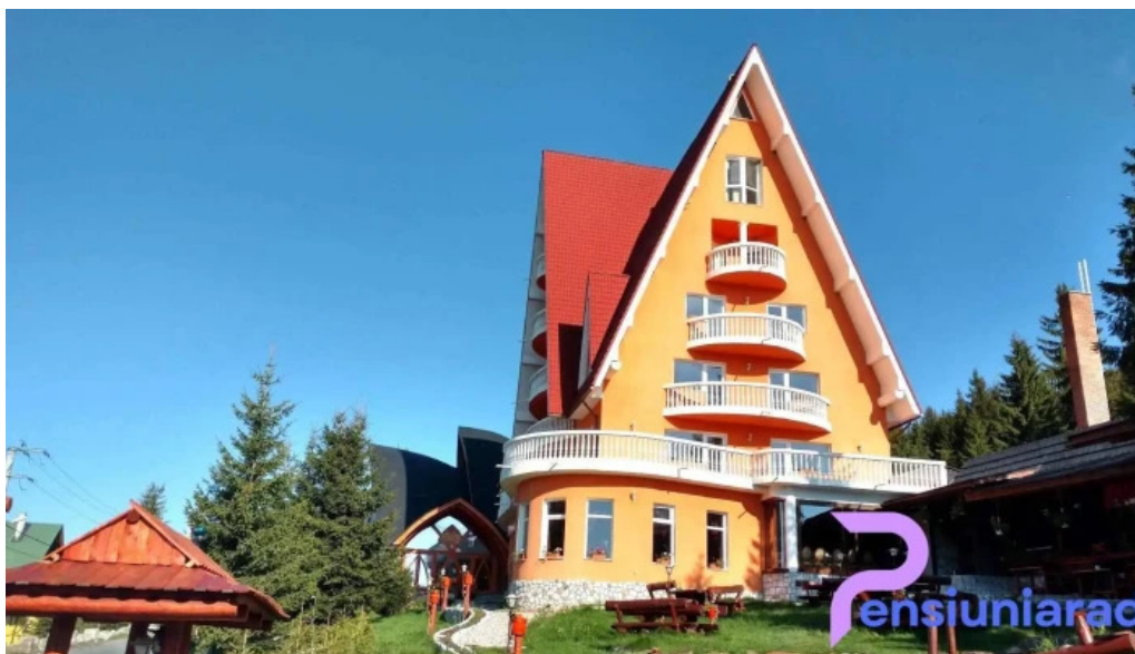
Hotel four seasons aproape de mine