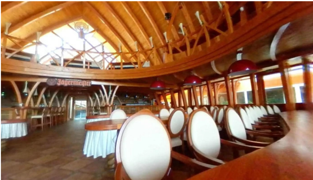
Hotel four seasons street view si 360deg