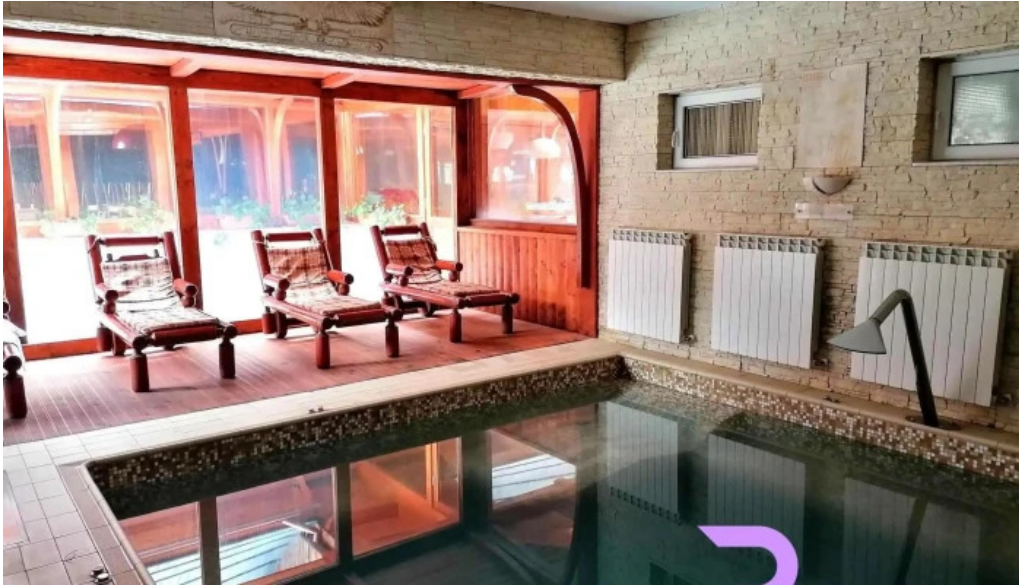
Hotel four seasons dotari