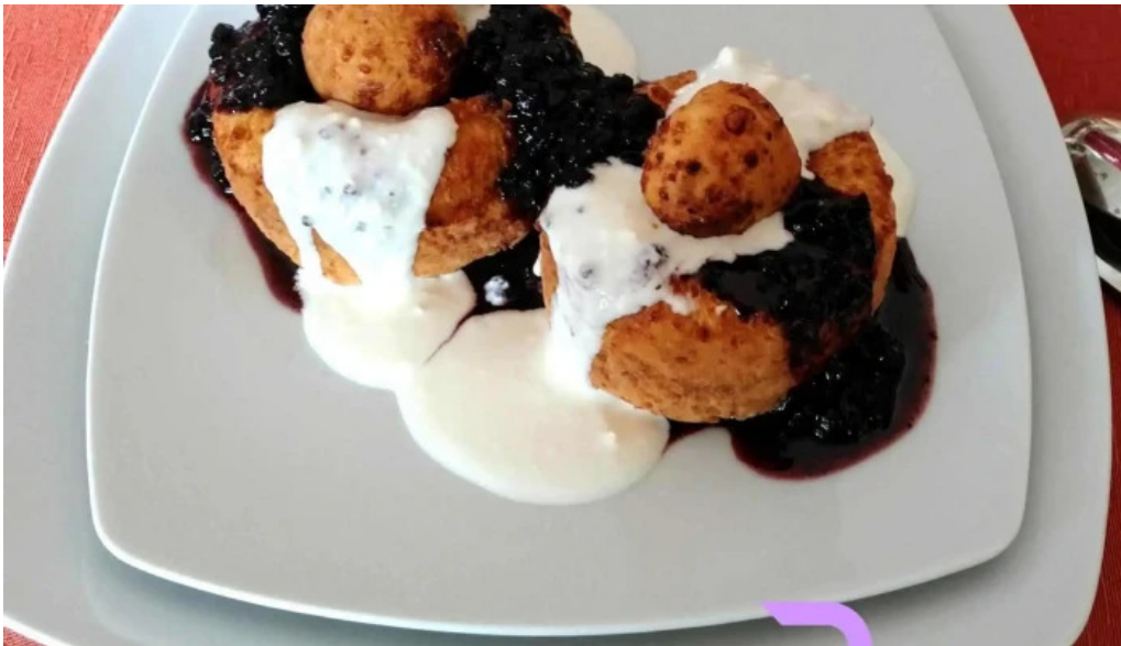
Hotel four seasons mancaruribauturi