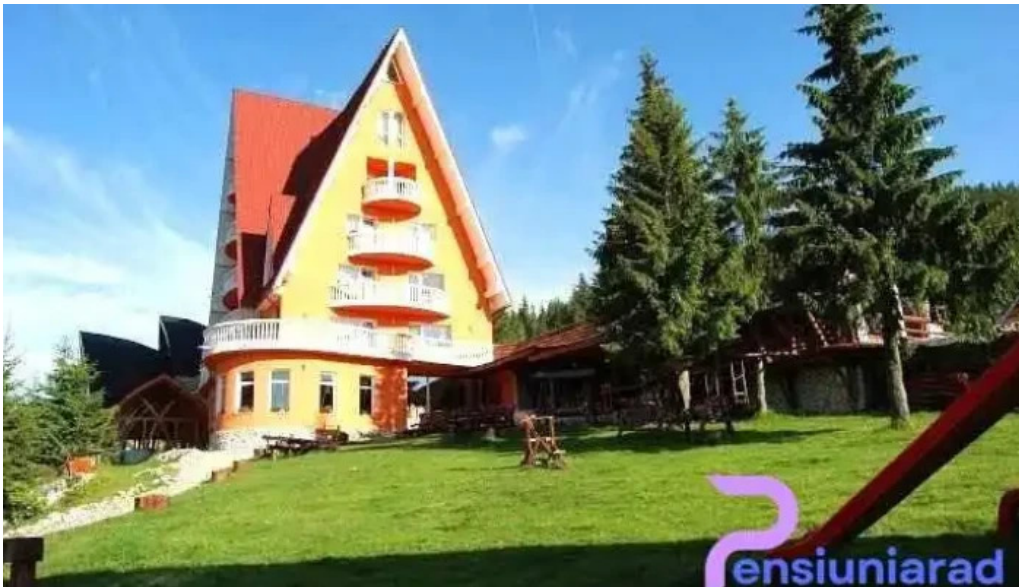
Hotel four seasons vartop