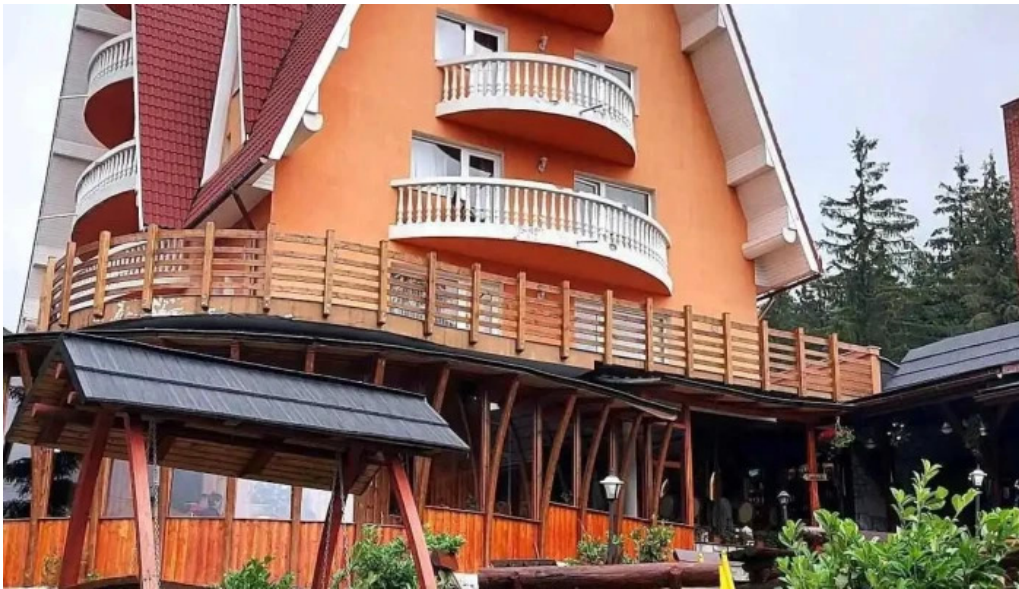
Hotel four seasons de la vizitatori