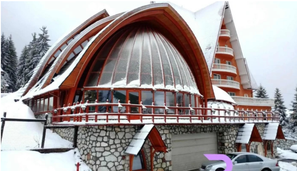
Hotel four seasons de la proprietar