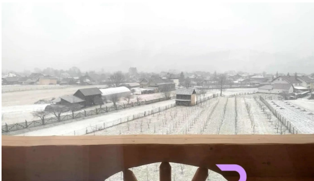
Bucovina exclusiv cele mai recente