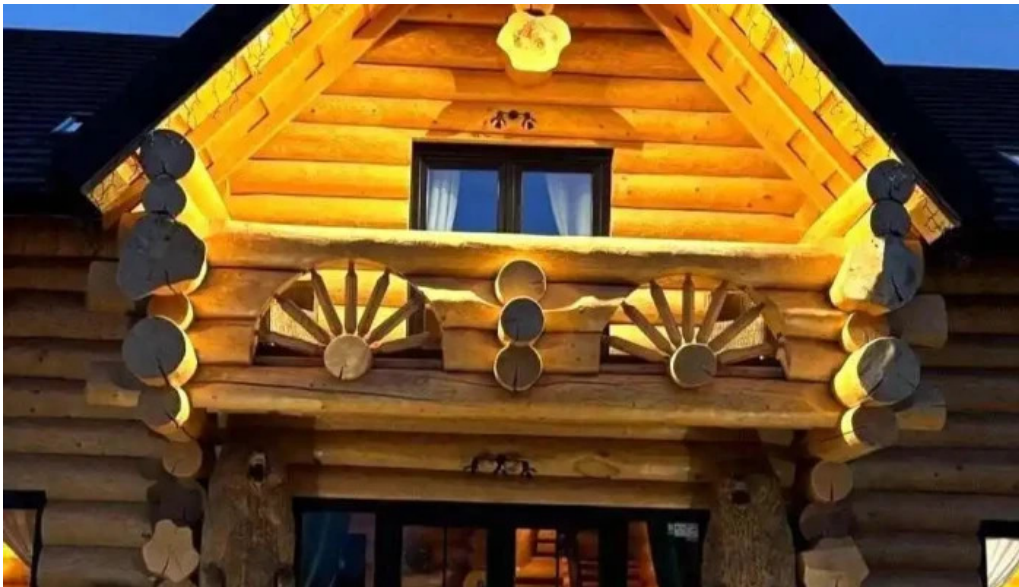
Bucovina exclusiv exterior