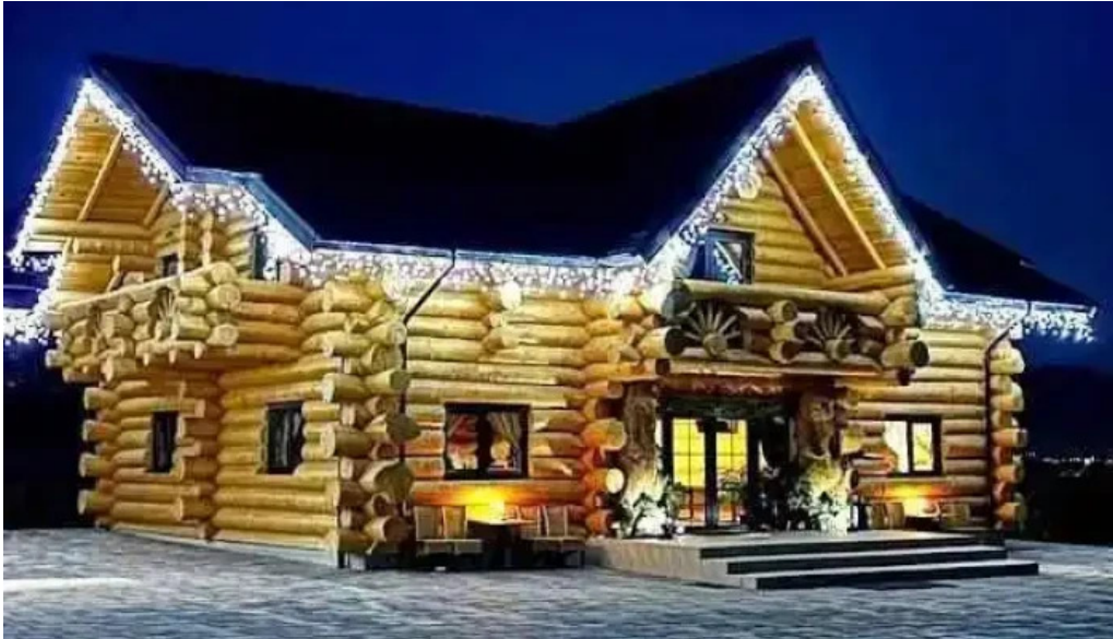
Bucovina exclusiv vama