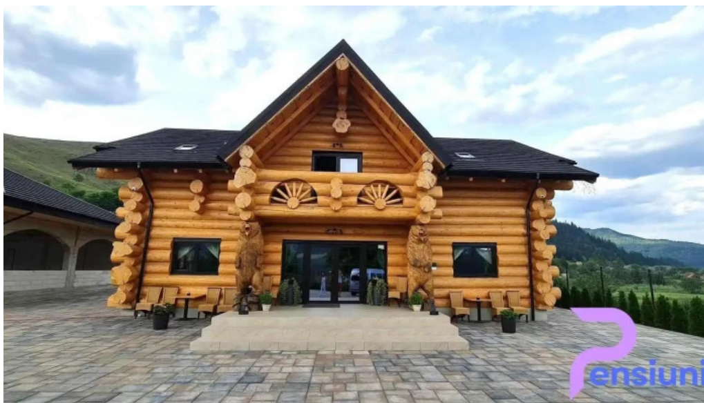
Bucovina exclusiv de la vizitatori