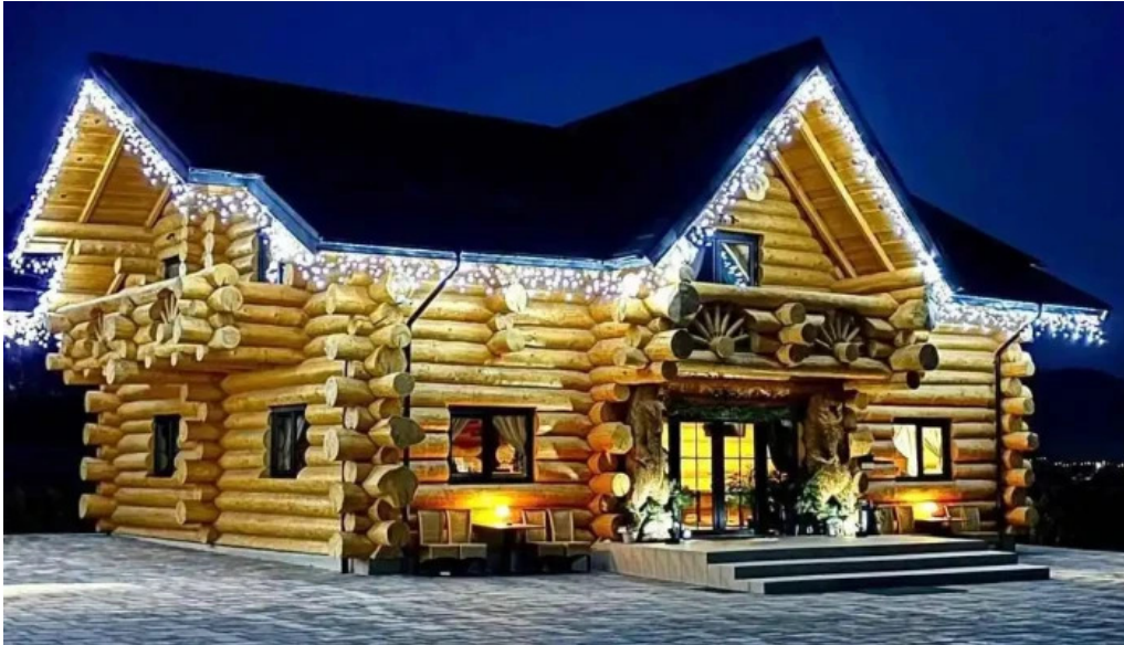
Bucovina exclusiv aproape de mine