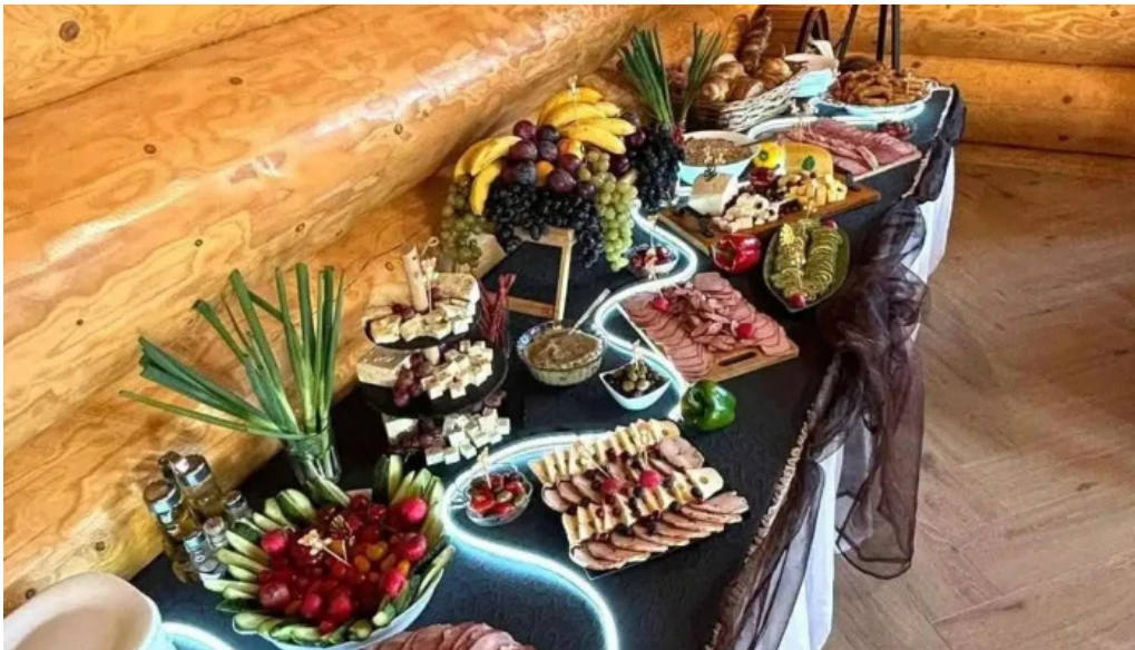
Bucovina exclusiv mancaruribauturi