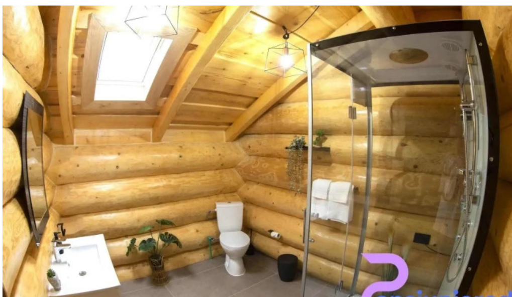
Bucovina exclusiv de la proprietar