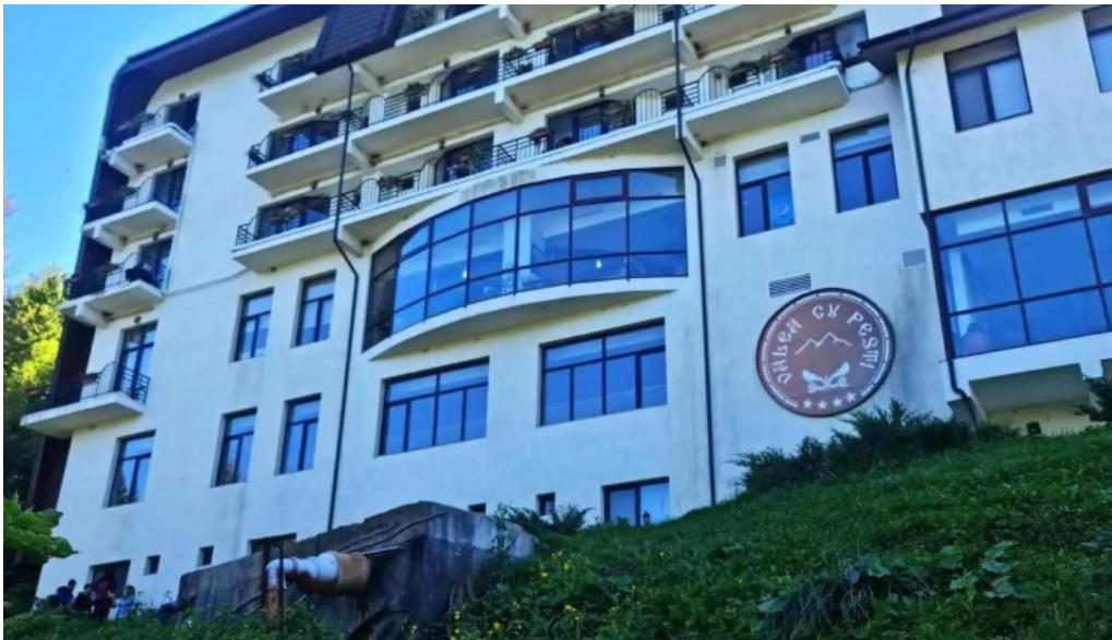
Valea cu pesti de la vizitatori