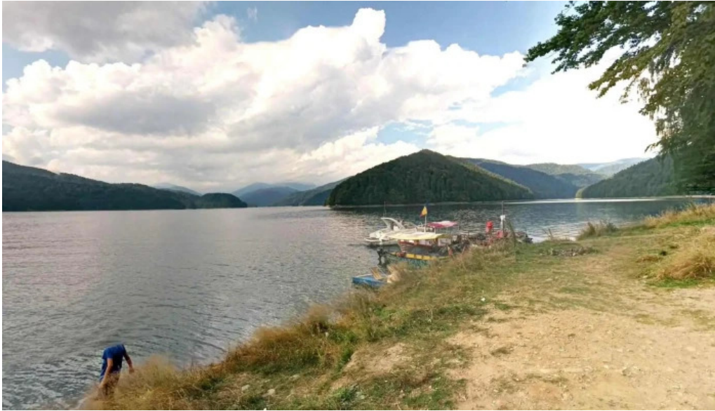
Valea cu pesti street view si 360deg