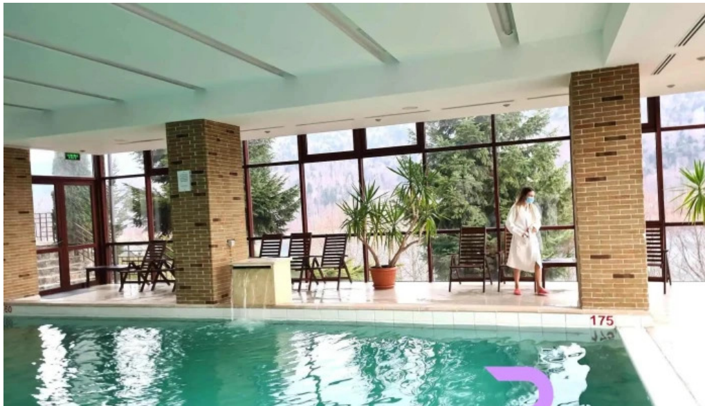
Valea cu pesti dotari