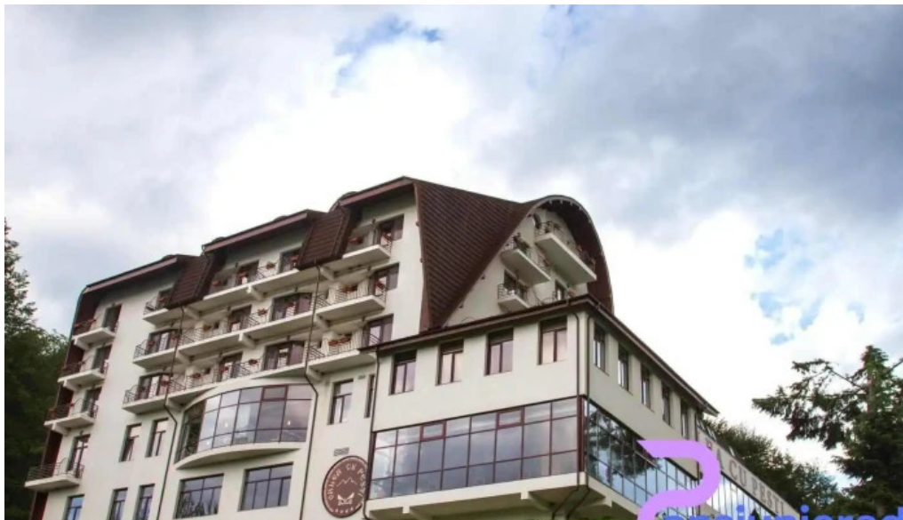
Valea cu pe?ti transf?g?r??an