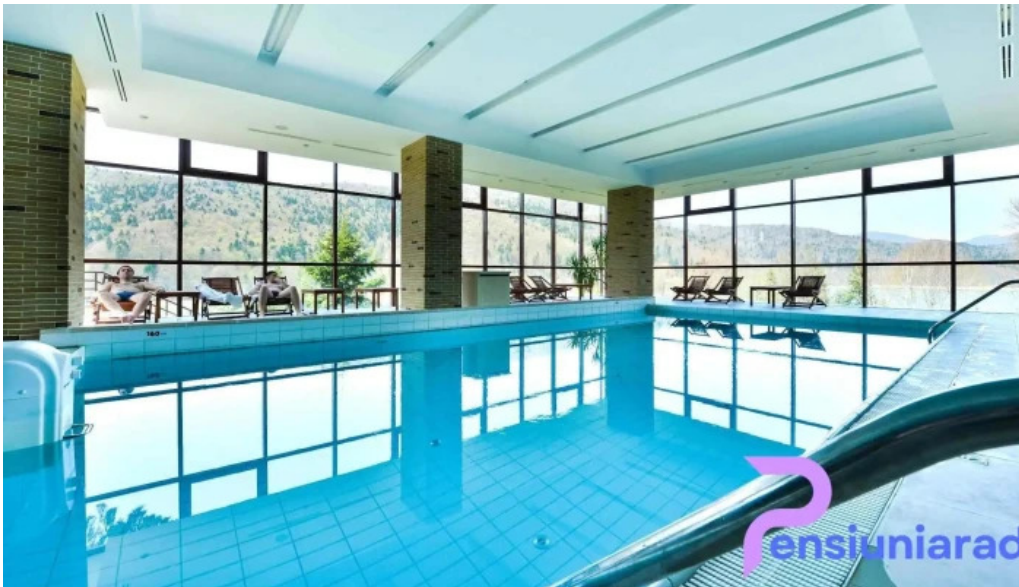
Valea cu pesti de la proprietar