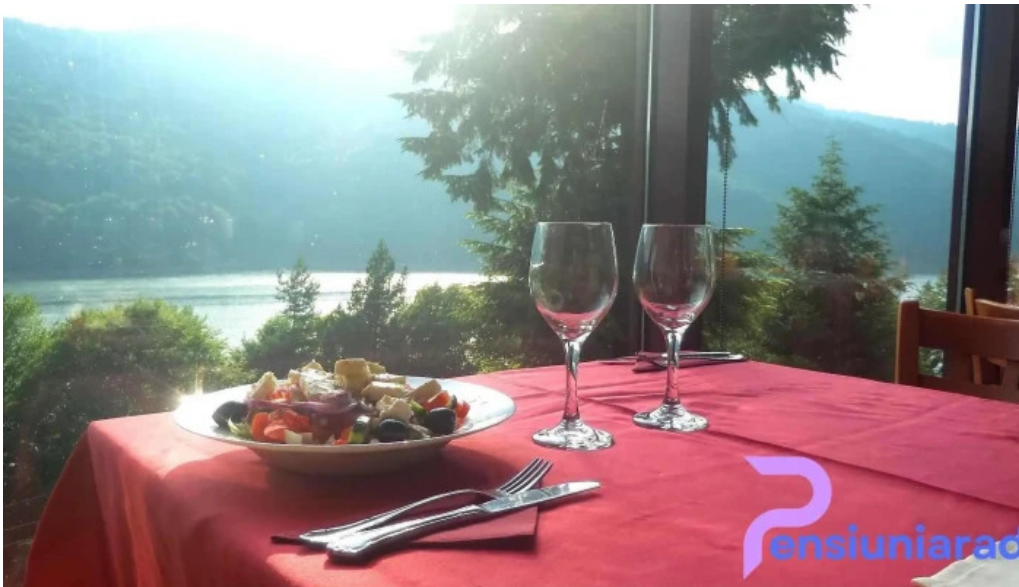
Valea cu pesti mancaruribauturi