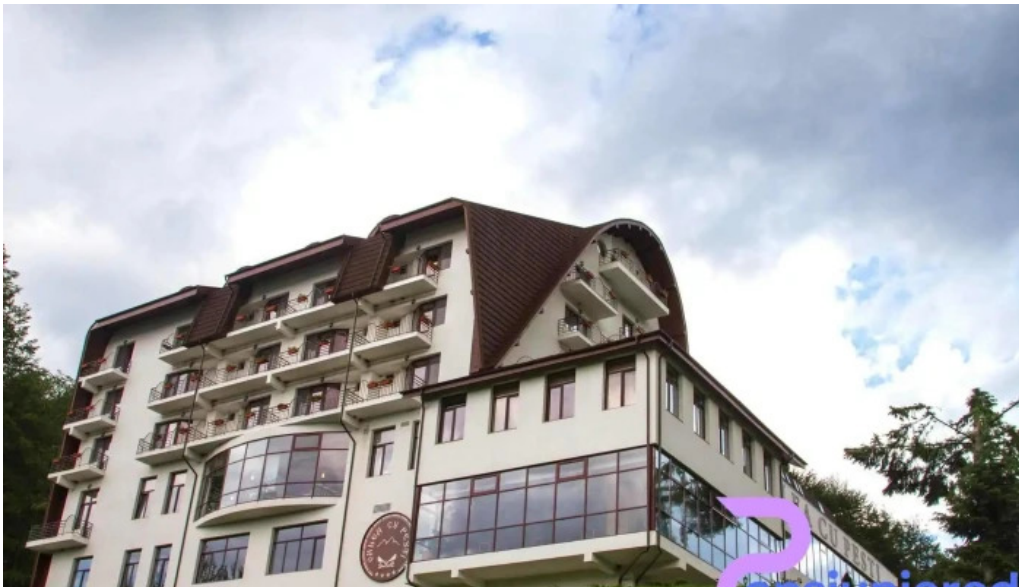
Valea cu pesti fotografii