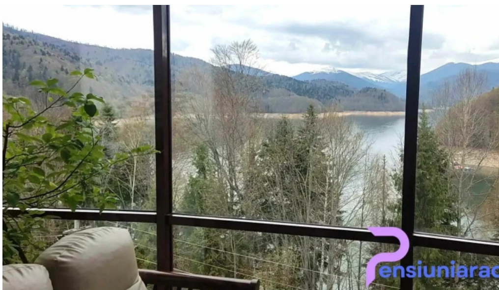
Valea cu pesti videoclipuri