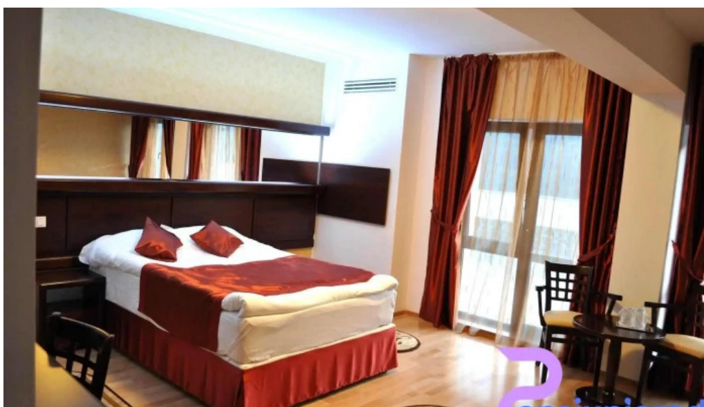
Valea cu pesti camere