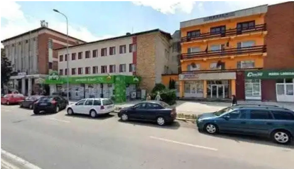
Podgoria hotel street view si 360deg