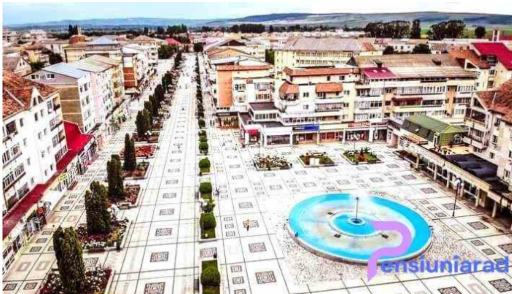
Han turistic zon?