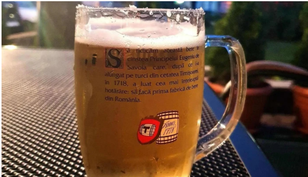
Han turistic mancaruribauturi