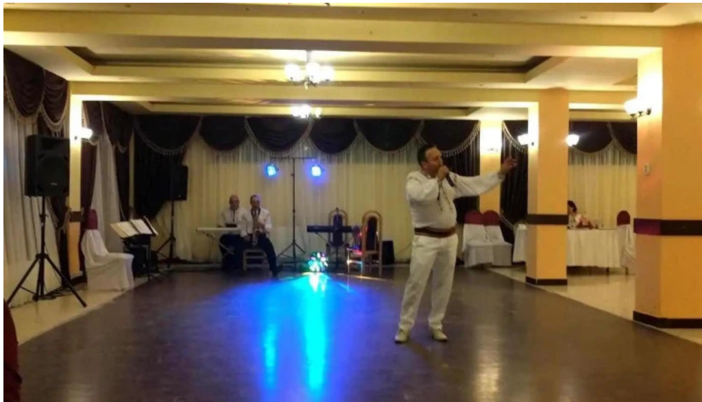
Han turistic de la vizitatori