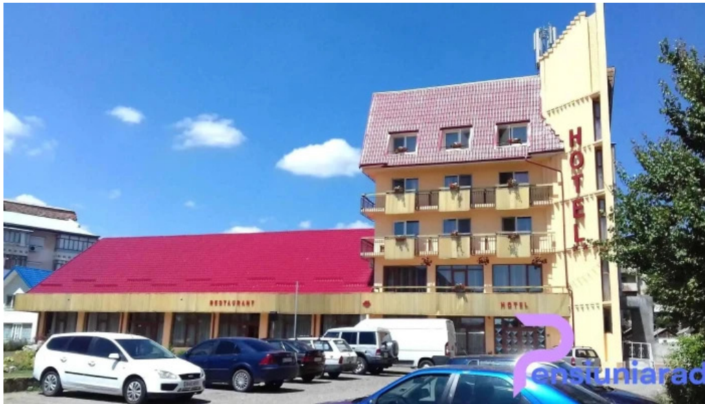
Han turistic exterior