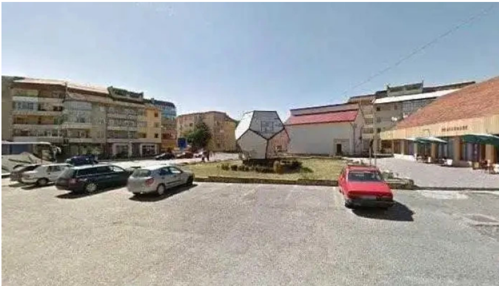
Han turistic street view si 360deg