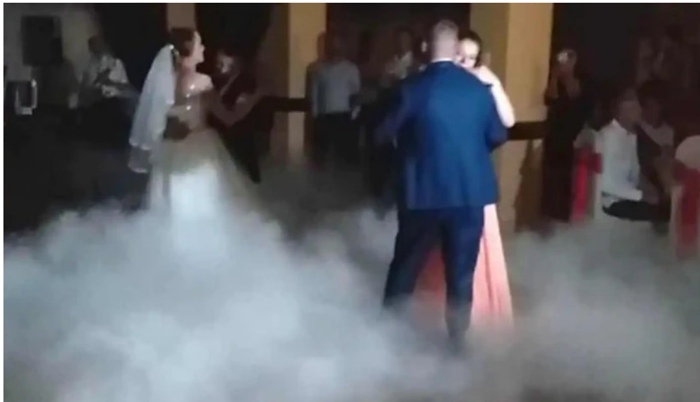
Han turistic videoclipuri