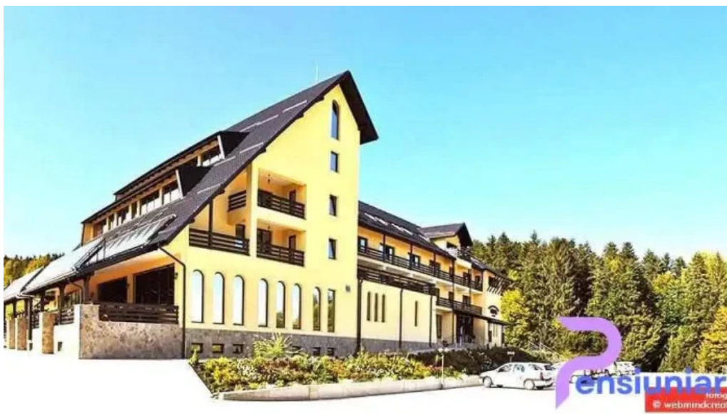
Voievod de la proprietar