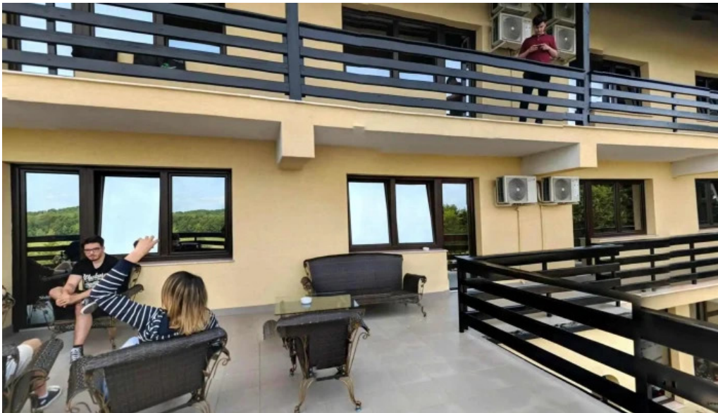
Voievod street view si 360deg