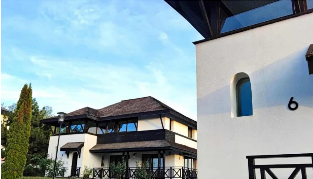
Satul prunilor num?r