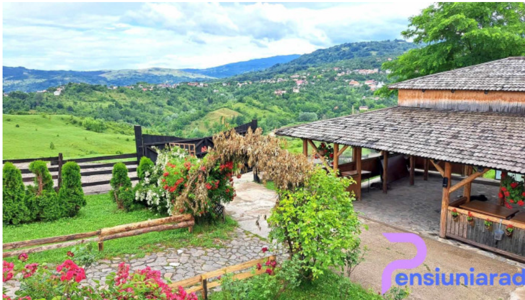
Satul prunilor exterior