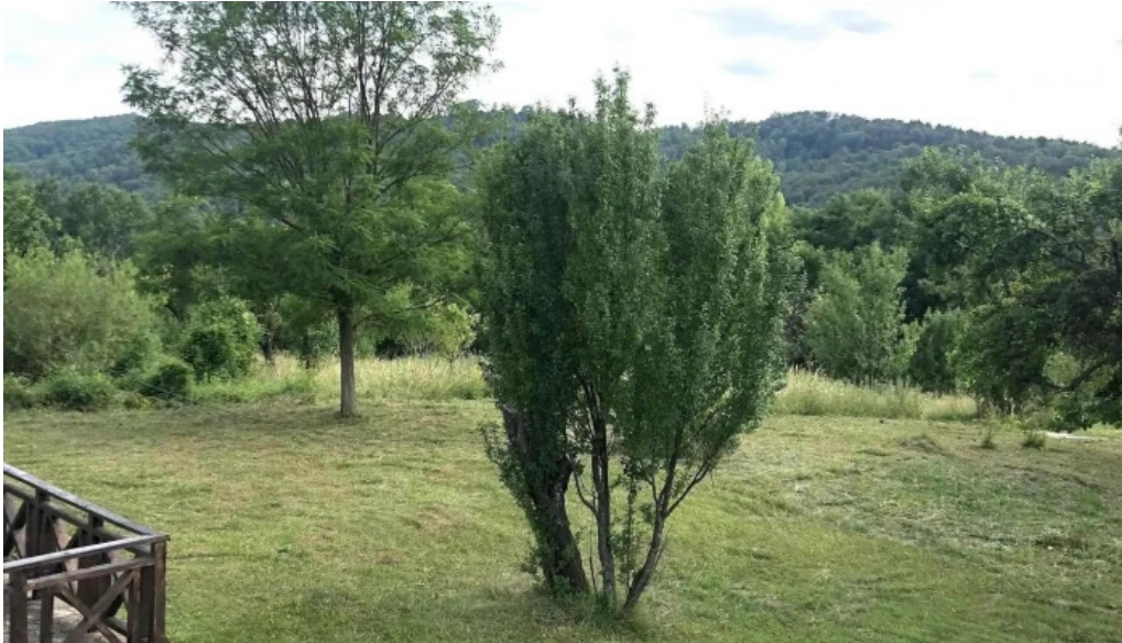
Satul prunilor aproape de mine