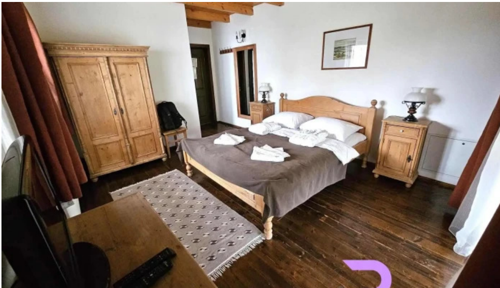
Satul prunilor camere