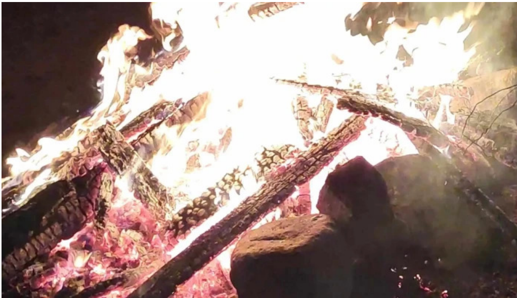
Satul prunilor pietro?i?a