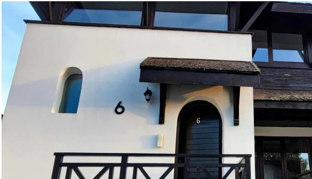
Satul prunilor fotografii