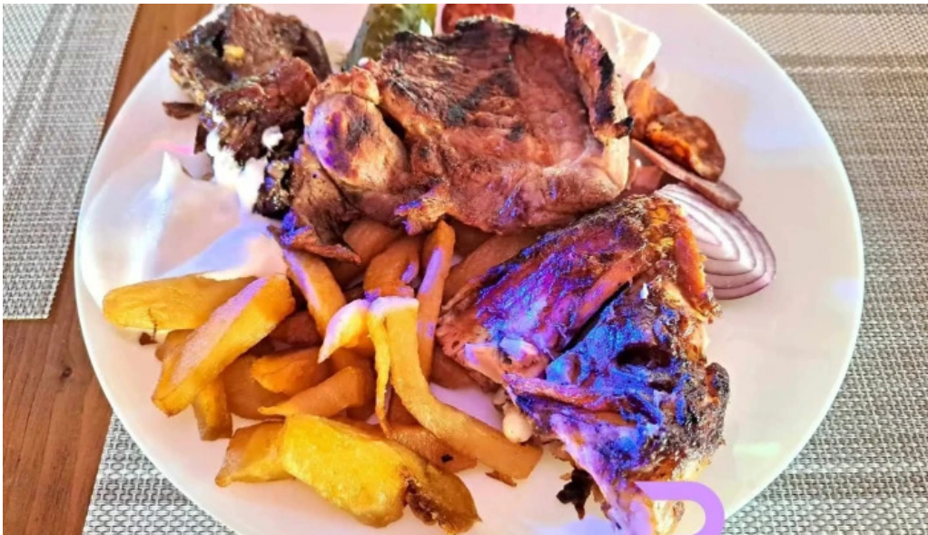
Satul prunilor mancaruribauturi