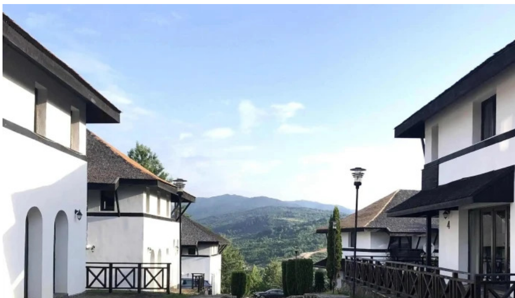
Satul prunilor telefon