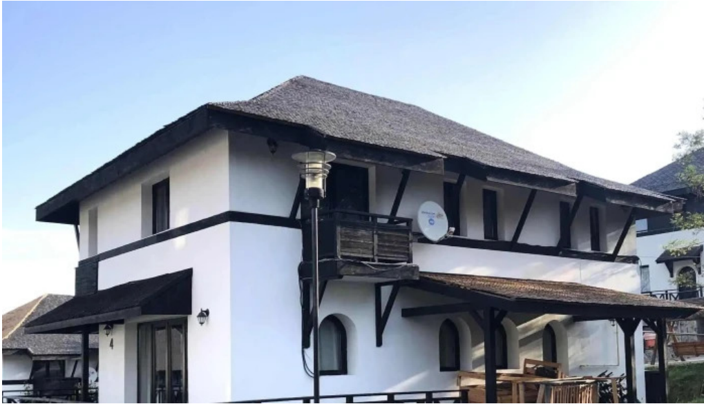
Satul prunilor cum s? ajungi acolo