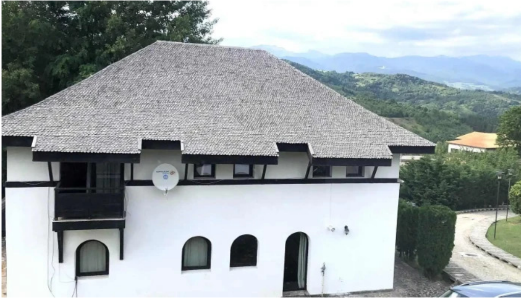
Satul prunilor site web