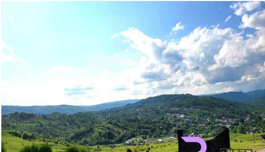
Satul prunilor de la vizitatori