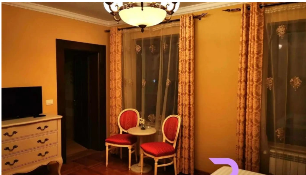
Conacul dante de la vizitatori