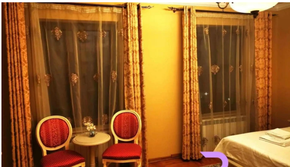
Conacul dante camere