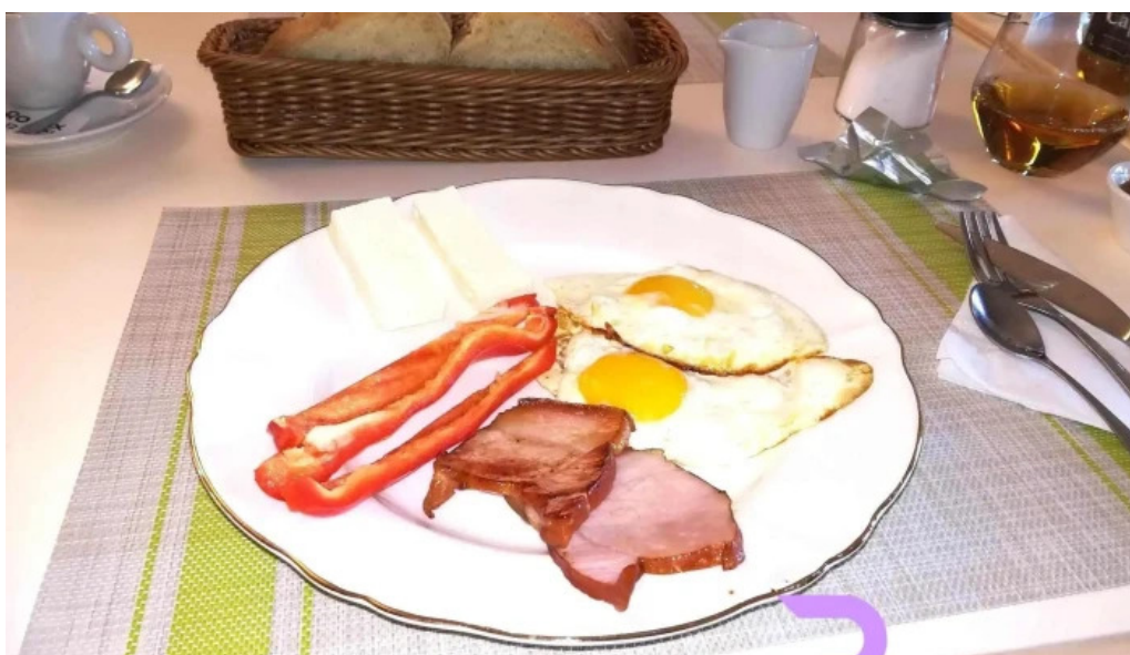
Conacul dante mancaruribauturi