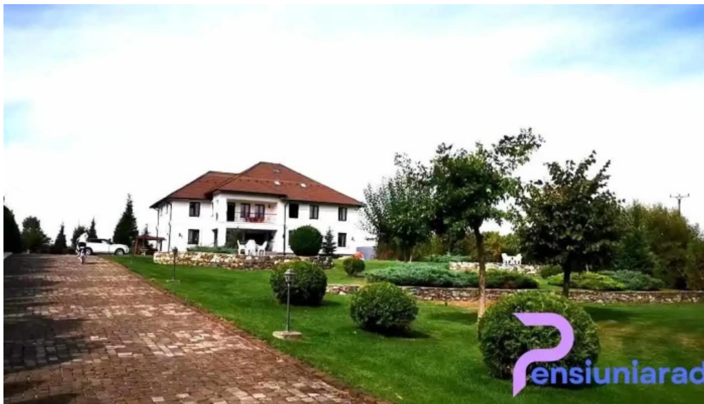
Conacul dante exterior