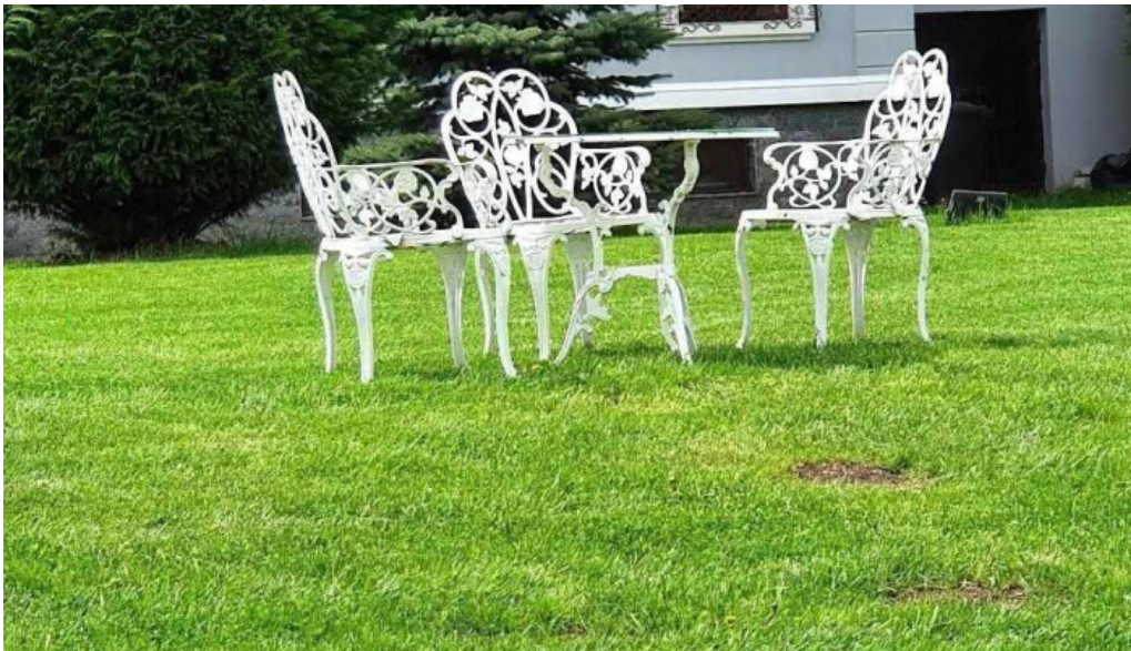
Conacul dante promo?ie