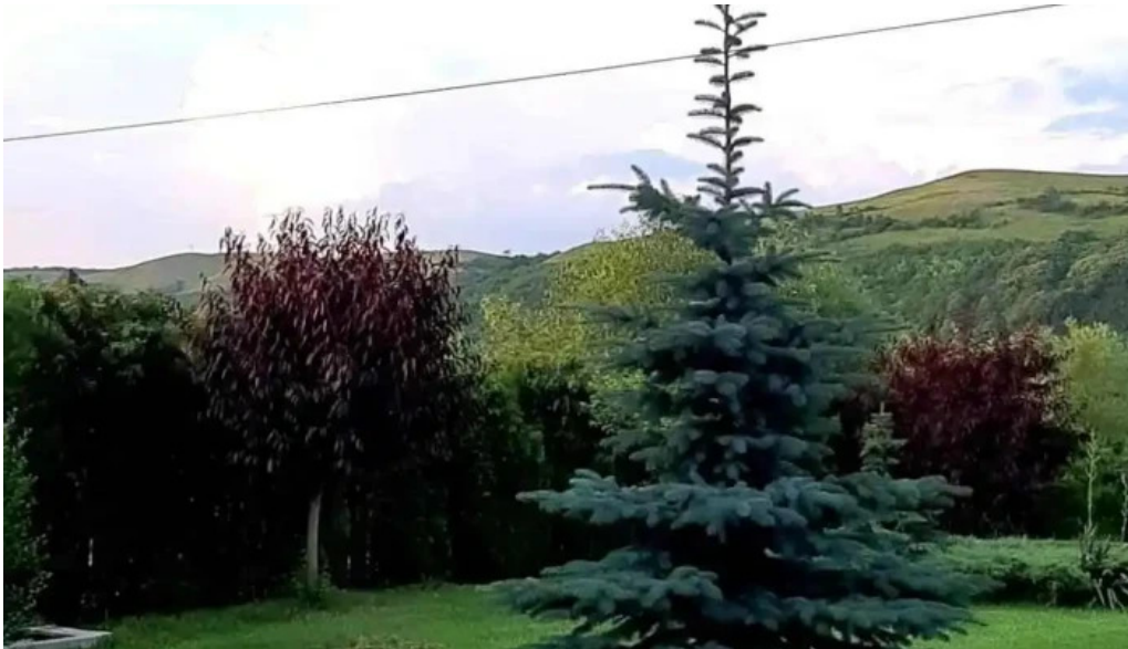
Conacul dante videoclipuri