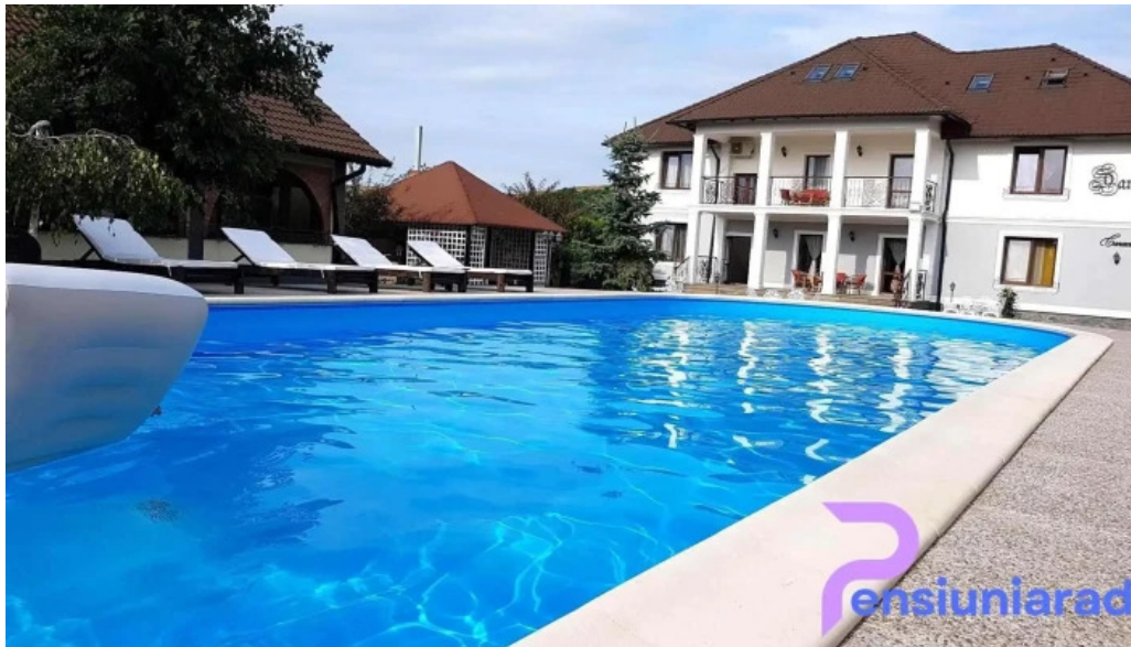
Conacul dante dotari