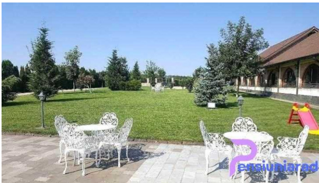
Conacul dante pianu de jos