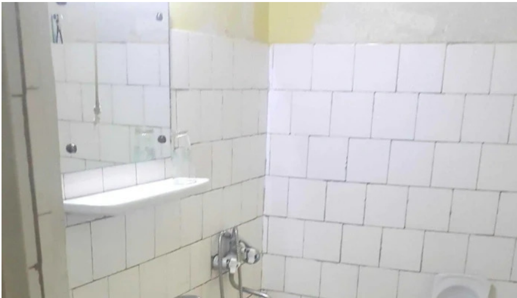
Hotel onix petro?ani