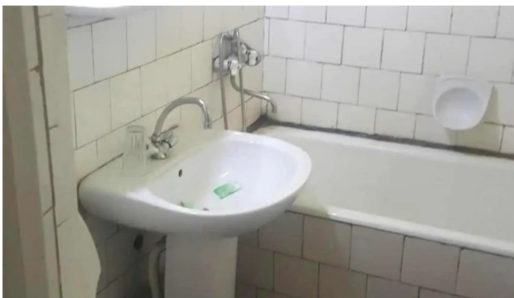
Hotel onix camere