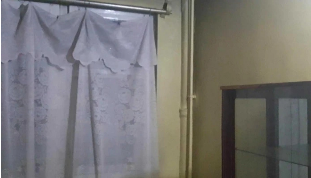
Hotel onix telefon