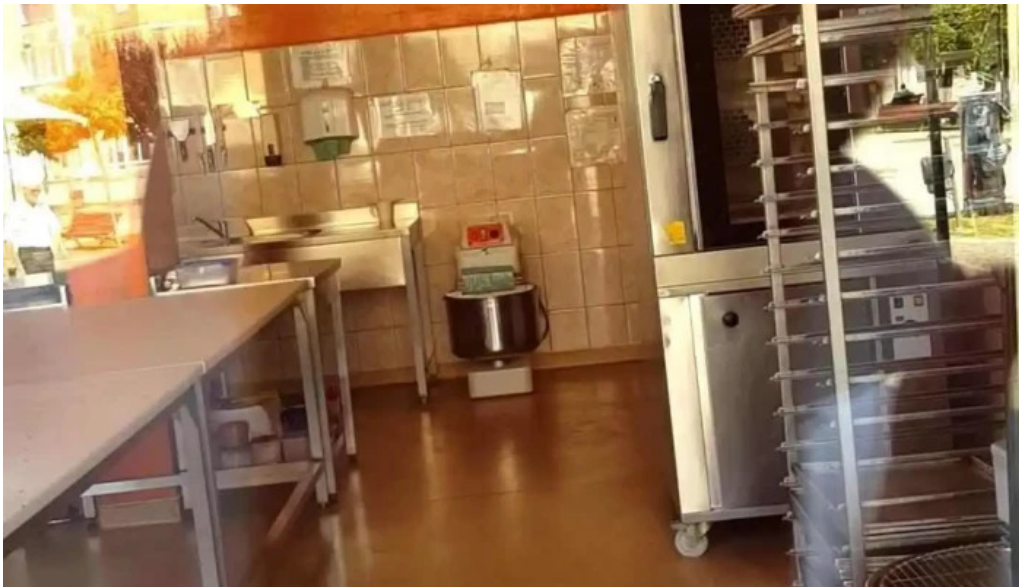
Hotel onix videoclipuri