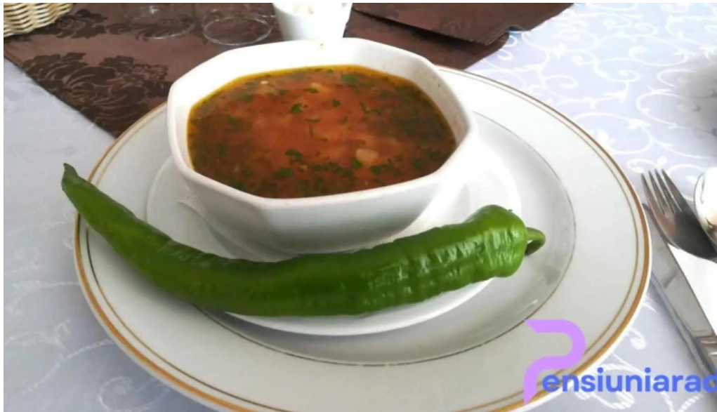
Hotel onix mancaruribauturi