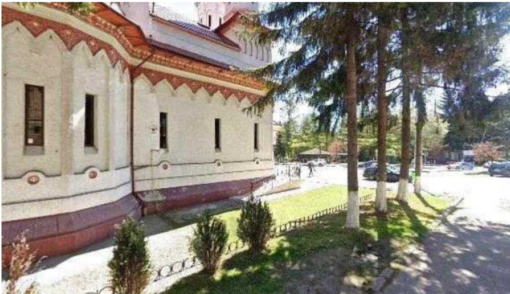
Hotel onix street view si 360deg