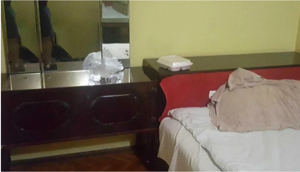
Hotel onix promo?ie