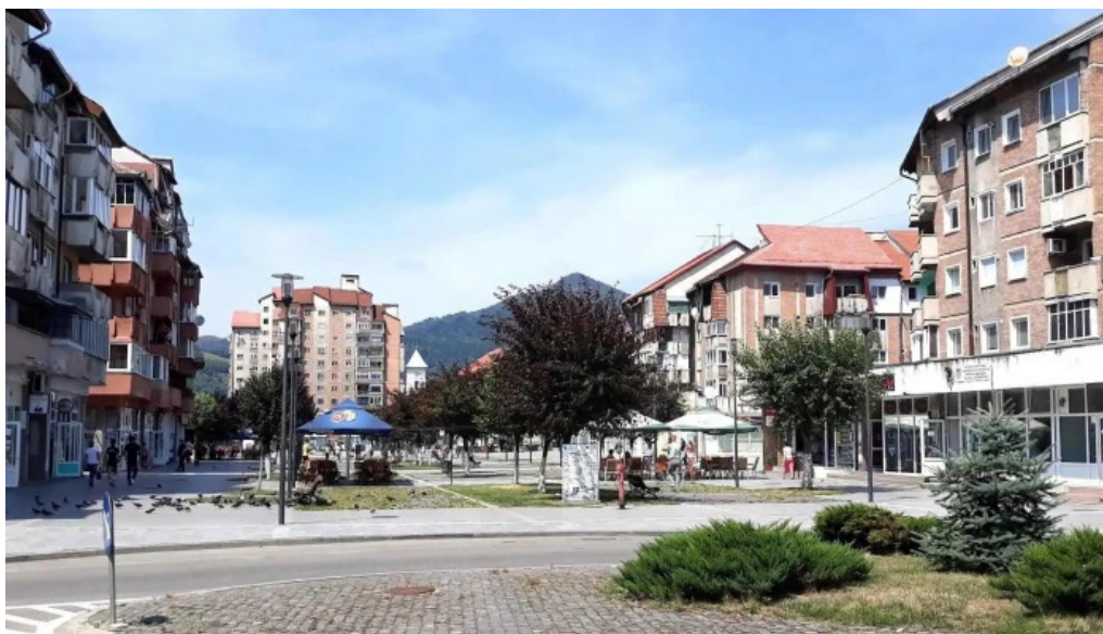
Hotel onix exterior