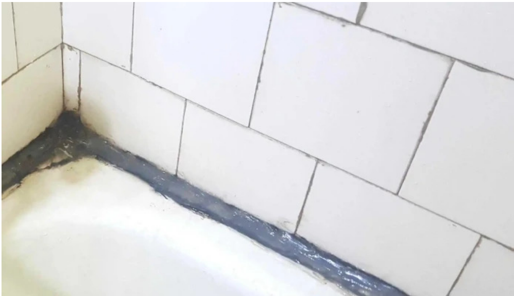
Hotel onix zon?