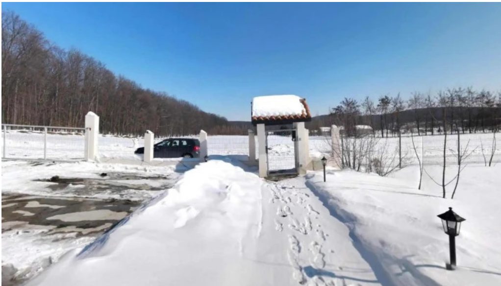
Pensiunea antique street view si 360deg