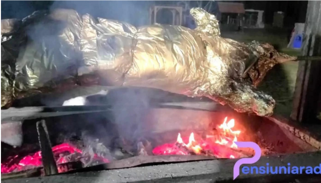
Pensiunea antique videoclipuri