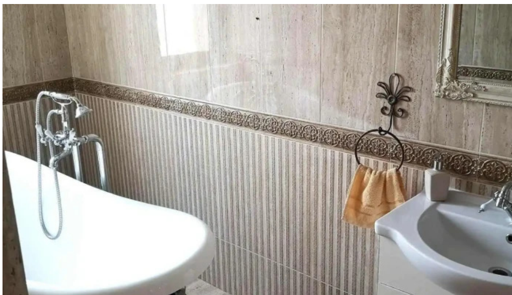
Pensiunea antique de la vizitatori