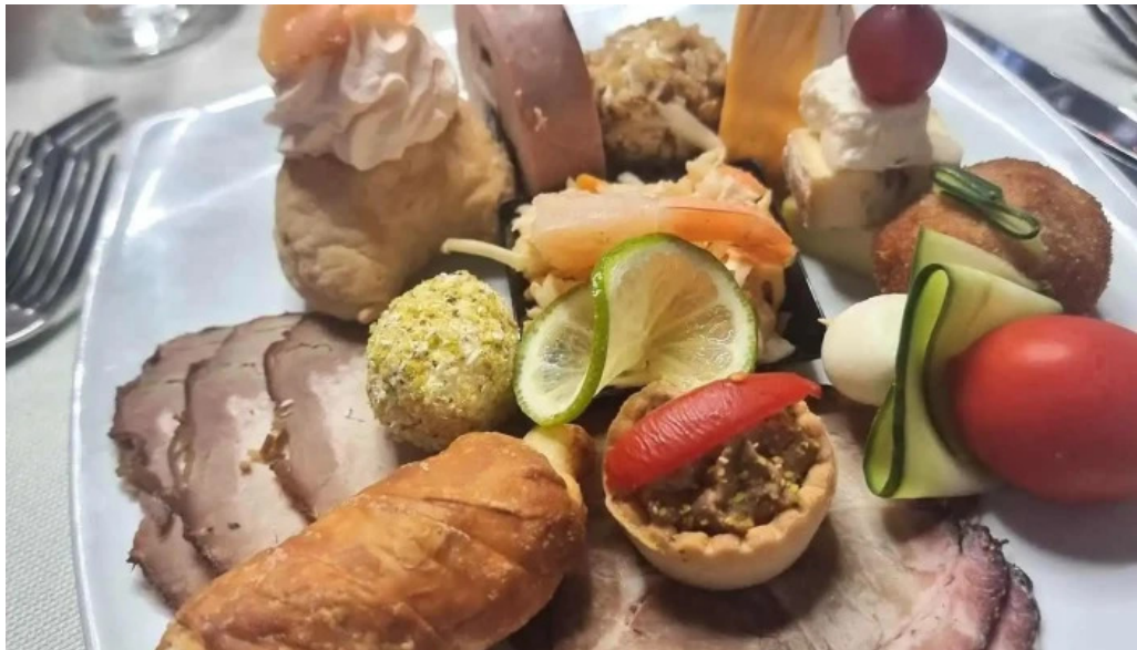
Pensiunea antique mancaruribauturi