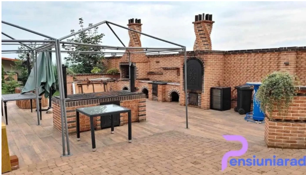
Pensiunea antique promo?ie