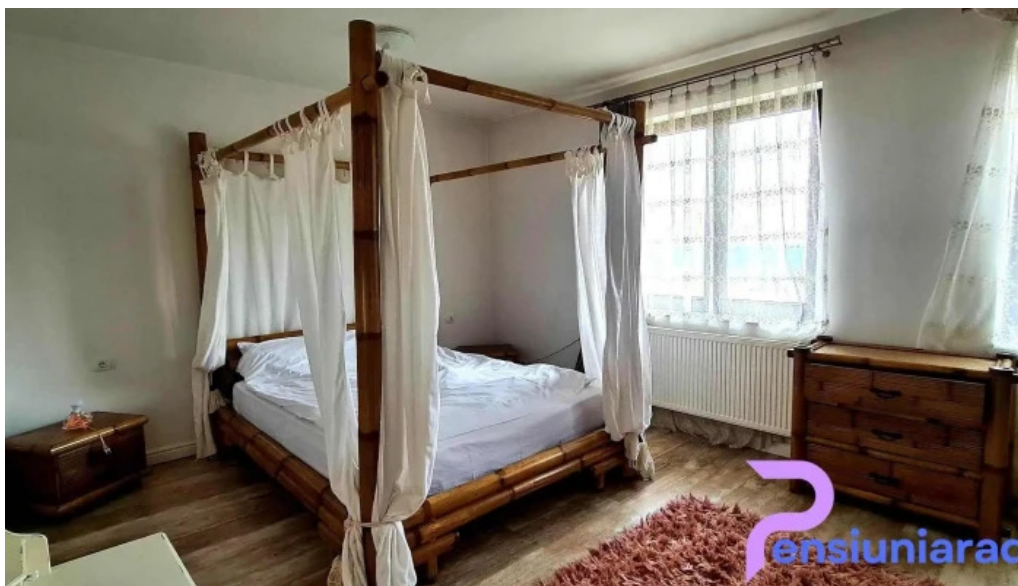
Pensiunea antique camere