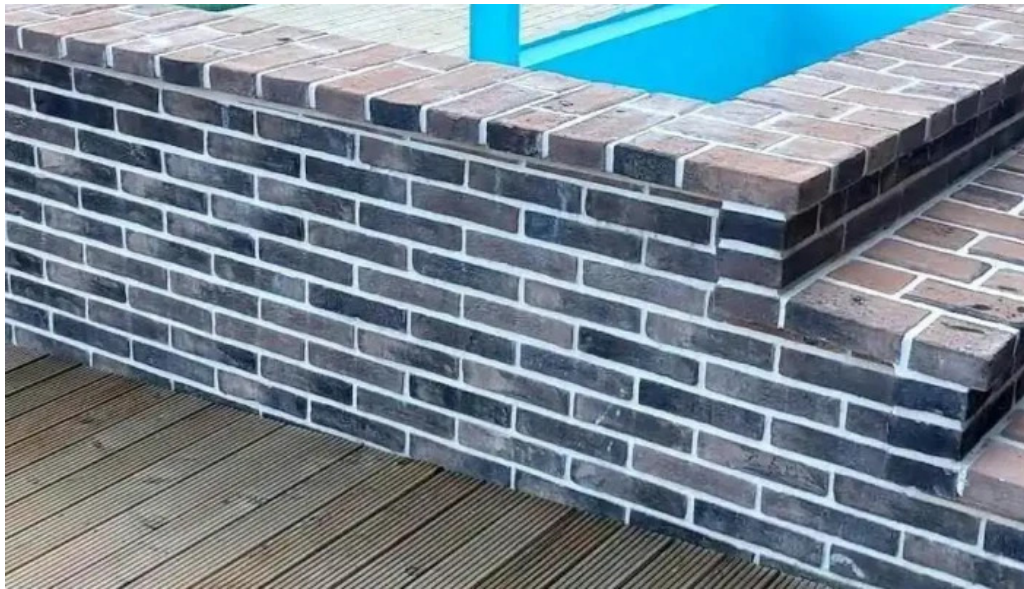
Pensiunea antique dotari