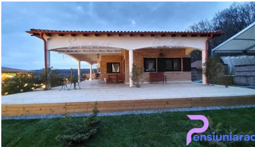
Pensiunea antique exterior