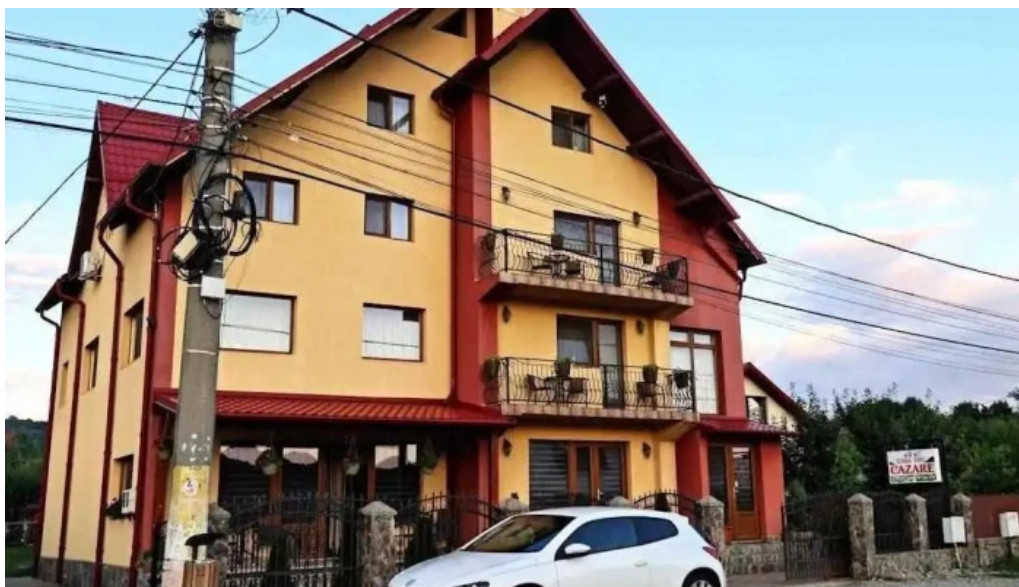
Casa leu curtea de arge?