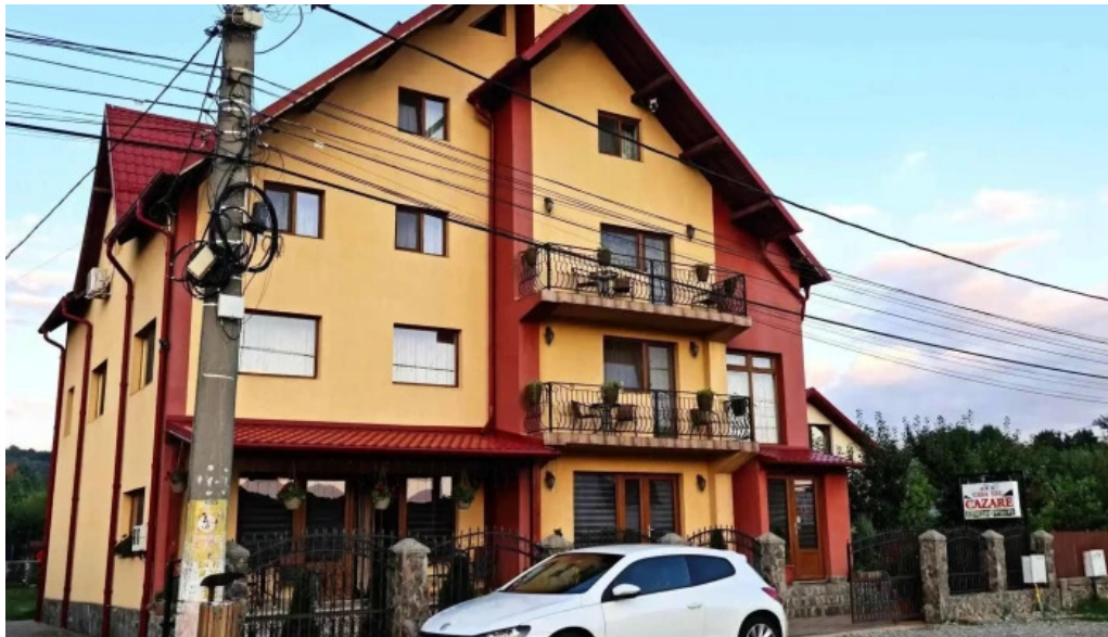
Casa leu zon?