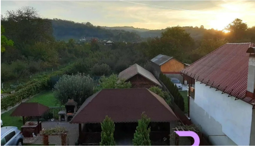
Casa leu de la vizitatori