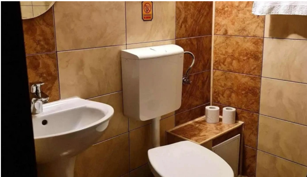
Casa leu de la proprietar