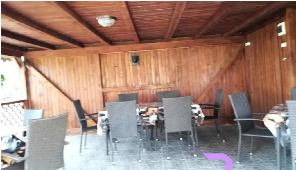
Casa leu dotari