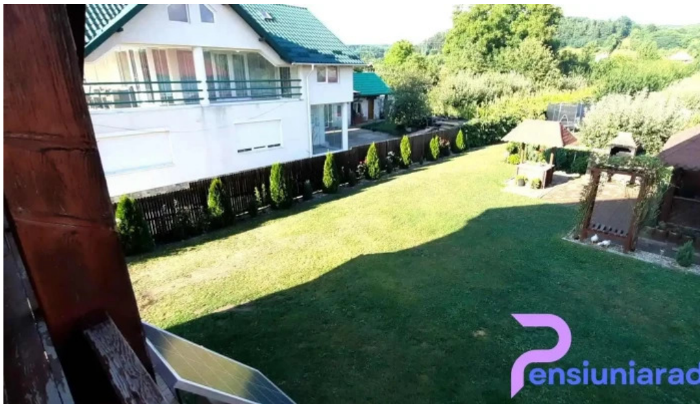
Casa leu videoclipuri