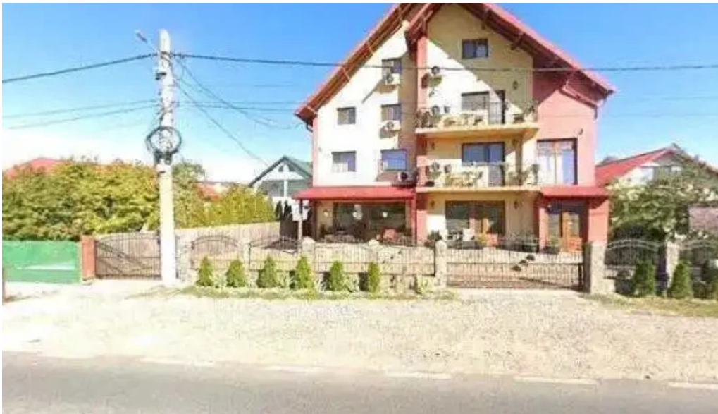
Casa leu street view si 360deg