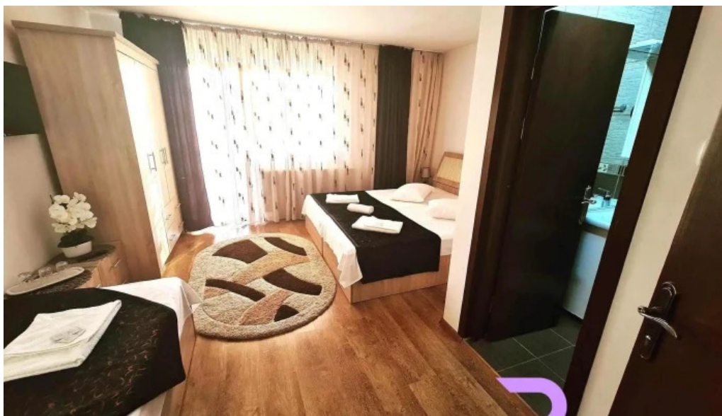
Casa leu camere