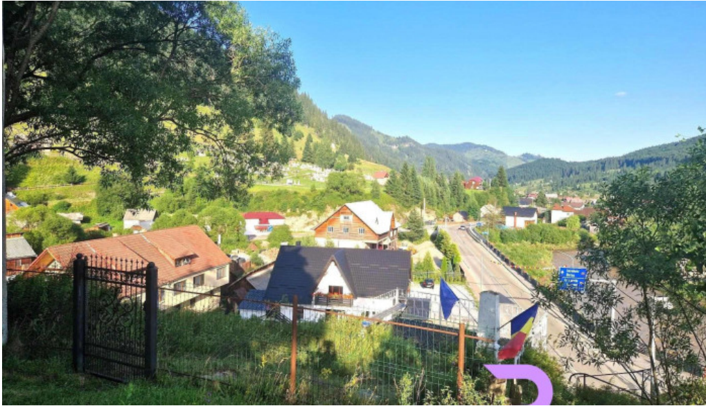
Cabana de pe stanca hotel unde