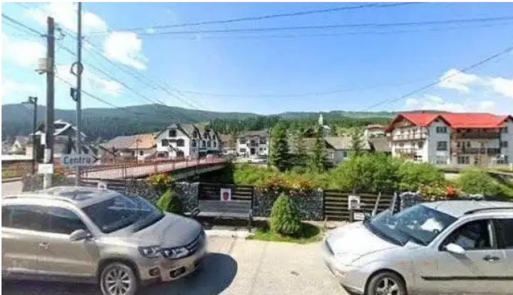
Cabana de pe stanca hotel street view si 360deg