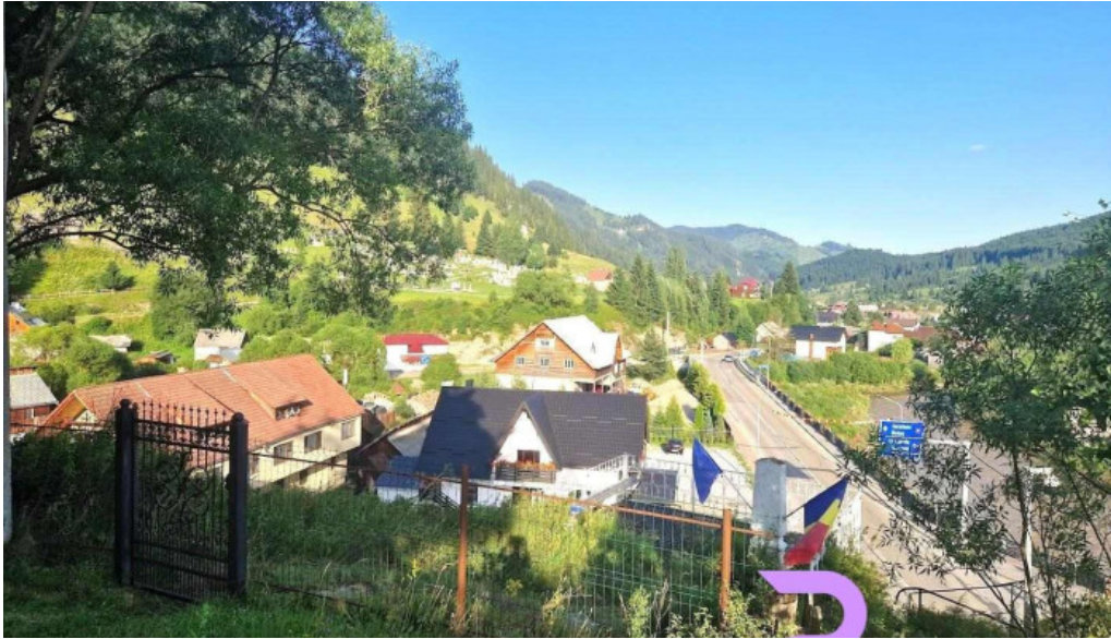
Cabana de pe stanca hotel cirlibaba nou?