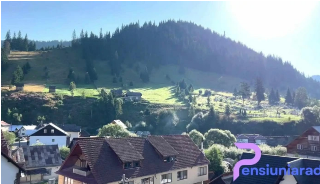
Cabana de pe stanca hotel videoclipuri