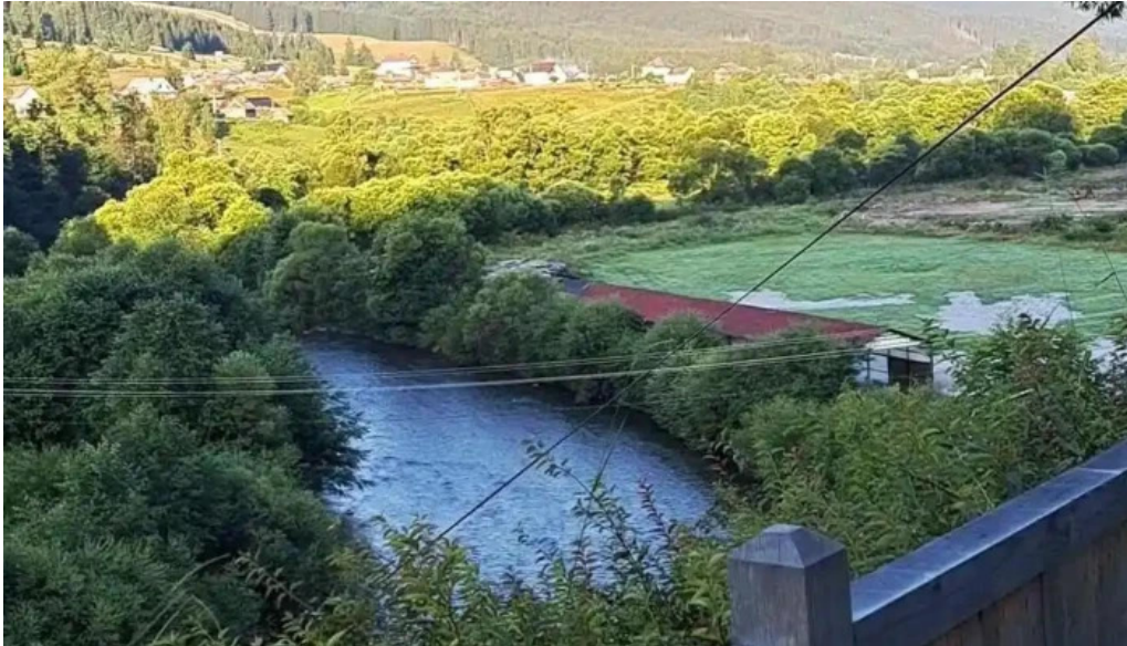
Cabana de pe stanca hotel de la vizitatori