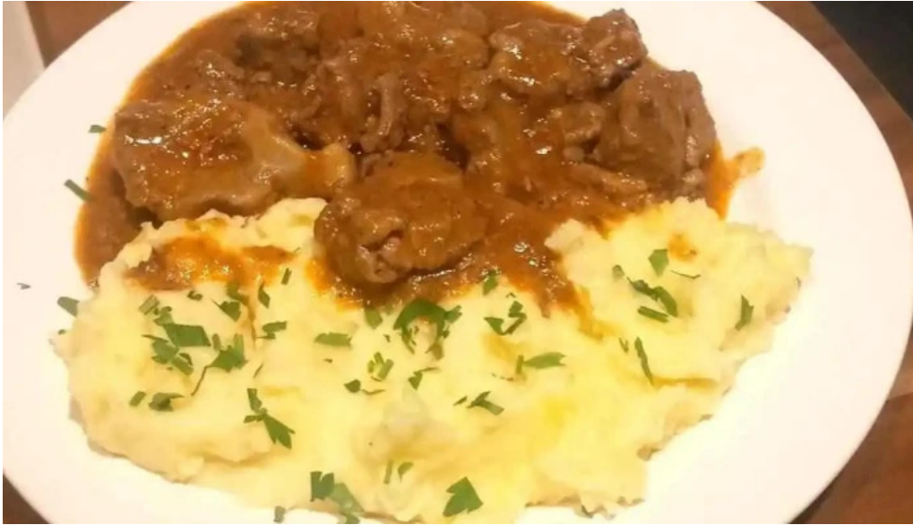
Cabana de pe stanca hotel mancaruribauturi