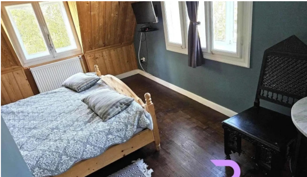
Cabana de pe stanca hotel camere