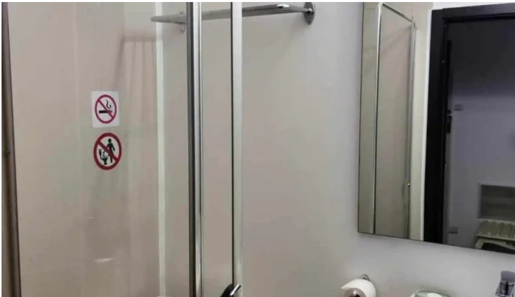
Hotel nevis fundeni de la proprietar