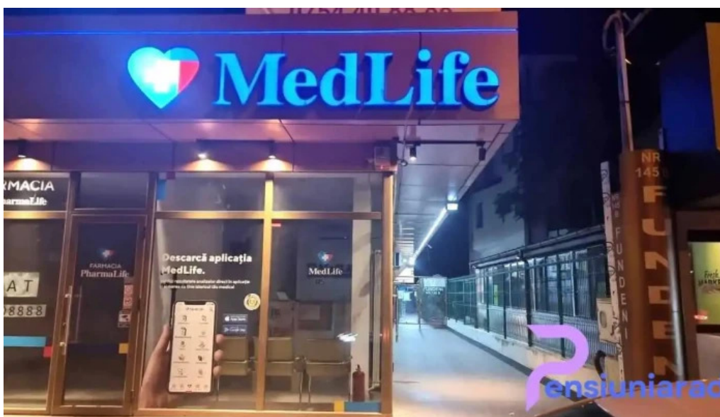
Hotel nevis fundeni bucure?ti