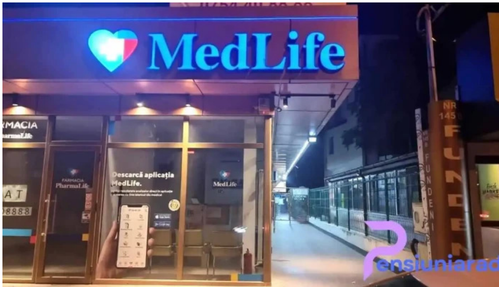
Hotel nevis fundeni recenzii