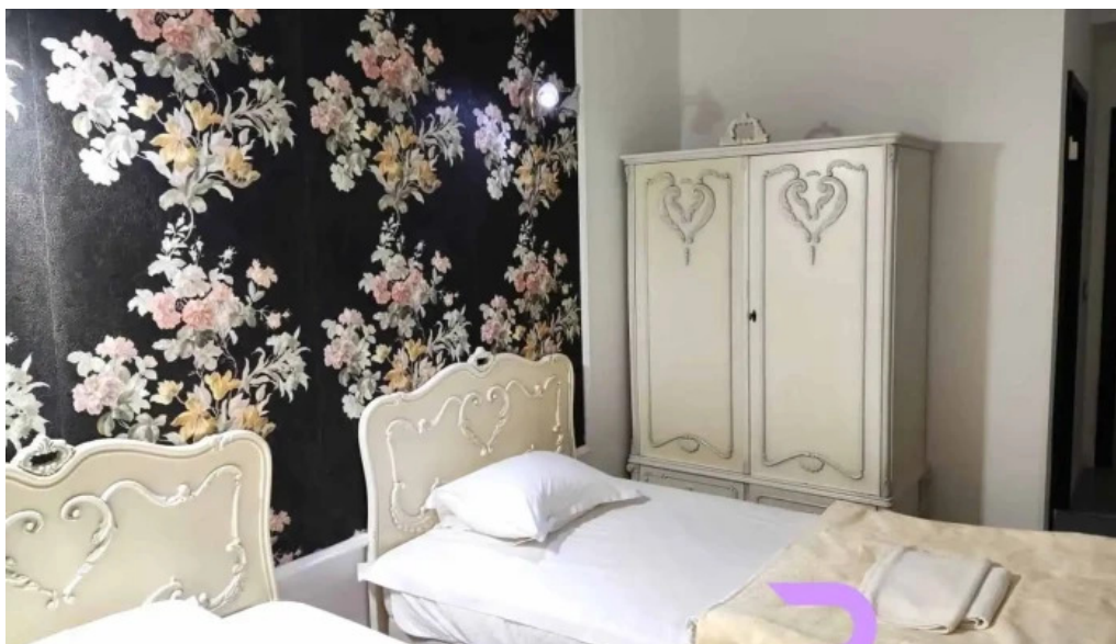
Hotel nevis fundeni camere