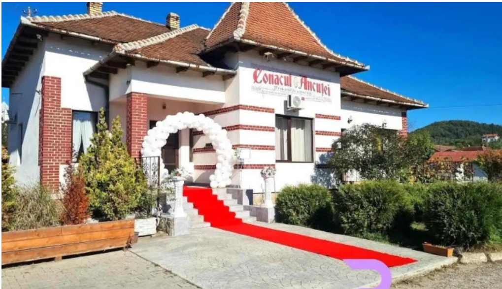
Conacul ancutei brad