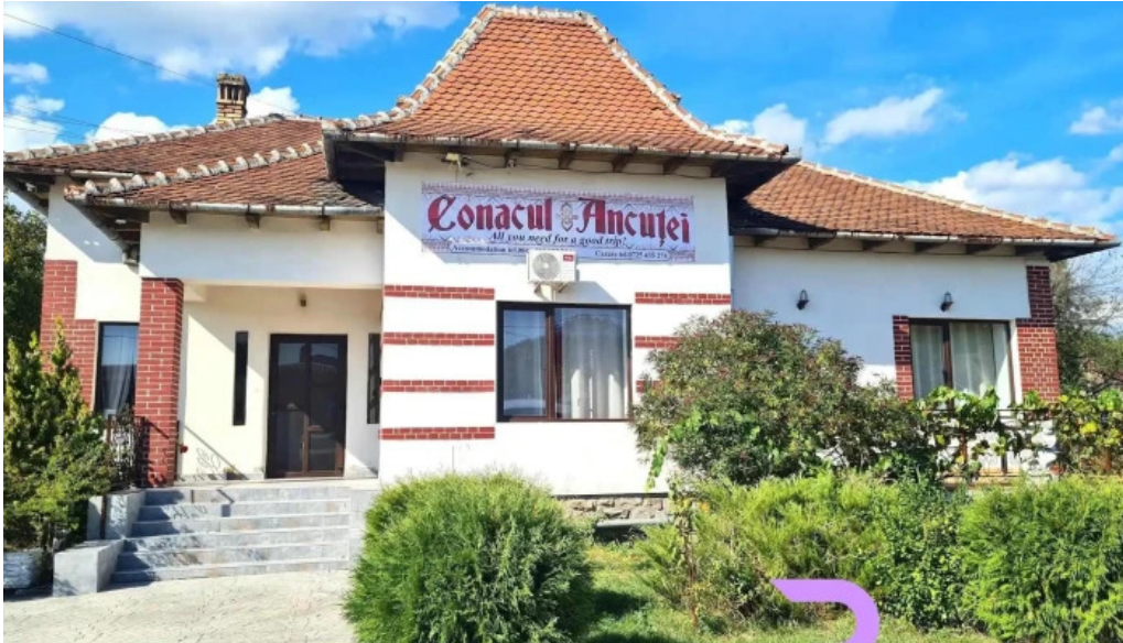
Conacul ancutei exterior