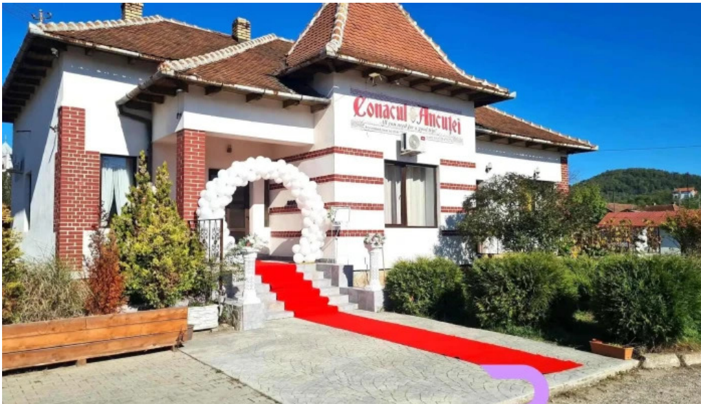
Conacul ancutei zon?