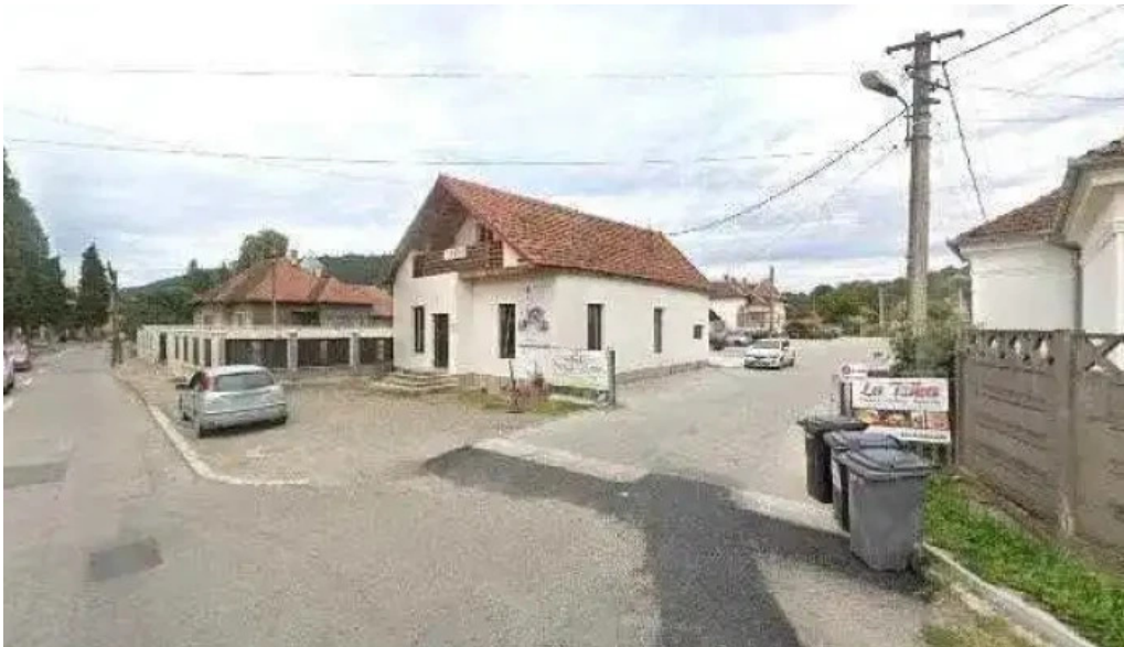
Conacul ancutei street view si 360deg