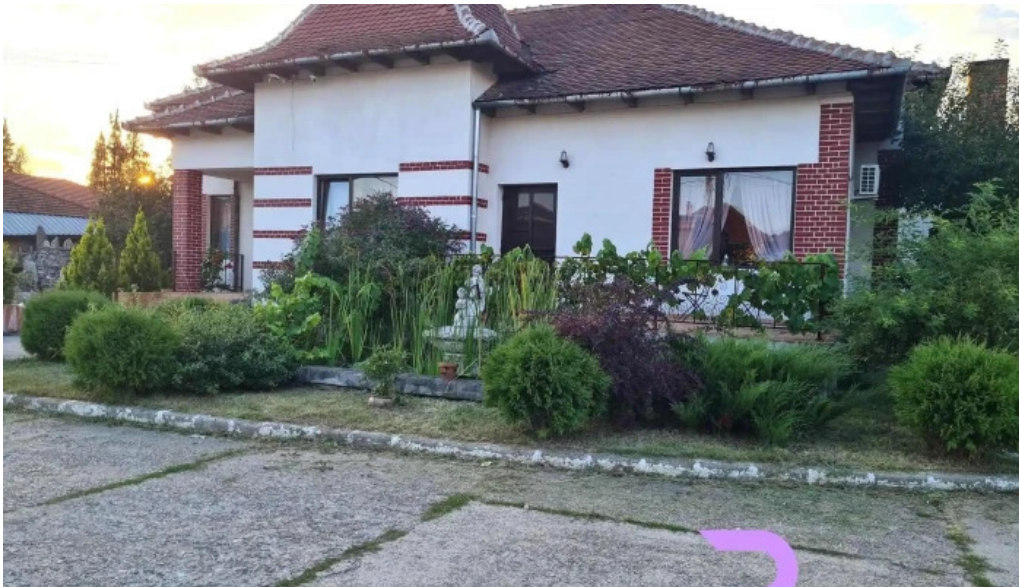
Conacul ancutei de la vizitatori