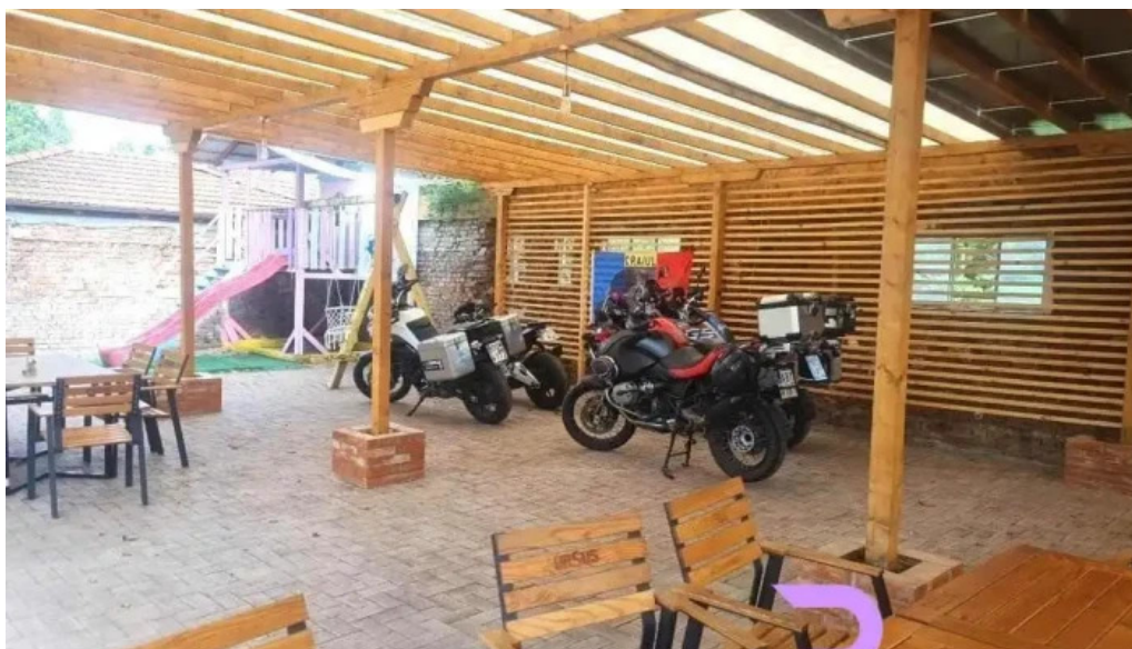
Conacul ancutei de la proprietar