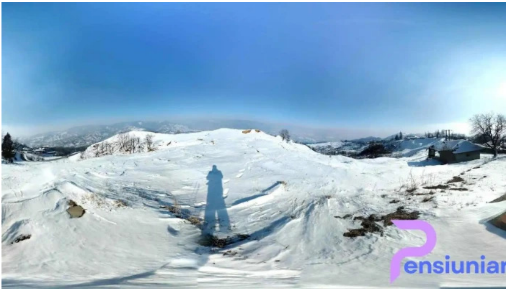
?otri le ?otri le