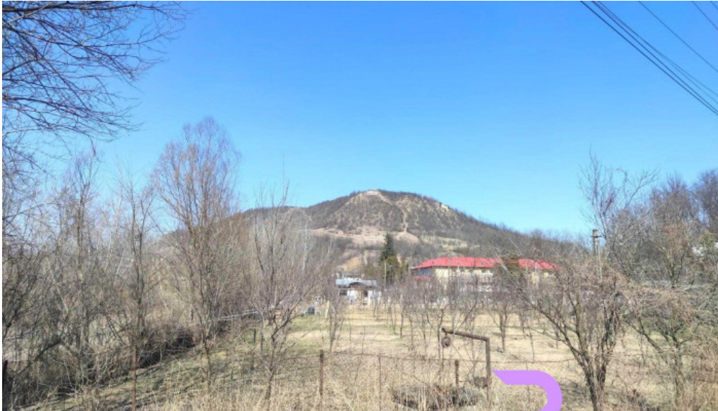
Soimari aproape de mine