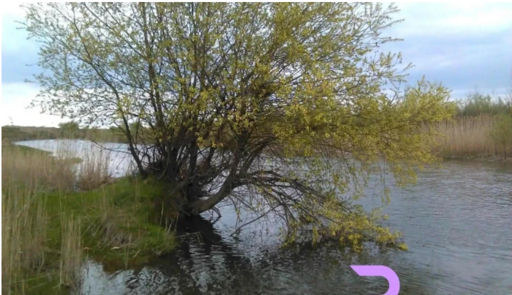
Zamostea site web