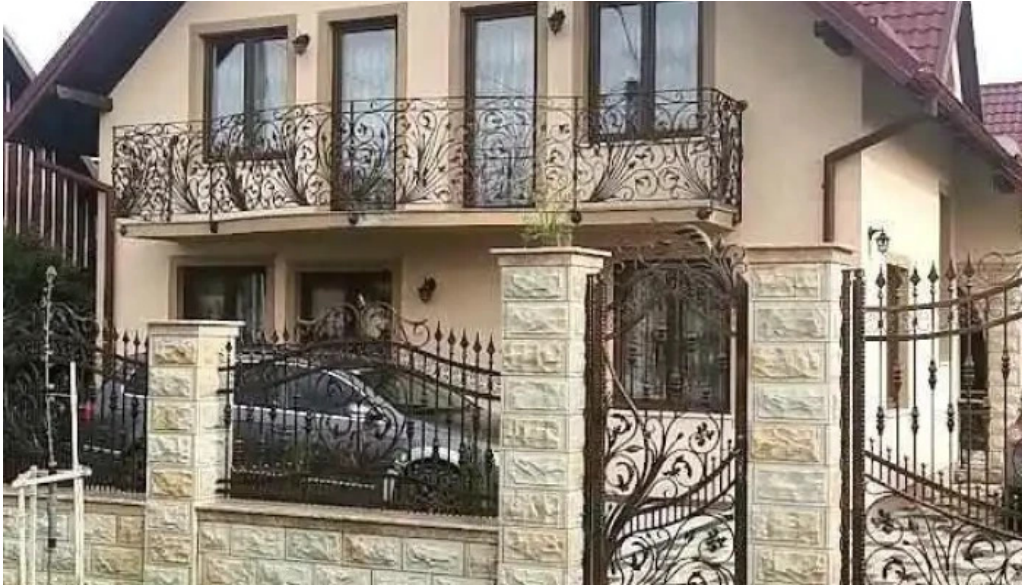
Vicovu de sus vicovu de sus