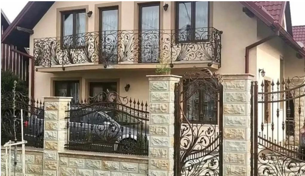
Vicovu de sus instagram