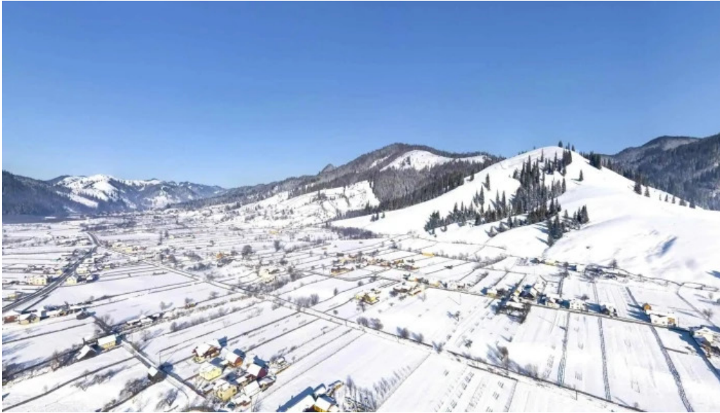
Vatra moldovitei street view si 360deg