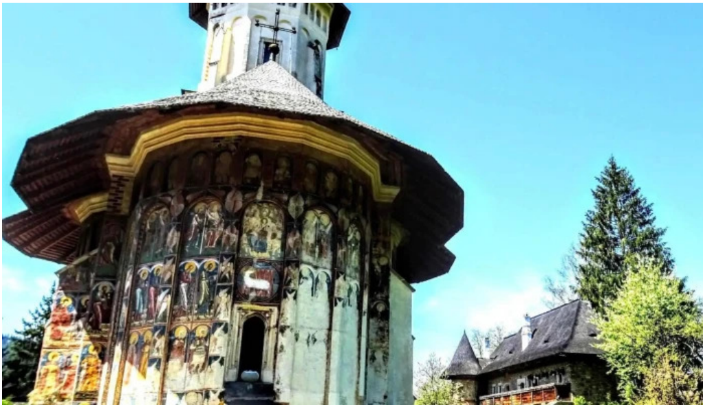
Vatra moldovitei telefon