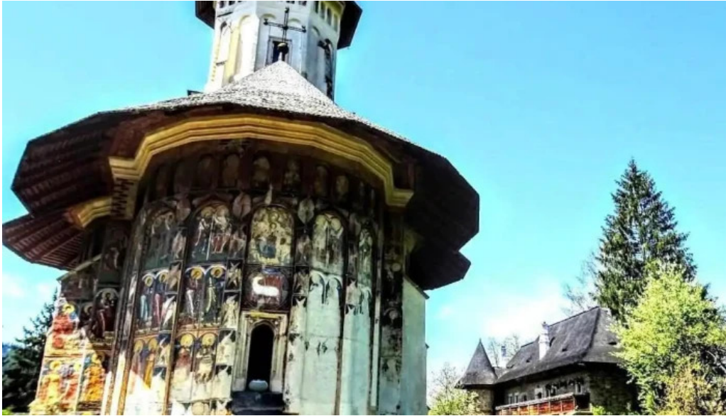
Vatra moldovi?ei vatra moldovi?ei