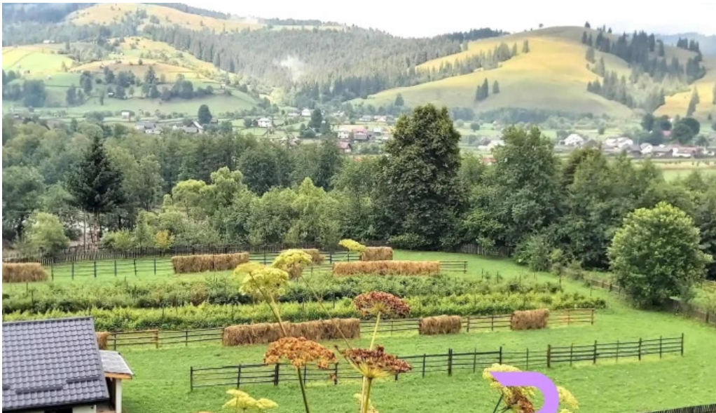
Vatra moldovitei munte