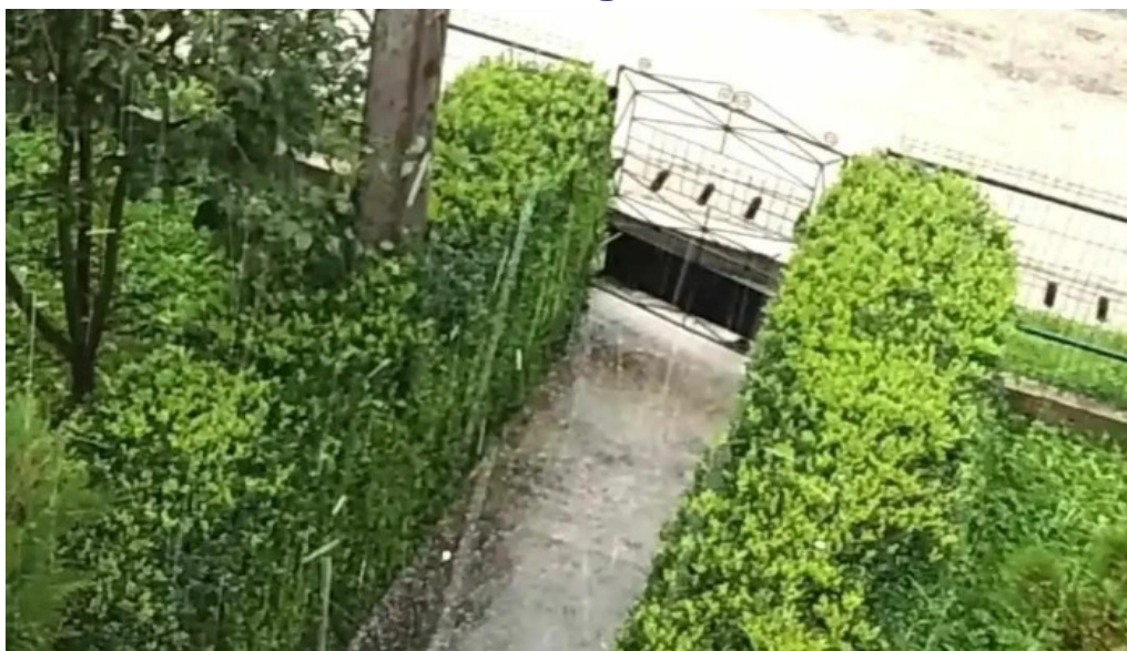
Comuna crucea videoclipuri