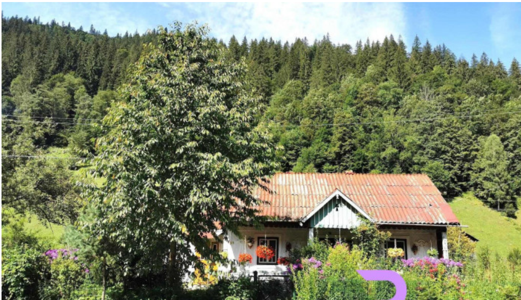
Comuna crucea unde