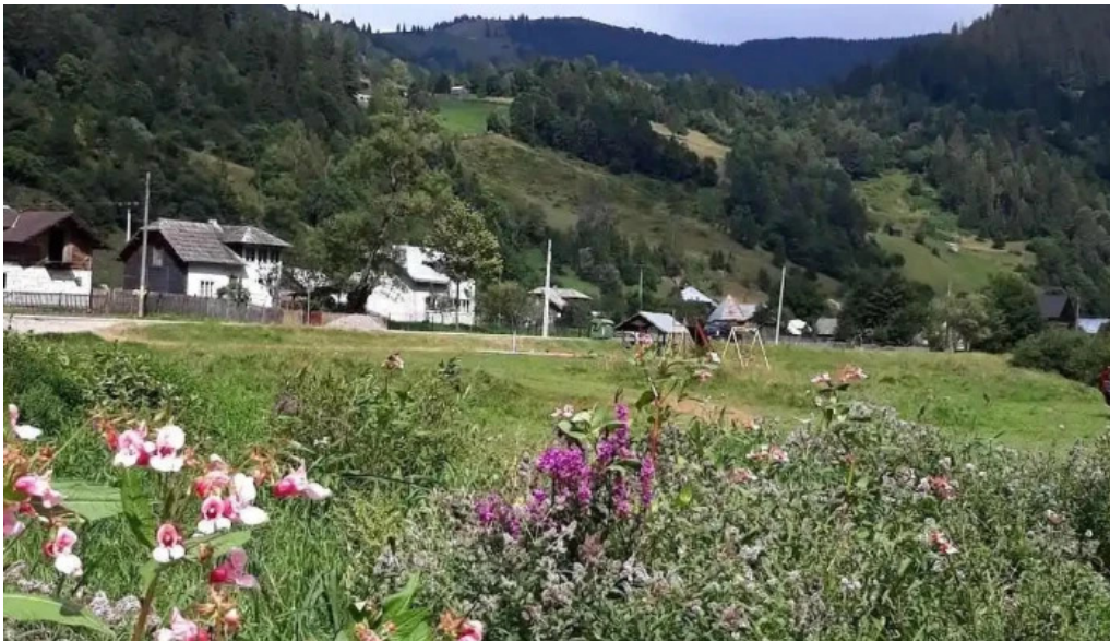
Comuna crucea munte