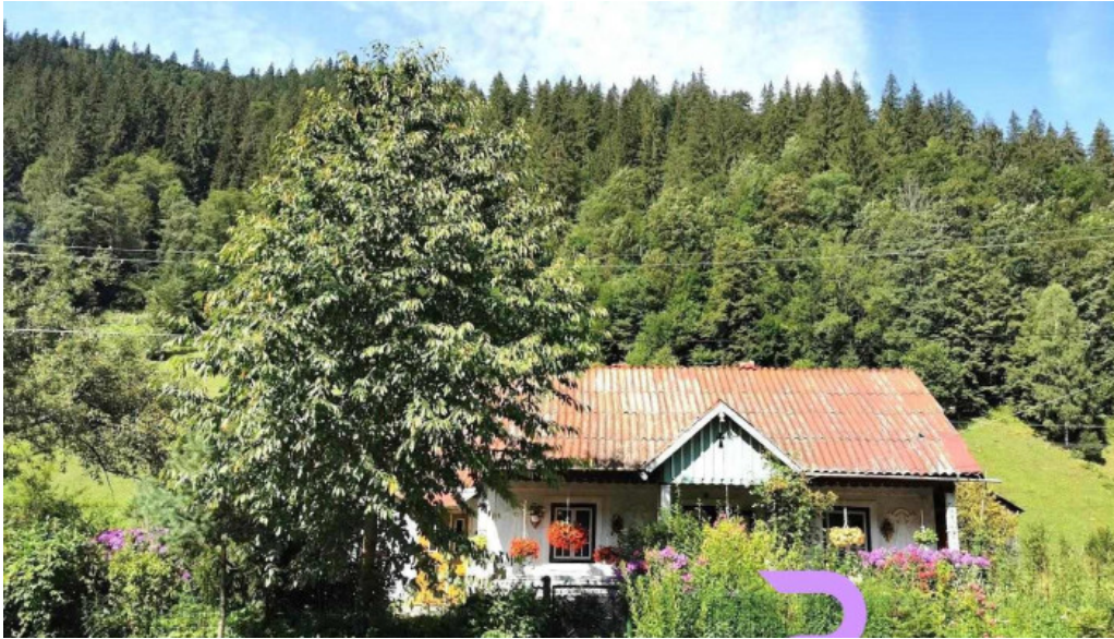
Comuna crucea vacio