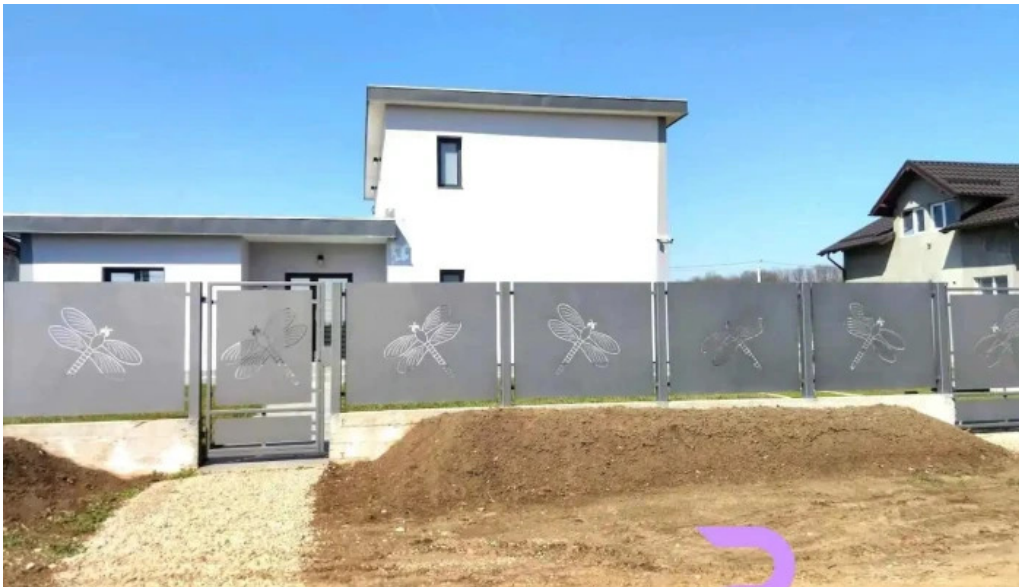
Targ?oru vechi targ?oru vechi