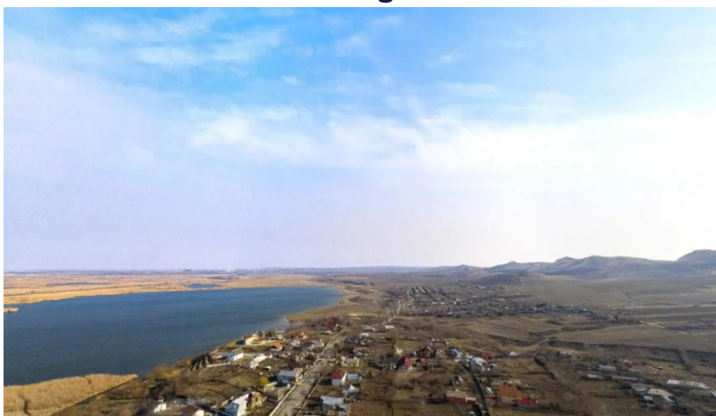
Somova street view si 360deg