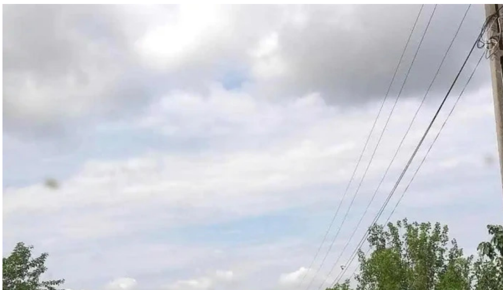
Somova deschis acum