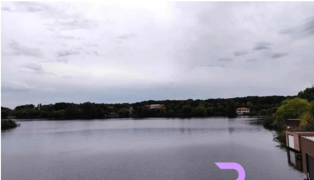
Silistea snagovului zon?