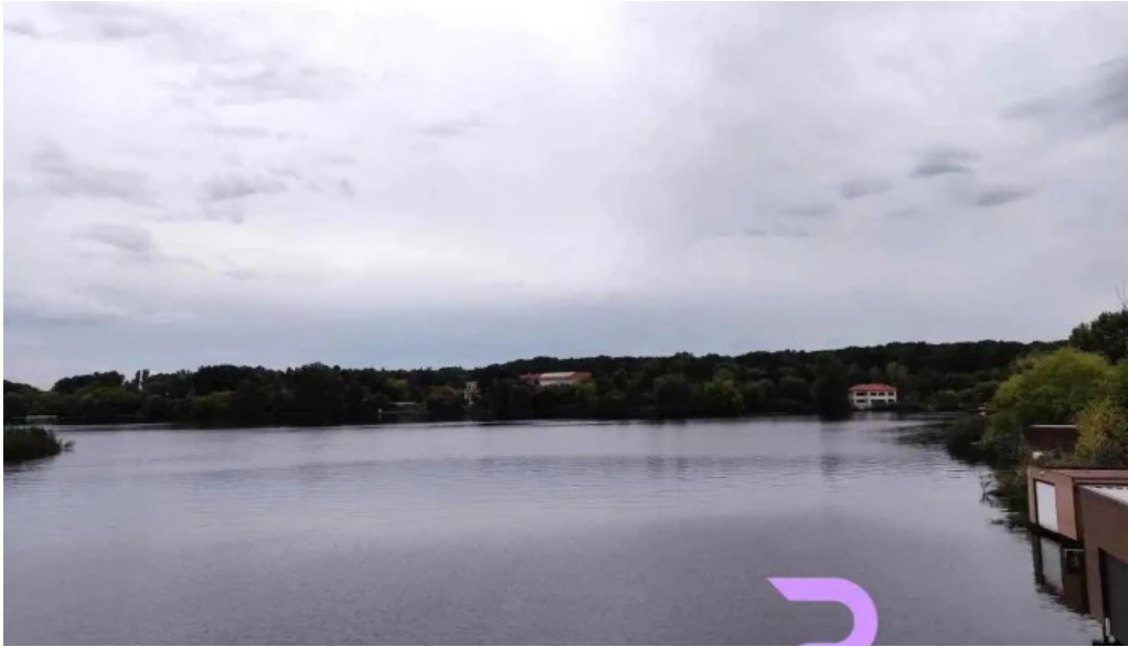
Sili?tea snagovului sili?tea snagovului