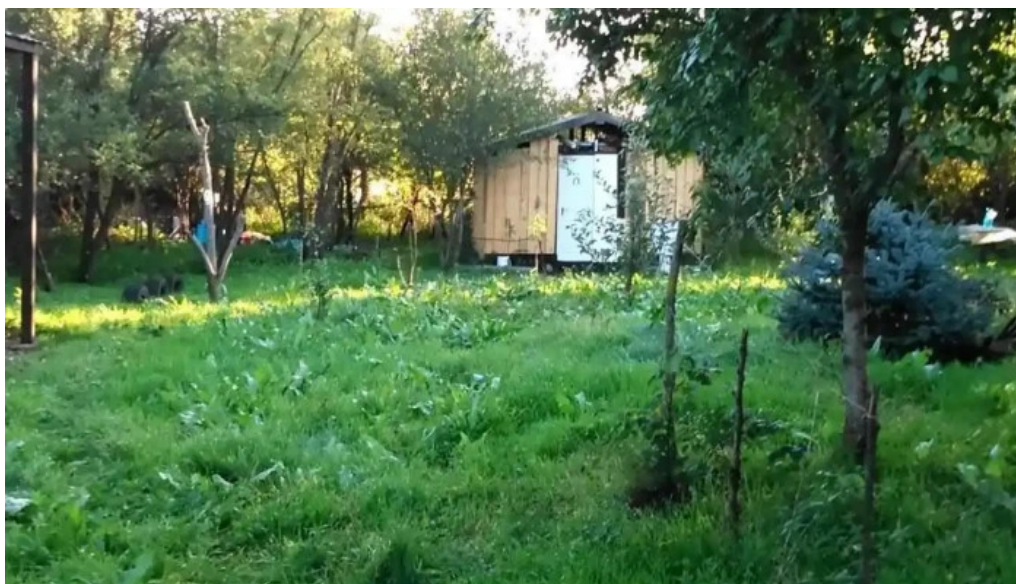
Rasuceni aproape de mine